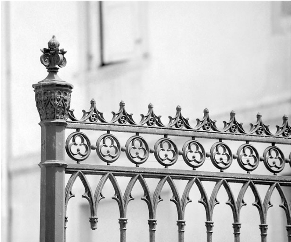
Travée fixe, côté presbytère : partie supérieure du poteau.