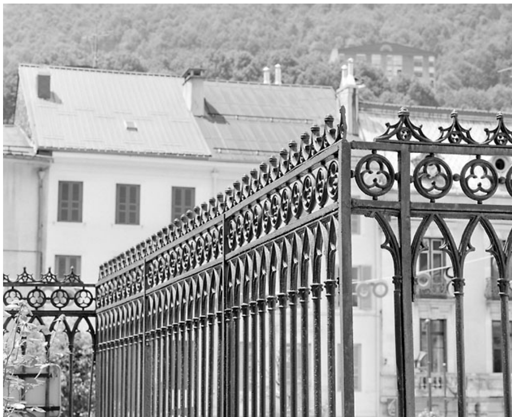
Travée fixe en retour, côté presbytère.