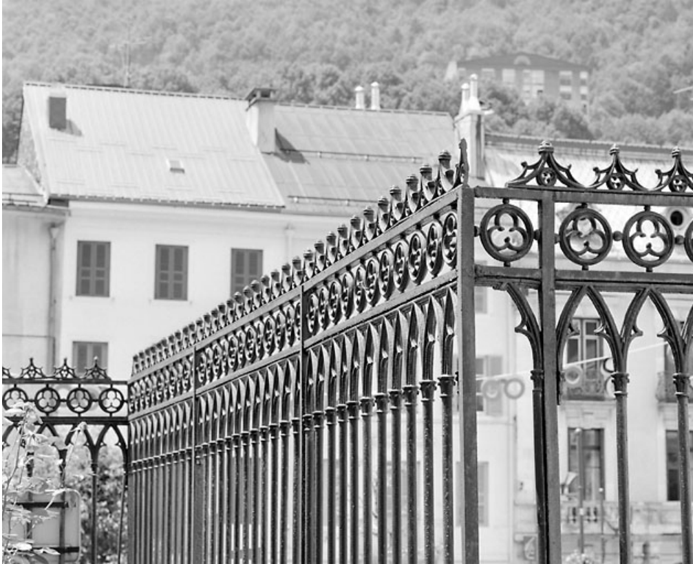
Travée fixe en retour, côté presbytère.