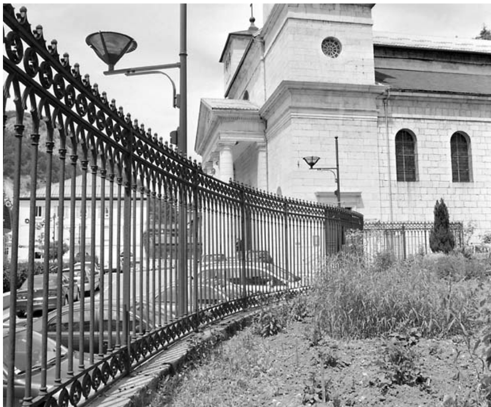
Vue d'ensemble, depuis le jardin du presbytère. 39, Morez place Notre-Dame