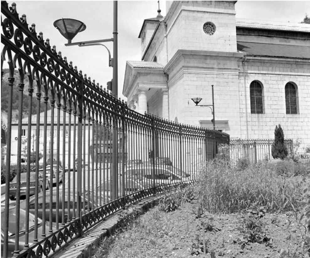
Vue d'ensemble, depuis le jardin du presbytère.