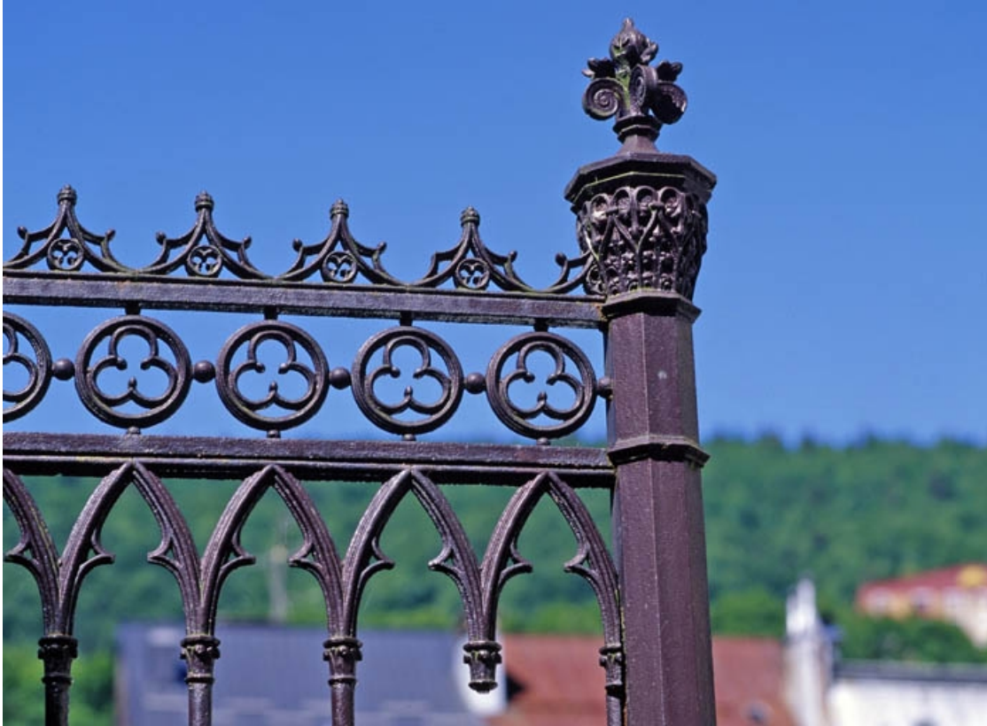
Travée fixe, côté presbytère : partie supérieure du poteau. 39, Morez place Notre-Dame