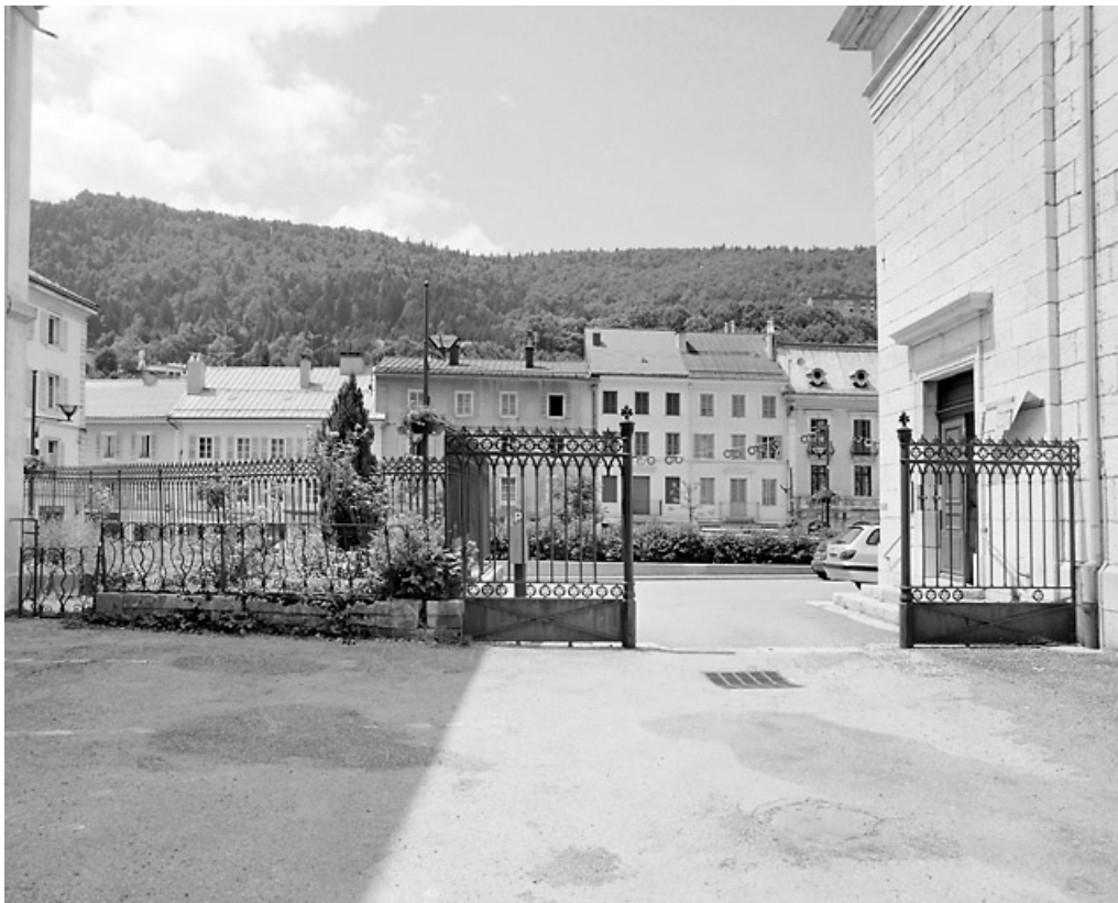
Vue d'ensemble, depuis la cour du presbytère.