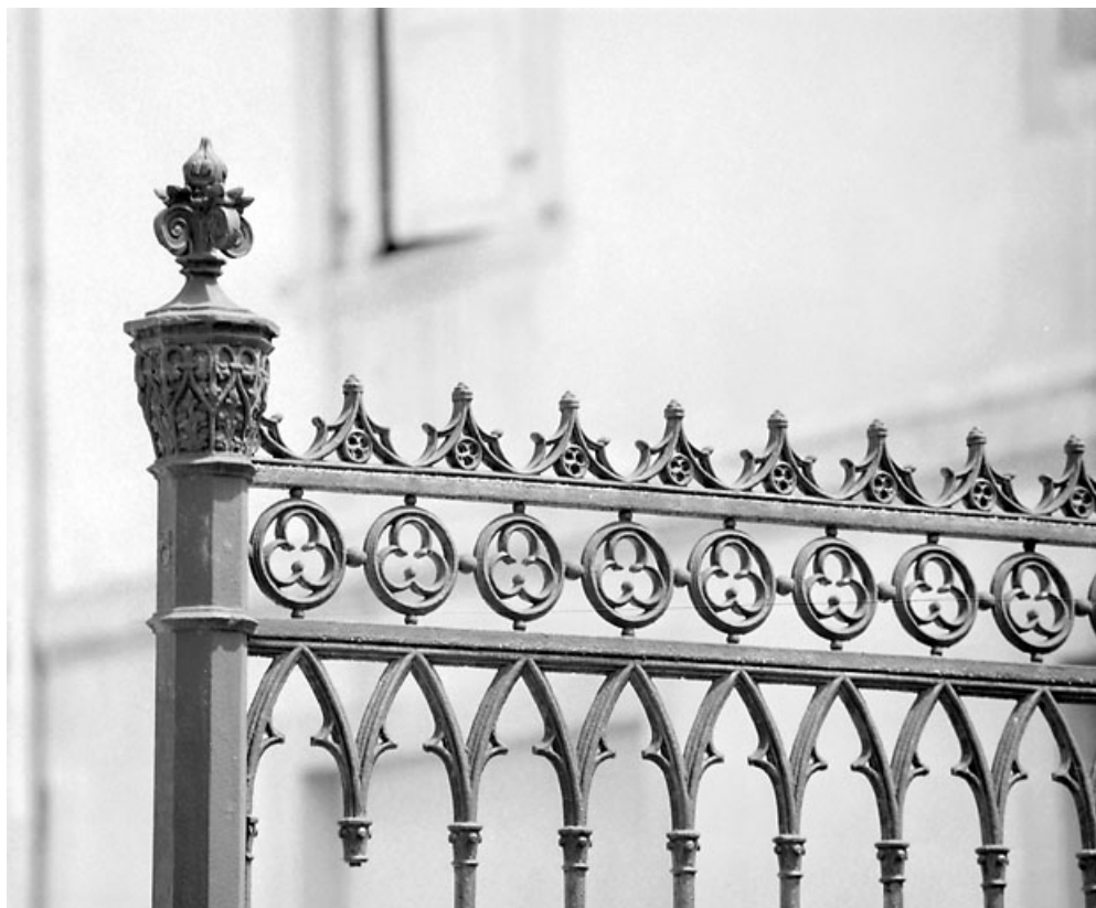
Travée fixe, côté presbytère : partie supérieure du poteau. 39, Morez place Notre-Dame