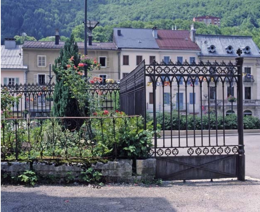
Travée fixe, côté presbytère.