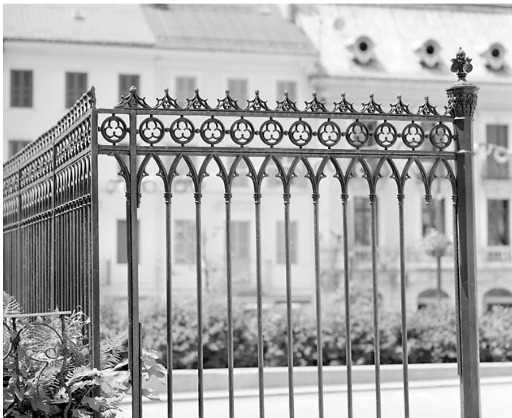
Travée fixe, côté presbytère : partie haute. 39, Morez place Notre-Dame