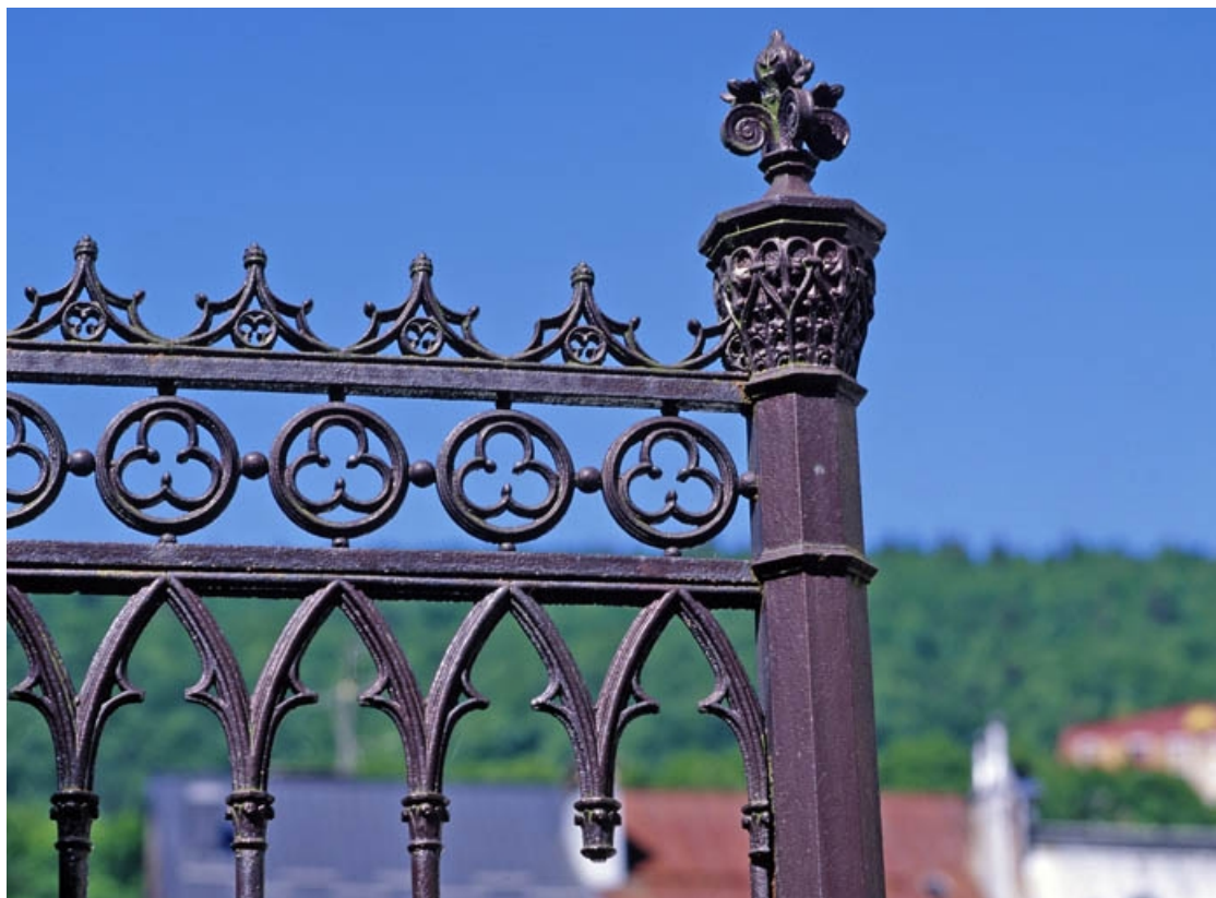
Travée fixe, côté presbytère : partie supérieure du poteau. 39, Morez place Notre-Dame