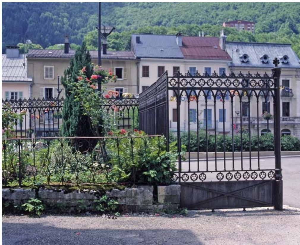
Travée fixe, côté presbytère.