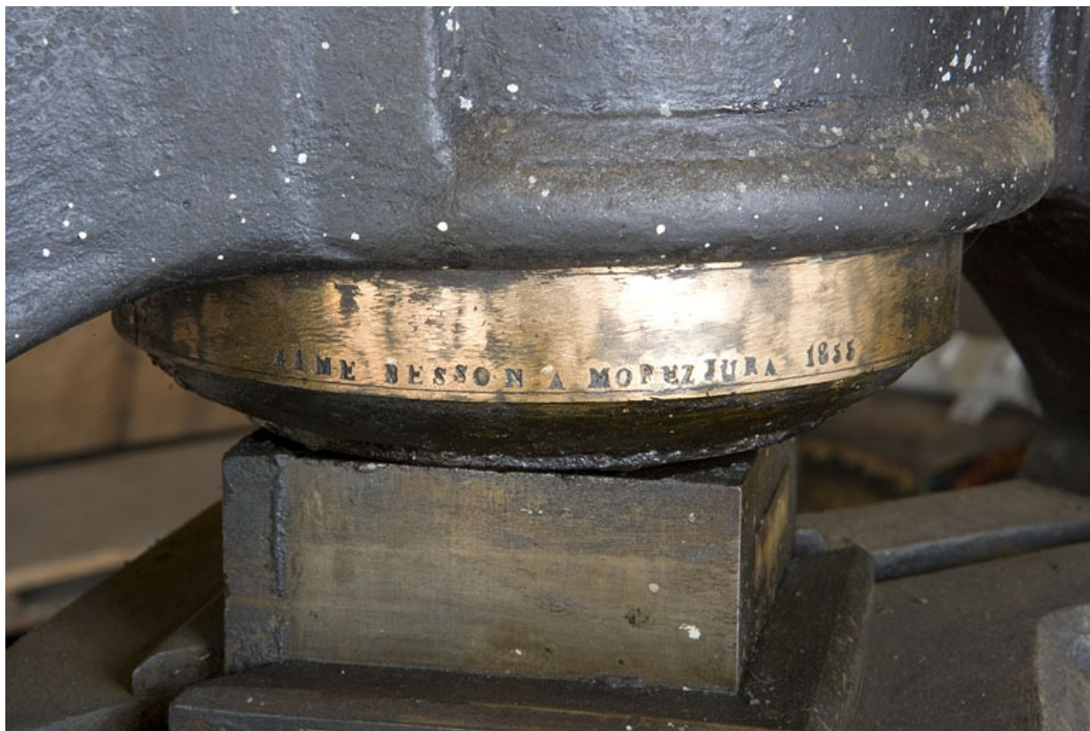
Inscription concernant le constructeur (Besson) et date (1855).