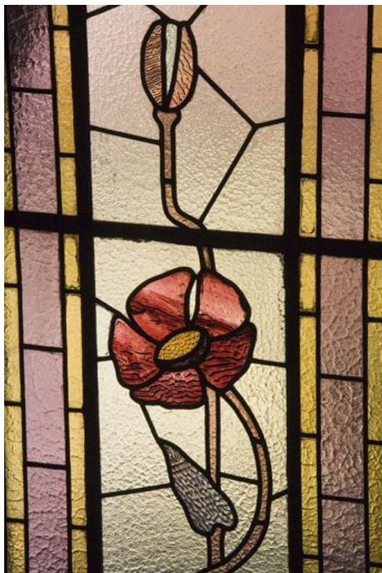
Troisième registre, verrière gauche : coquelicot. 39, Morez, 5 avenue Charles de Gaulle