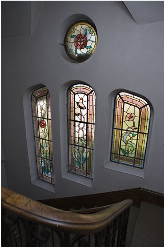
Intérieur de la cage d'escalier : verrières des troisième et quatrième registres. 39, Morez, 5 avenue Charles de Gaulle