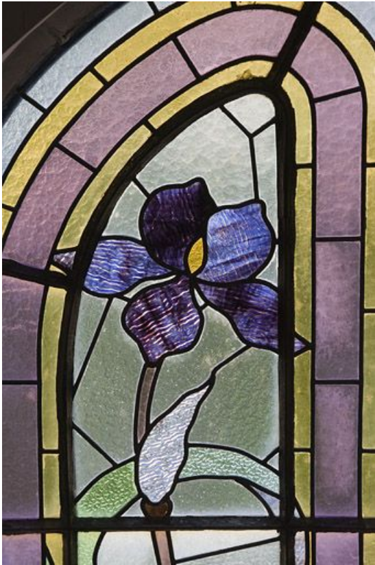
Deuxième registre, verrière gauche : iris.