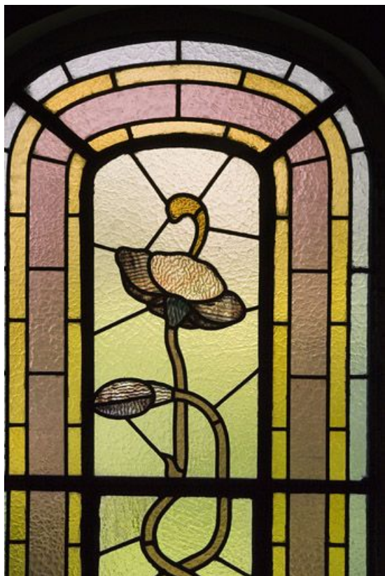
Troisième registre, verrière centrale : coquelicot.