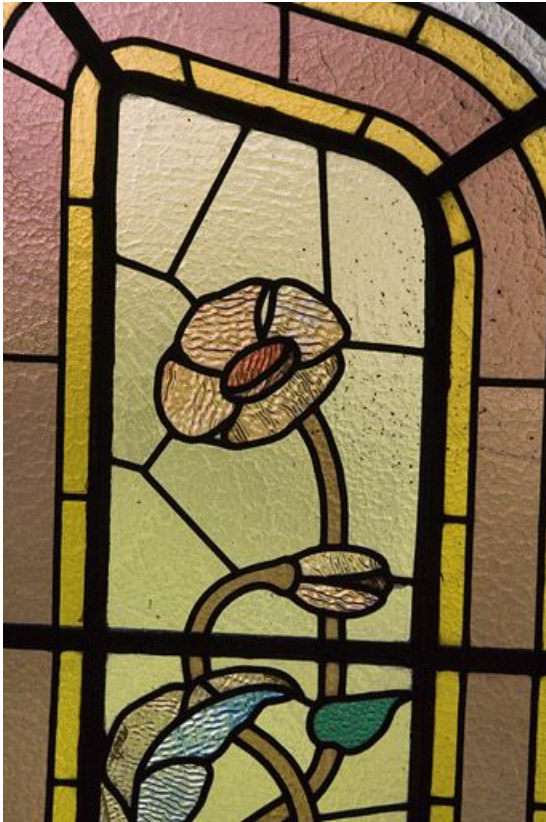
Troisième registre, verrière droite : coquelicot. 39, Morez, 5 avenue Charles de Gaulle