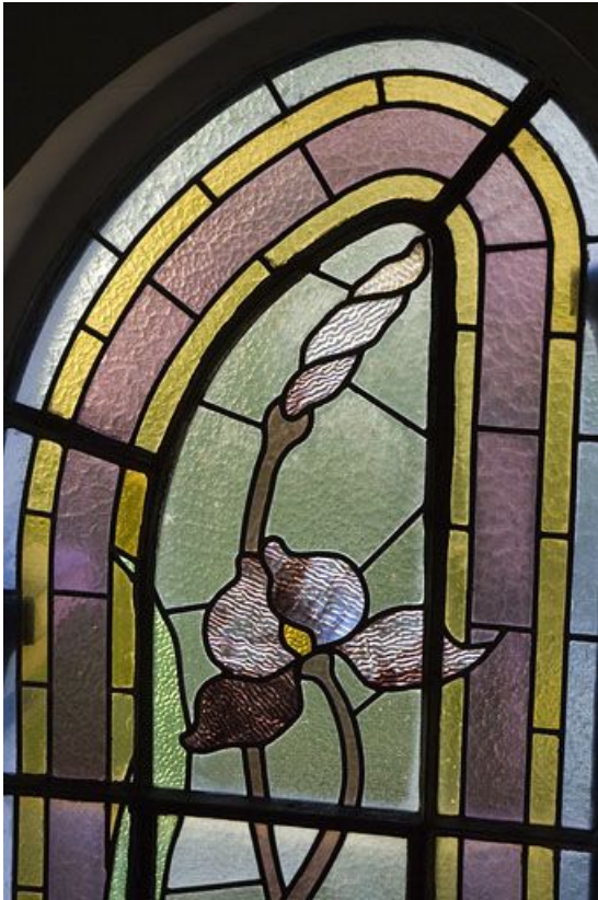
Deuxième registre, verrière centrale : iris.