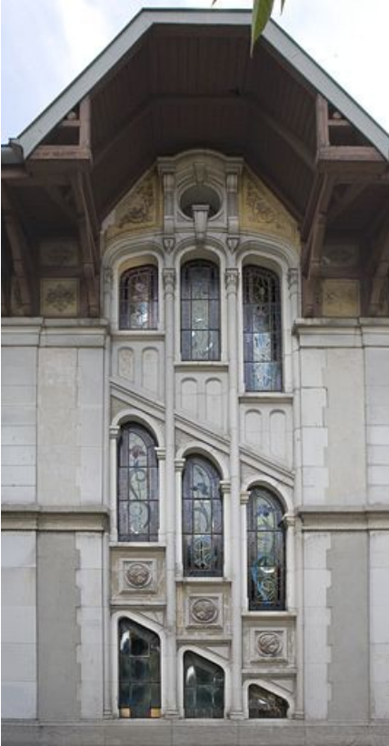
Vue d'ensemble, depuis l'extérieur.