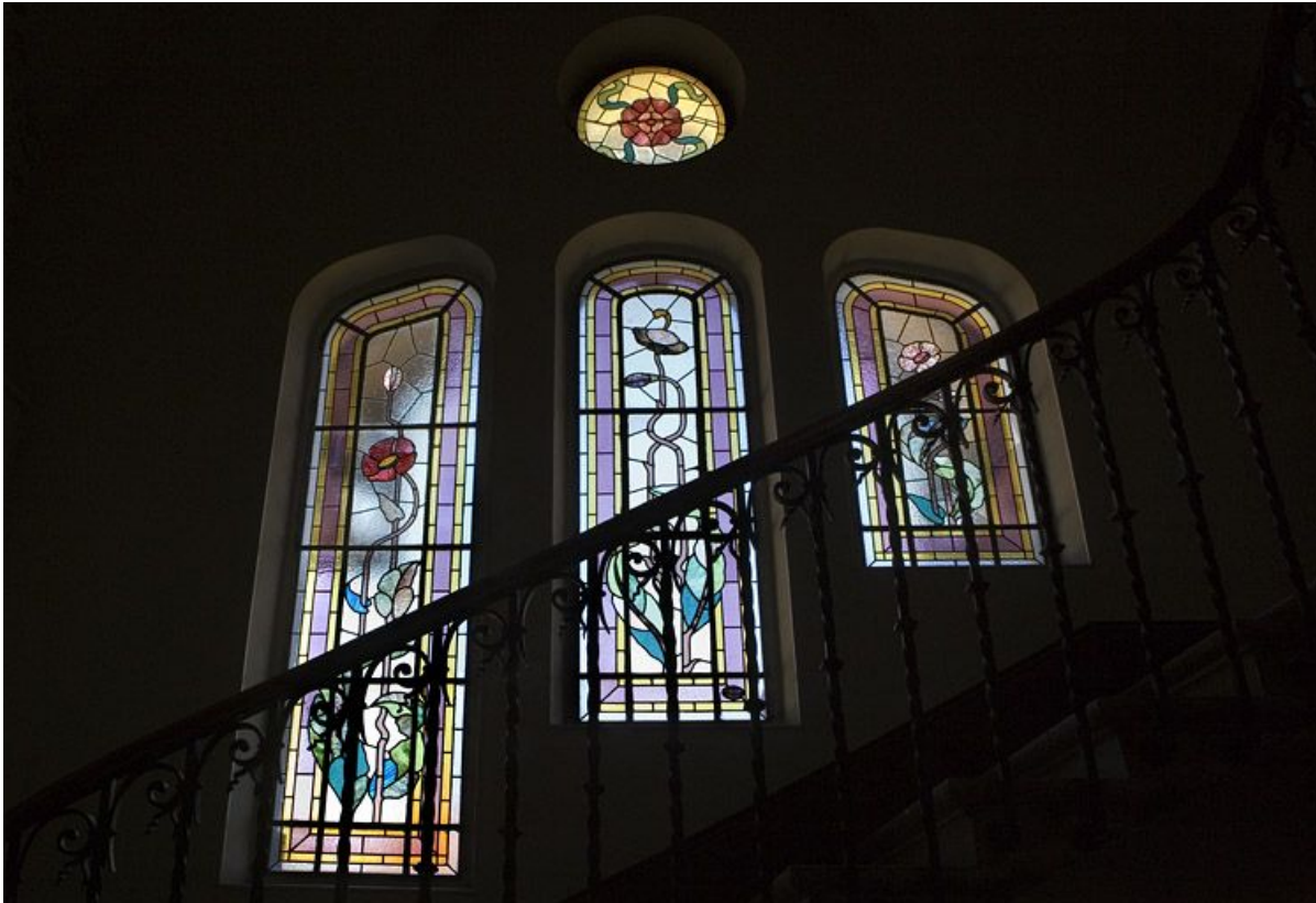
Verrières du troisième registre, vues en contre-plongée.