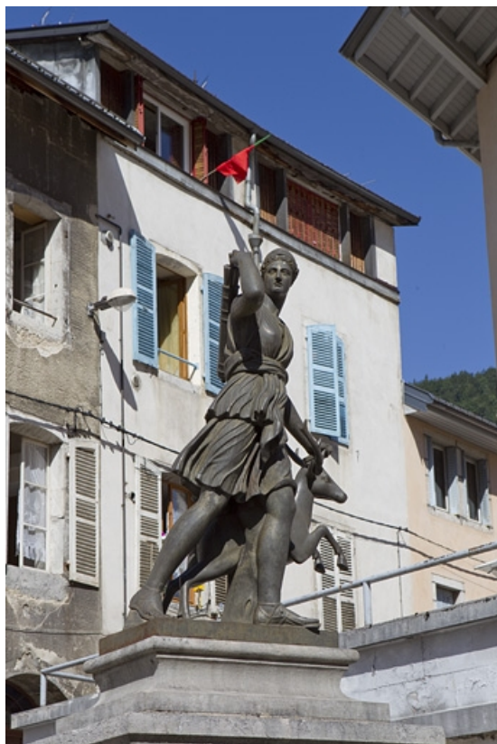
Vue de trois quarts gauche.