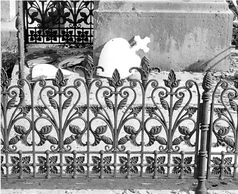
Face antérieure : détail.

39, Morez, 10 allée du 3 Septembre, lieudit : cimetière, quartier 2