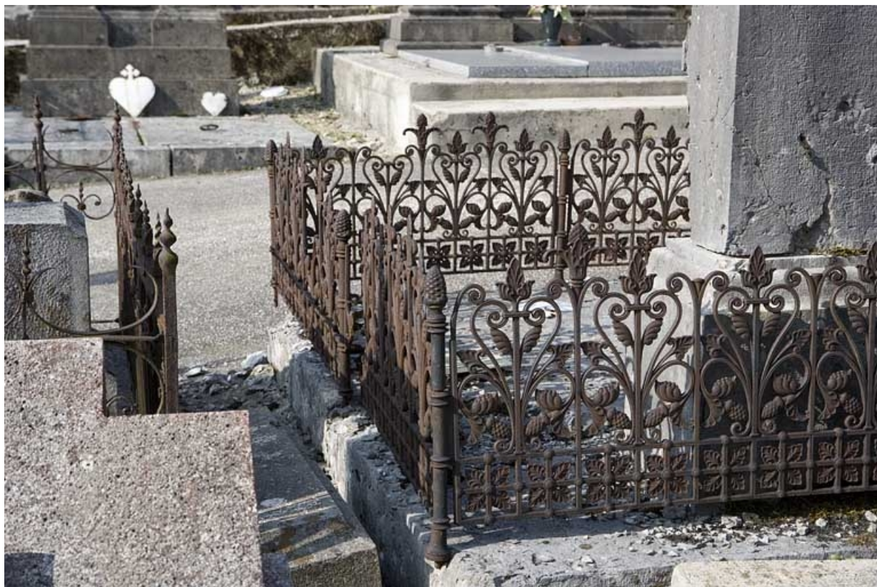
Vue d'ensemble : faces postérieure et latérale droite.

39, Morez, 10 allée du 3 Septembre, lieudit : cimetière, quartier 2