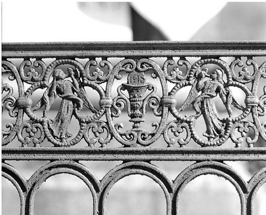
Calice entre deux anges musiciens.

39, Morez, 10 allée du 3 Septembre, lieudit : cimetière, quartier 2