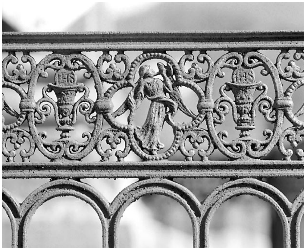
Ange musicien entre deux calices.

39, Morez, 10 allée du 3 Septembre, lieudit : cimetière, quartier 2