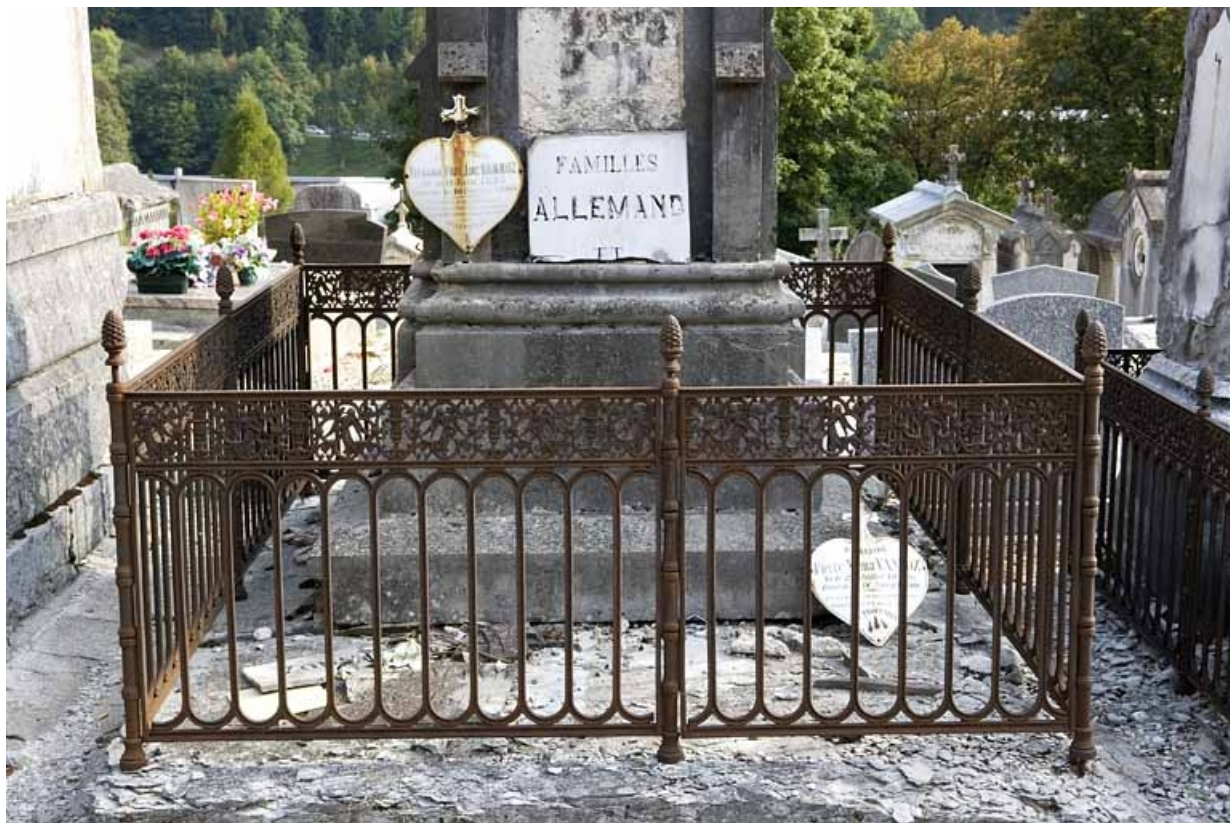
Vue d'ensemble, de la face antérieure.

39, Morez, 10 allée du 3 Septembre, lieudit : cimetière, quartier 2