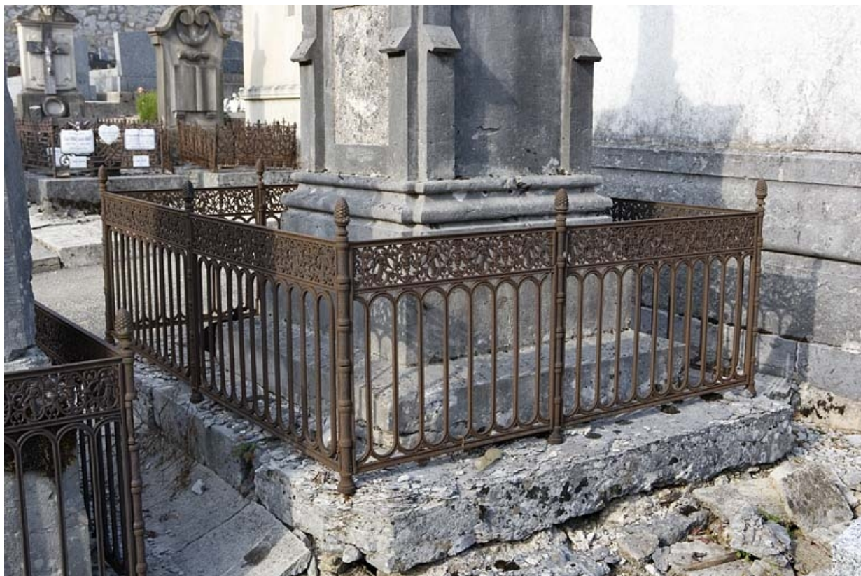
Vue d'ensemble, de la face postérieure.

39, Morez, 10 allée du 3 Septembre, lieudit : cimetière, quartier 2