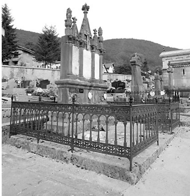
Vue d'ensemble : élévations antérieure et latérale gauche.

39, Morez, 10 allée du 3 Septembre, lieudit : cimetière, quartier 1