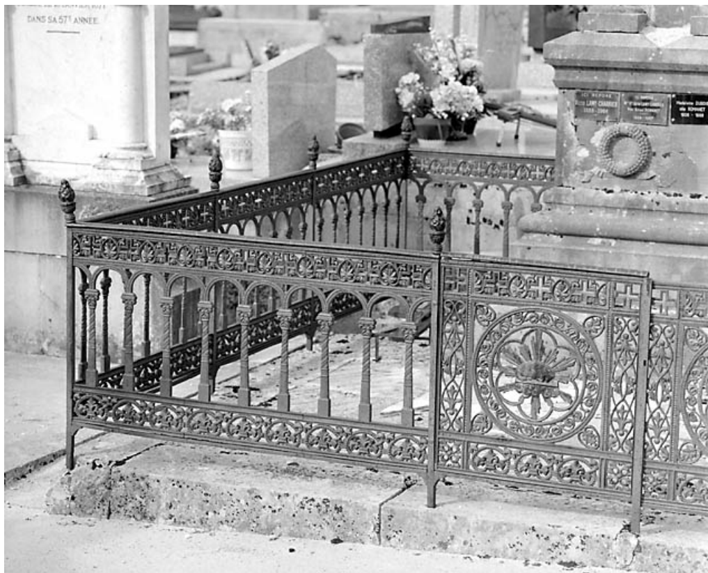
Élévation antérieure : grille fixe et vantail du portillon.

39, Morez, 10 allée du 3 Septembre, lieudit : cimetière, quartier 1