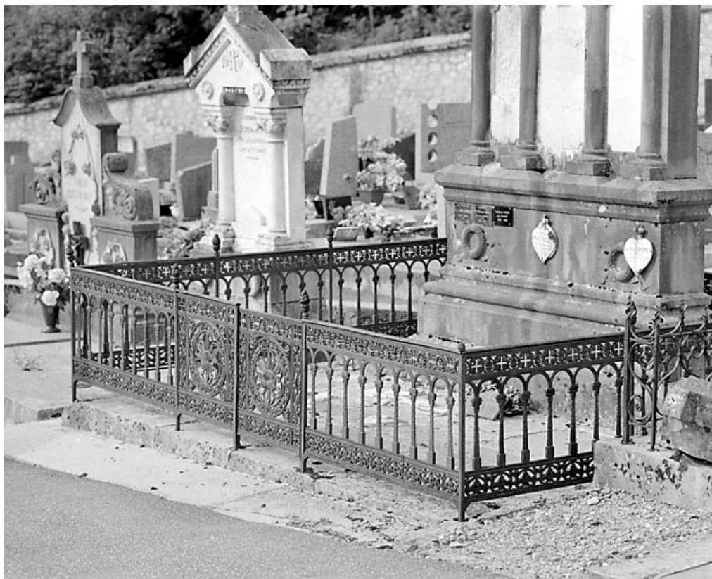
Vue d'ensemble, de trois quarts droite.

39, Morez, 10 allée du 3 Septembre, lieudit : cimetière, quartier 1