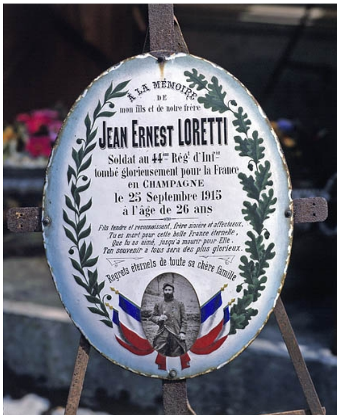
Plaque de Jean-Ernest Lorette.