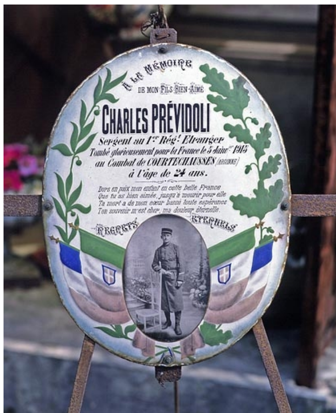
Plaque de Charles Prévoldi.