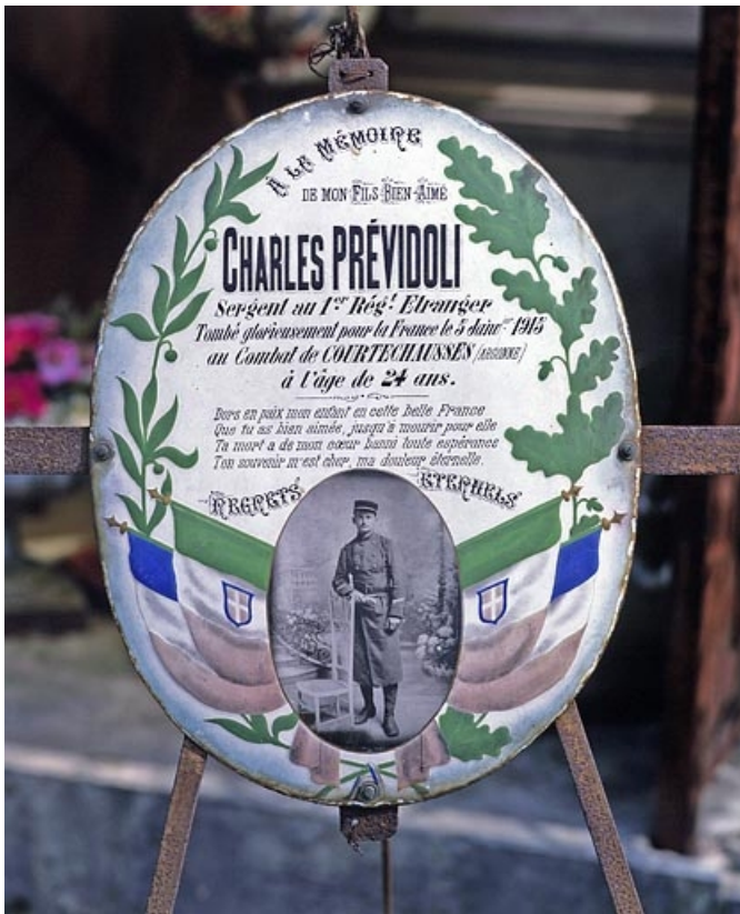
Plaque de Charles Prévoldi.