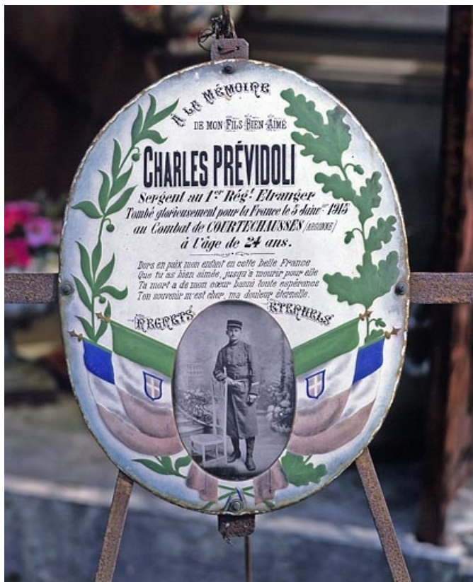
Plaque de Charles Prévoldi.