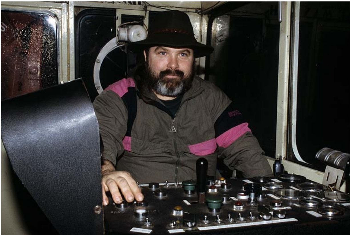
Poste de conduite et mécanicien (conducteur).

39, Morez, 15, 17 avenue Charles de Gaulle