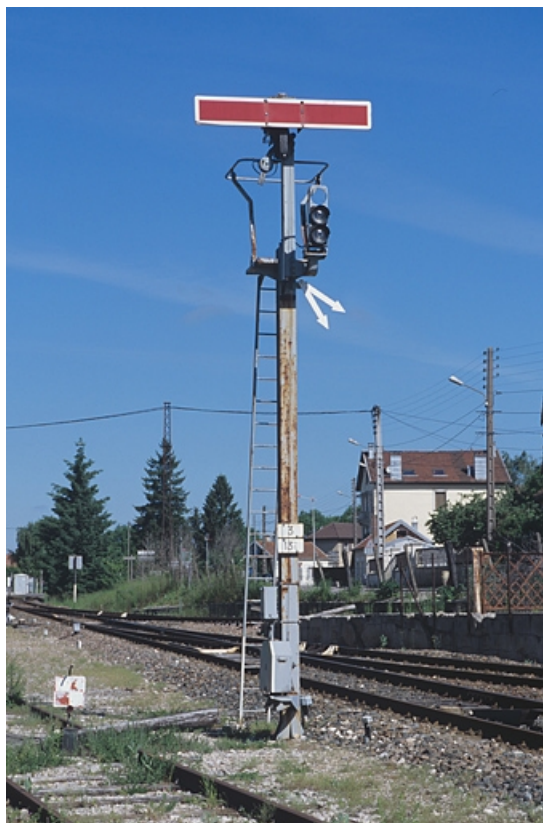
Sémaphore côté Andelot-en-Montagne : vue d'ensemble, en position fermée.