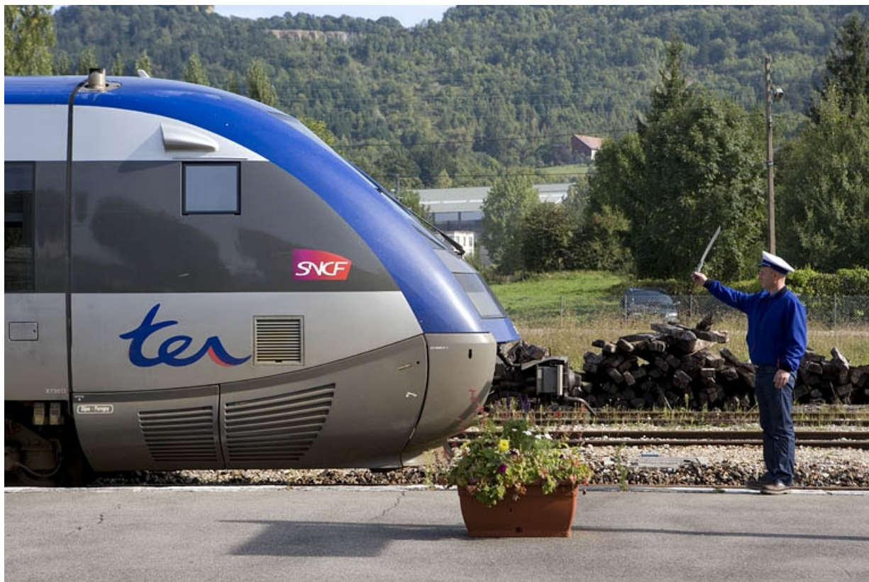
Agent de circulation avec guidon de départ. 39, Champagnole, 13 avenue de la Gare