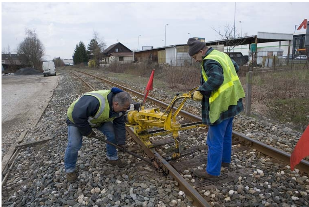
Utilisation par les agents de l'Équipement. in, Jura