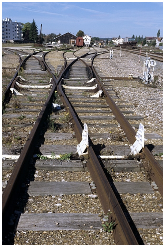
Vue d'ensemble des voies de service ouest, avec les taquets d'arrêt au premier plan.