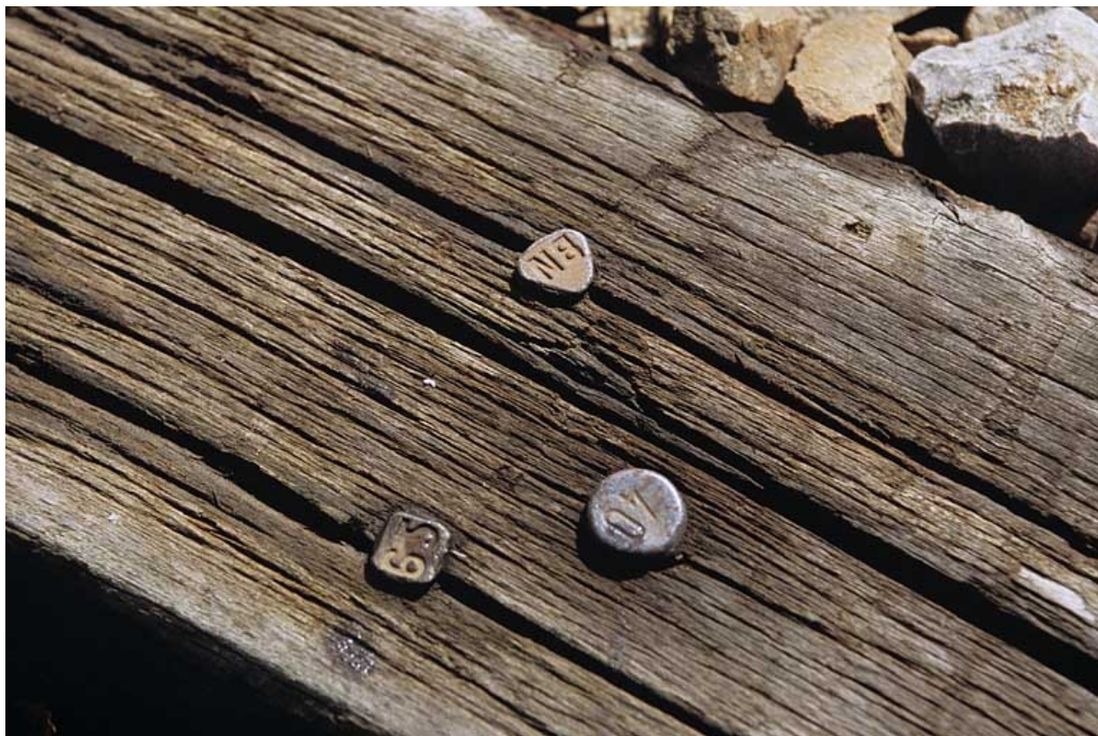
Traverse avec clous. Traverse fabriquée en 1965 (clou à tête carrée avec le millésime 65) par l'atelier Arnaud Beaunartin (Neuf-Brisach, Haut-Rhin) et destinée à être posée avec un écartement de 1,440 m (clou à tête ronde portant le nombre 40). in, Jura