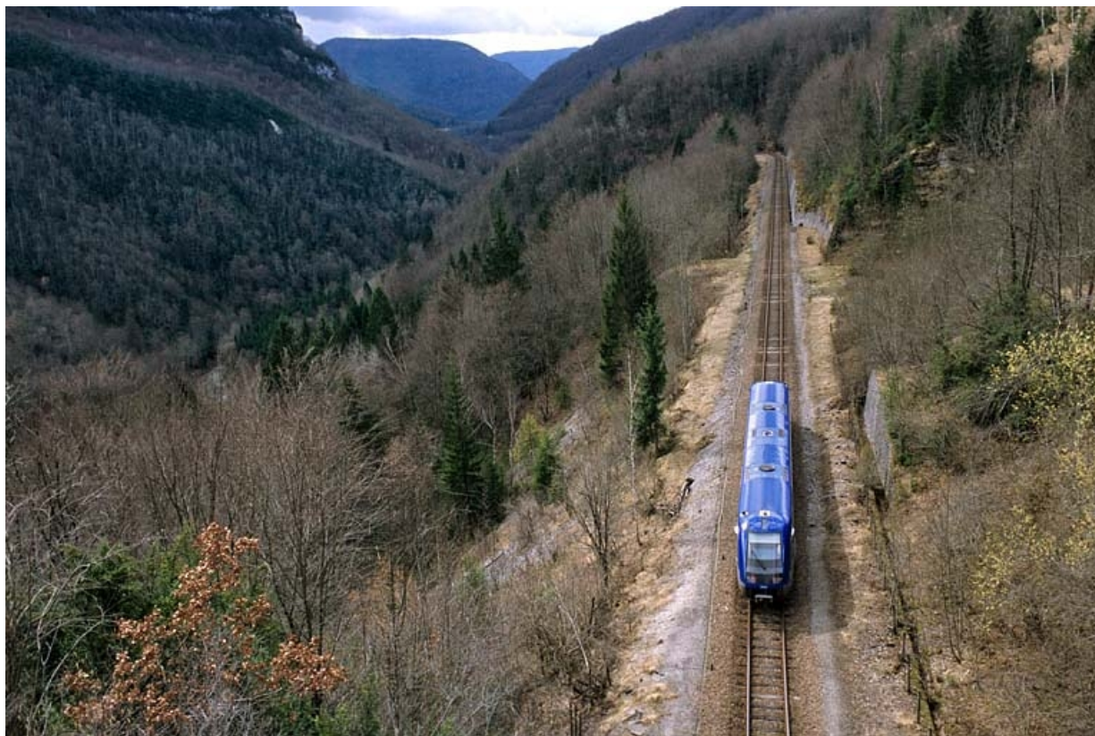
Vue d'ensemble de l'autorail à l'emplacement de l'ancienne station de Valfin-lès-Saint-Claude (commune de Saint-Claude). 39, Saint-Claude place de la Gare