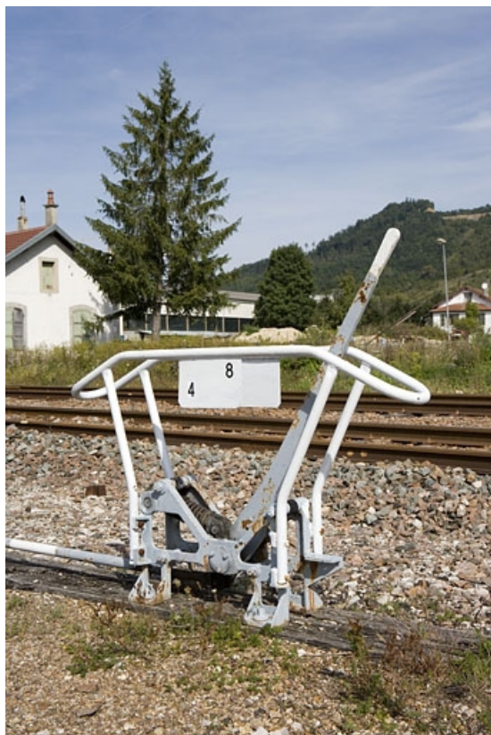
Levier de manoeuvre non enclenché. Levier d'appareil de voie des voies 4 et 8, à l'ouest, à l'extrémité de la gare côté La Cluse. 39, Champagnole, 13 avenue de la Gare