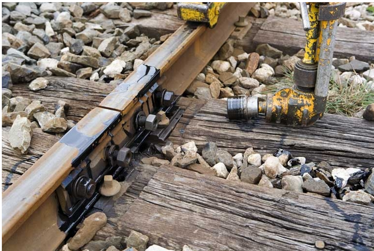
Tête de serrage. La machine est utilisée pour resserrer des boulons d'éclisses. in, Jura