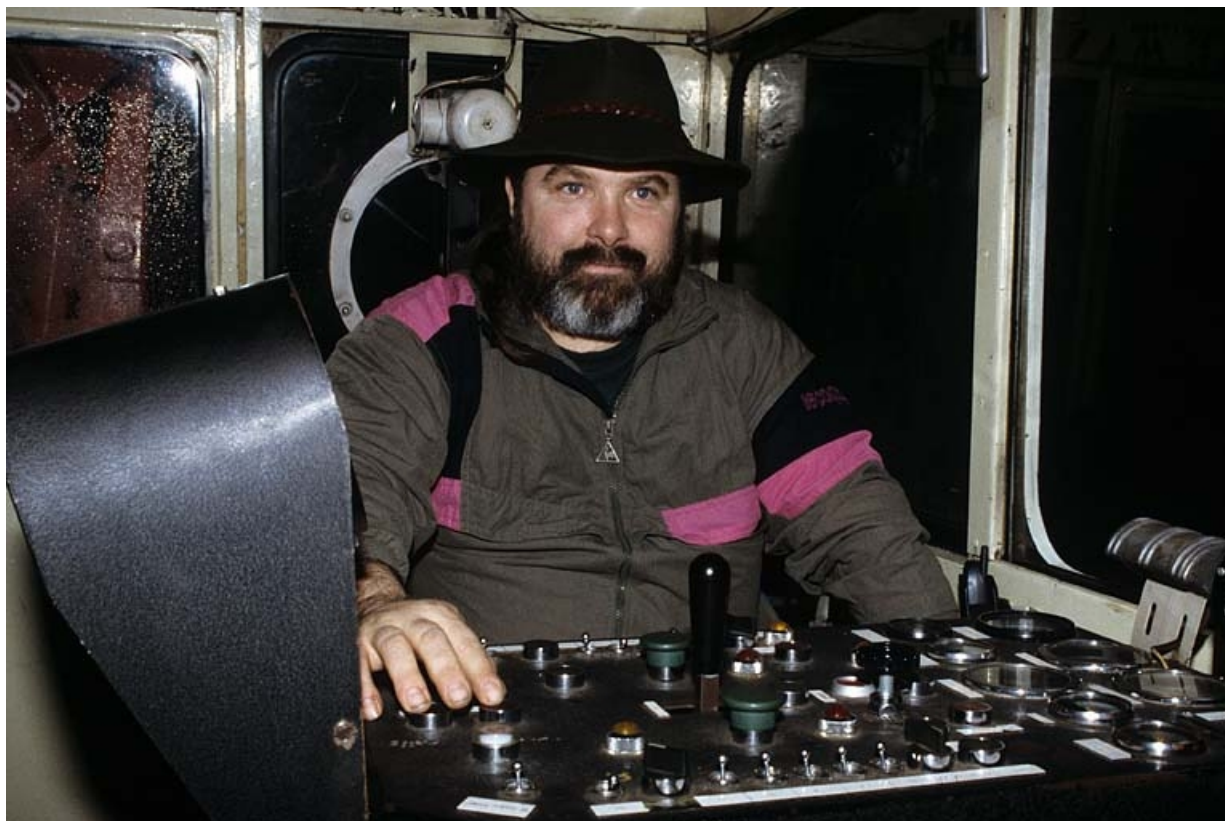
Poste de conduite et mécanicien (conducteur).

39, Morez, 15, 17 avenue Charles de Gaulle