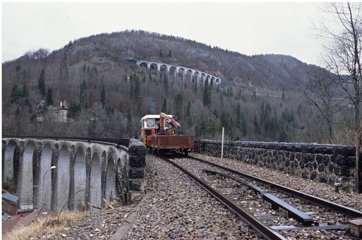
Draisine sur le viaduc de Morez.

39, Morez, 15, 17 avenue Charles de Gaulle