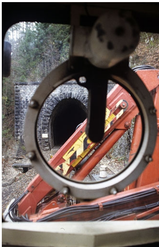
Hublot. Approche de la tête du tunnel de la Joux côté Andelot-en-Montagne (vers le PK 039.020). 39, Morez, 15, 17 avenue Charles de Gaulle