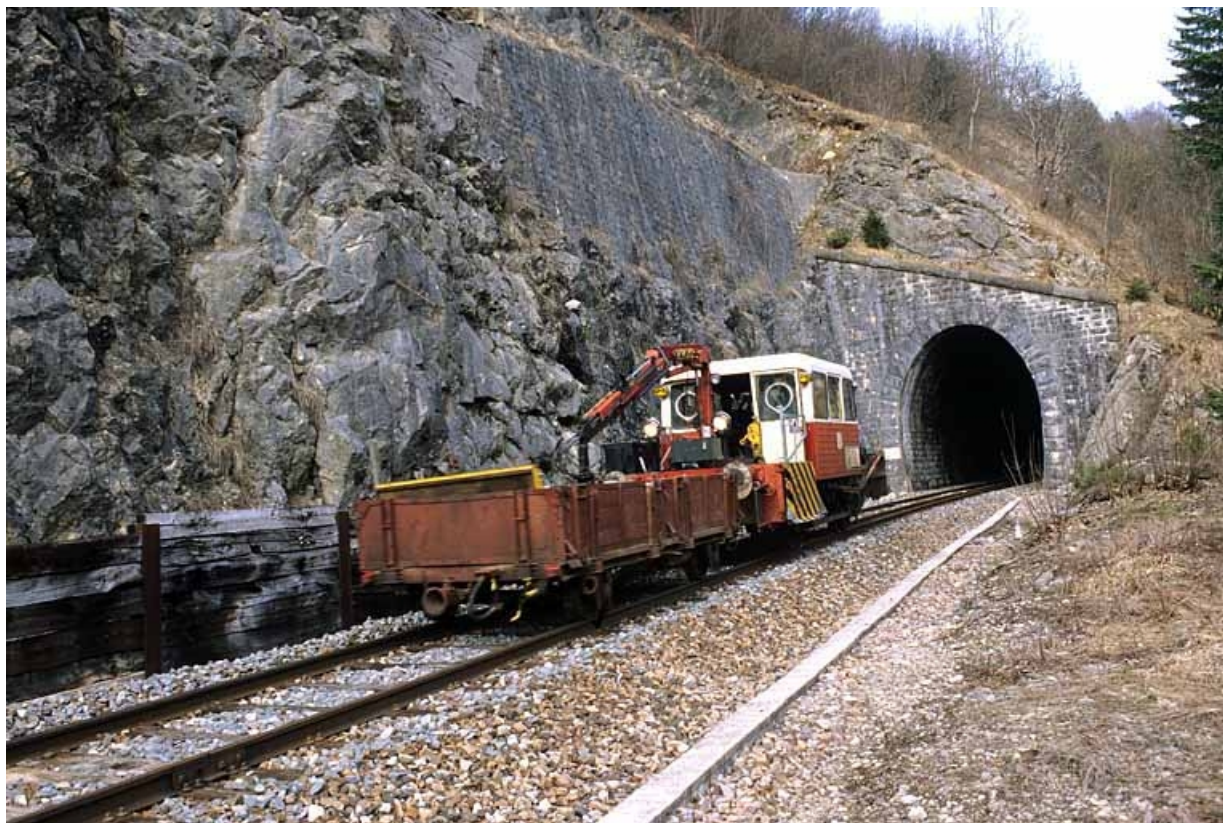
Draisine sortant du tunnel du Pâturage (tête côté La Cluse).

39, Morez, 15, 17 avenue Charles de Gaulle