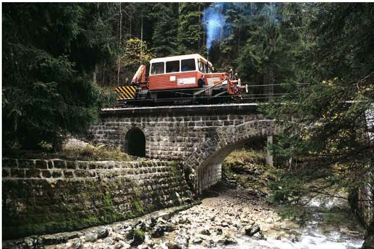
Vue d'ensemble, de côté. Passage sur les deux ponts proches de la tête du tunnel des Frasses côté Andelot-en-Montagne (PK 046.319 et 046.327).

39, Morez, 15, 17 avenue Charles de Gaulle