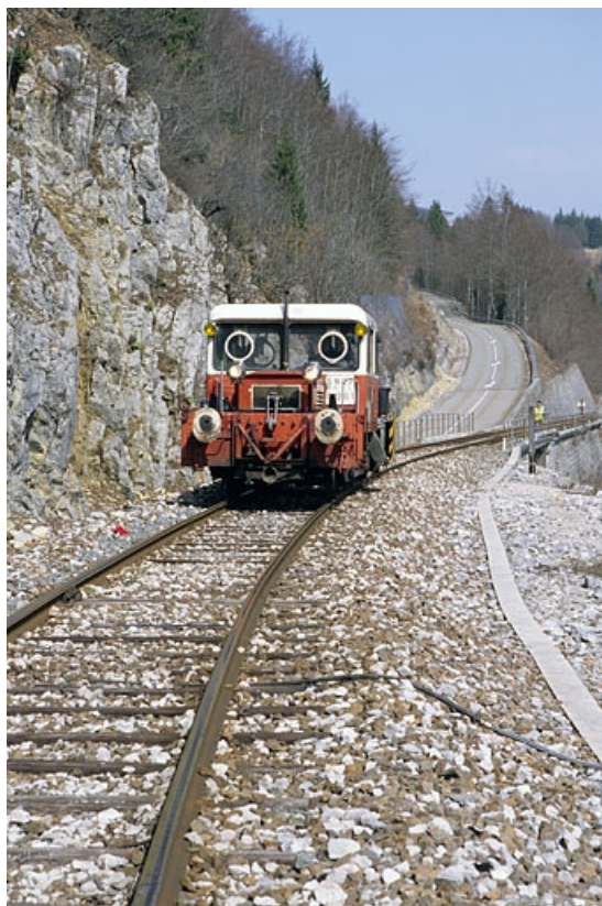
Vue d'ensemble de face. Chantier d'entretien de la voie à l'extrémité du viaduc des Crottes côté La Cluse (vers le PK 045.200). 39, Morez, 15, 17 avenue Charles de Gaulle