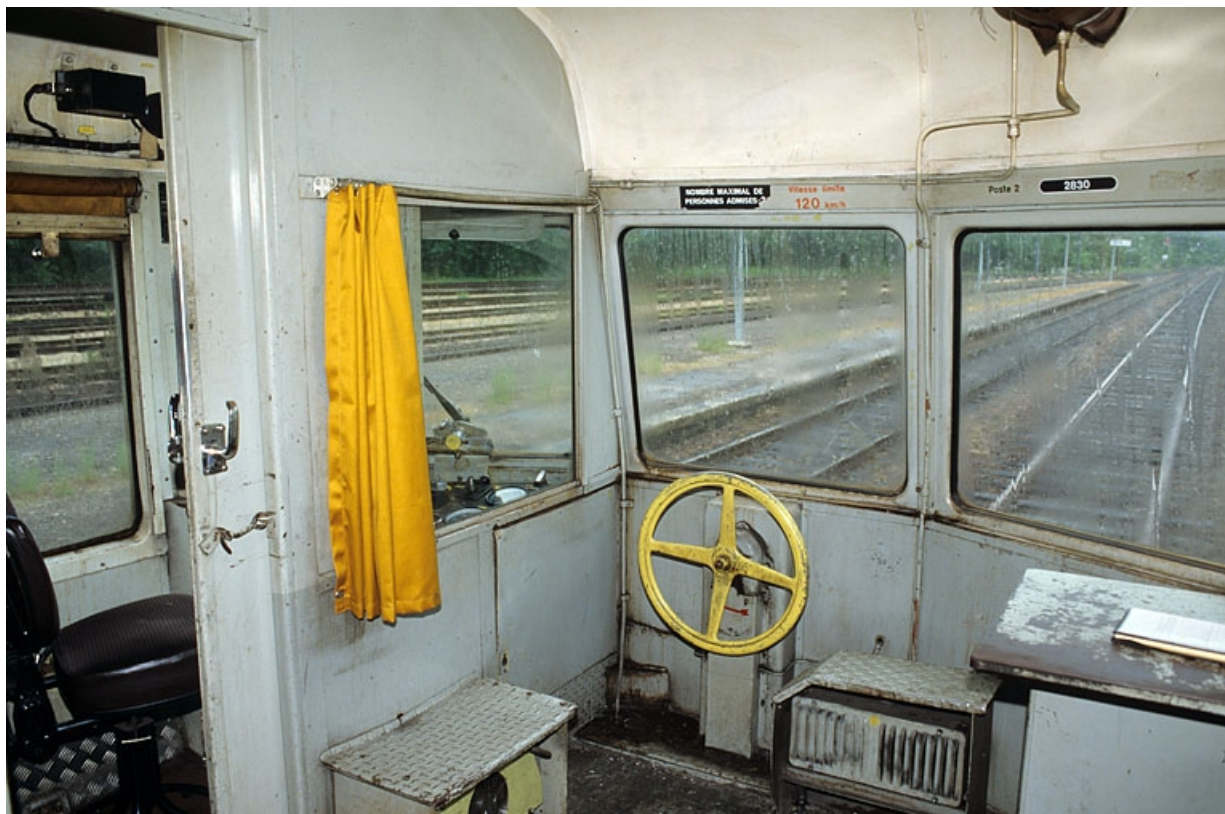
Intérieur, côté extrémité 2 : cabine de conduite et fourgon à bagages.

39, Andelot-en-Montagne, 44, 46 rue de la Gare