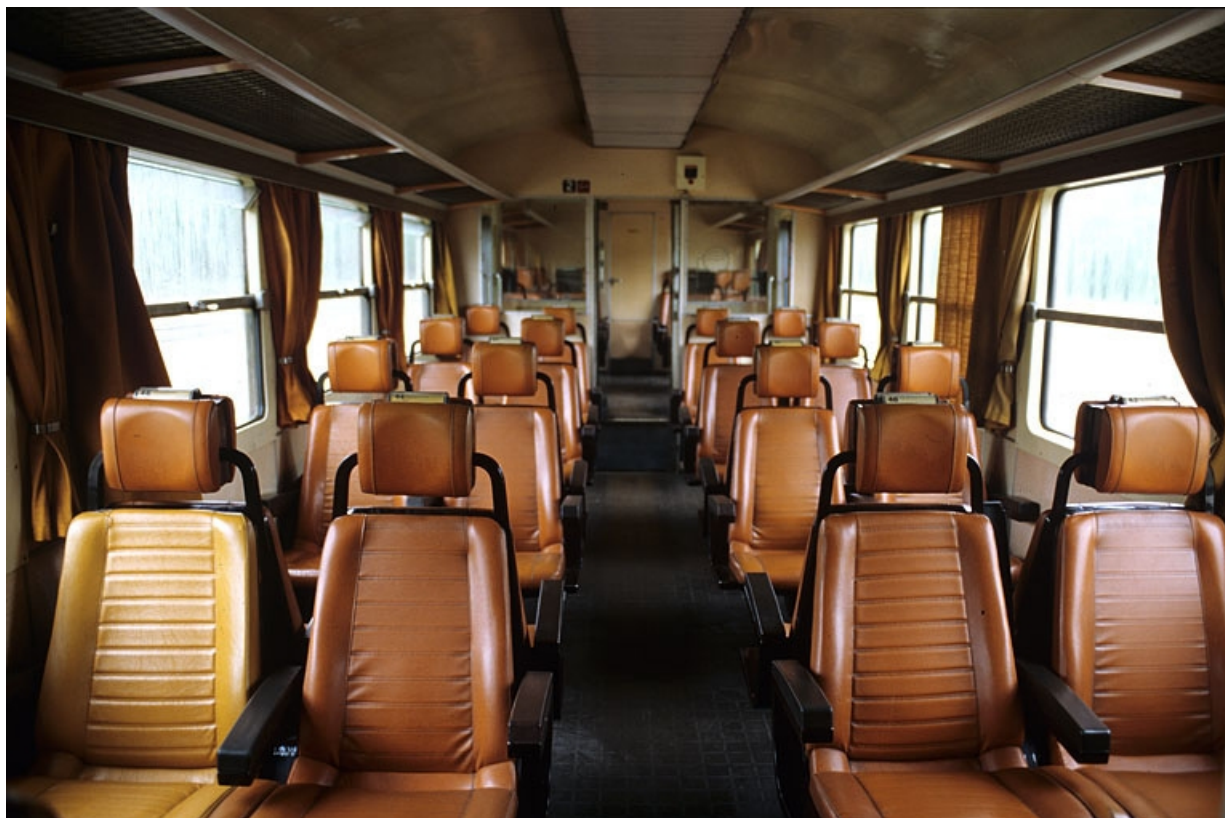
Au fond, l'ancien compartiment 1ère classe. 39, Andelot-en-Montagne, 44, 46 rue de la Gare