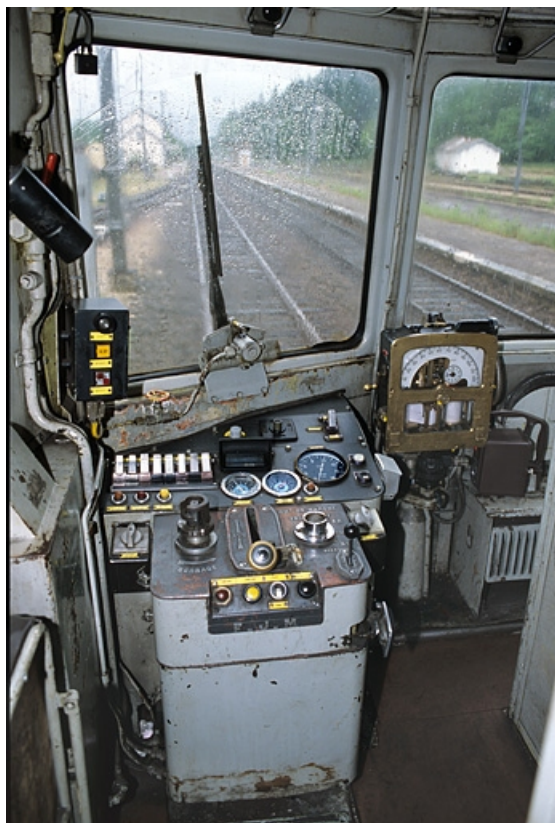
Intérieur, côté extrémité 1 : poste de conduite. in, Jura