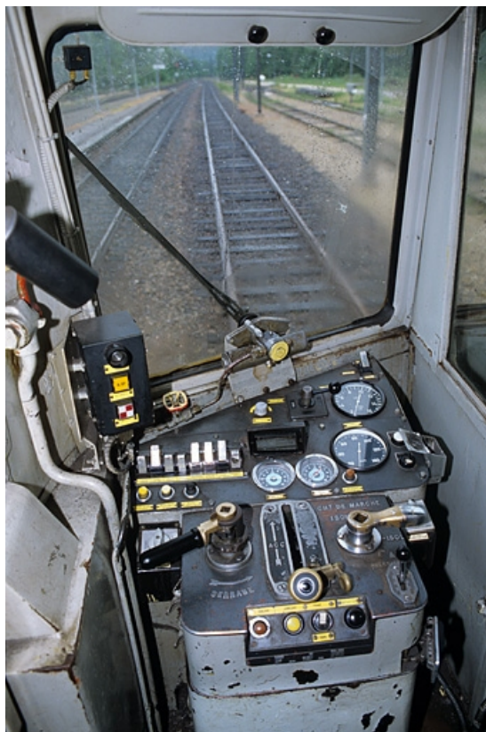
Intérieur, côté extrémité 2 : poste de conduite.

39, Andelot-en-Montagne, 44, 46 rue de la Gare