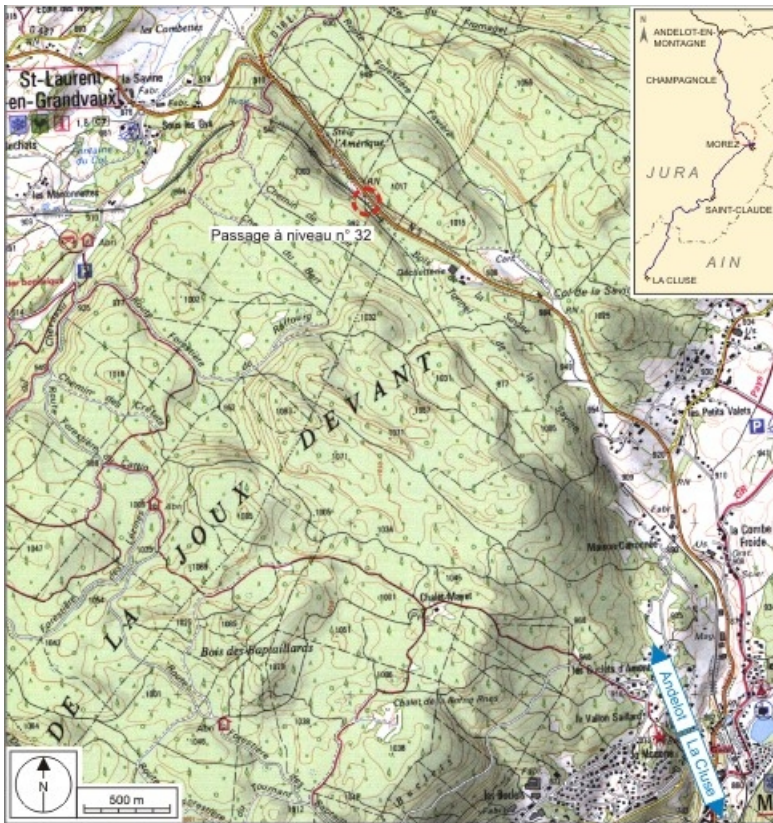
Carte et schéma de localisation. Carte topographique, IGN, 2000, dalles F087_049, F087_050, F088_049 et F088_050, échelle 1:25 000. Scan 25, licence n° 2008/CISE/2968.

39, Saint-Laurent-en-Grandvaux, lieudit : le Bois de la Savine