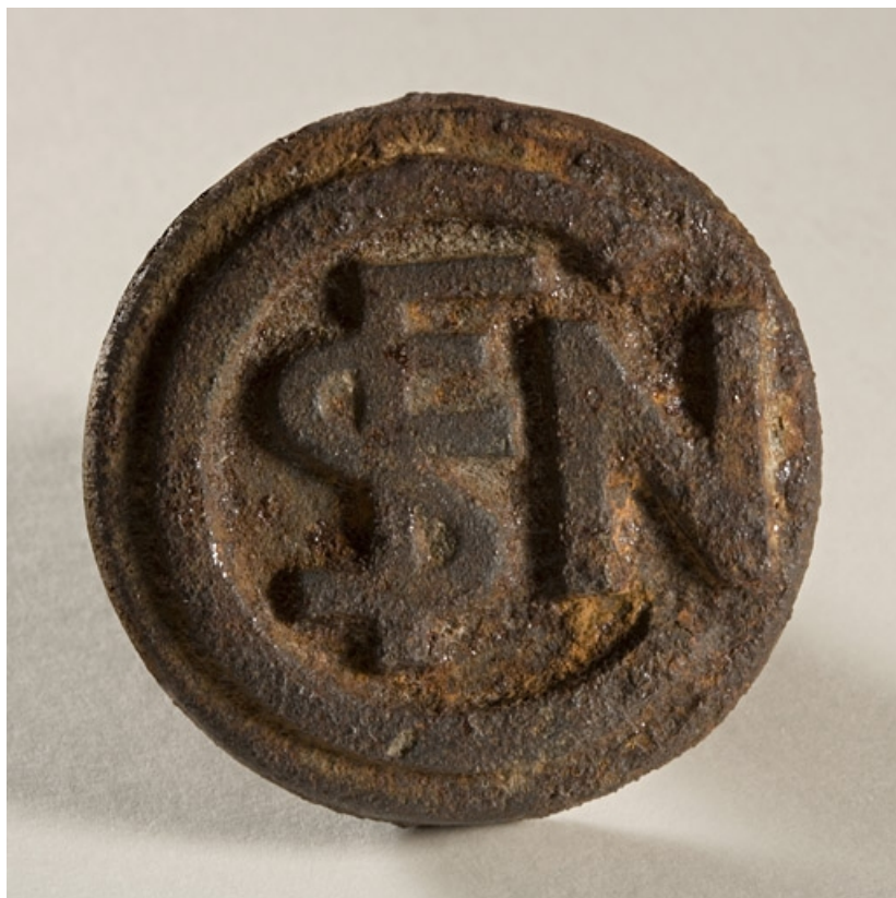
Poignée : logotype SNCF.

39, La Rixouse, lieudit : Bois Joura et Cotats