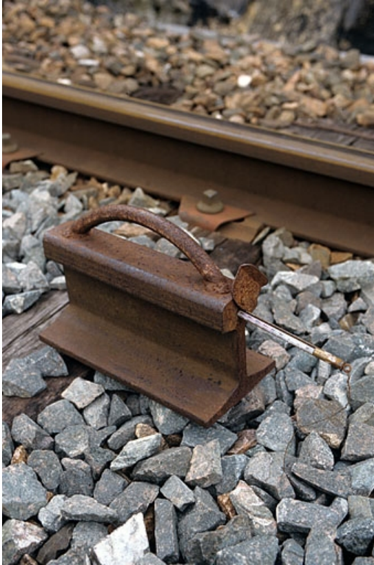
Vue d'ensemble plongeante.

39, La Rixouse, lieudit : Bois Joura et Cotats