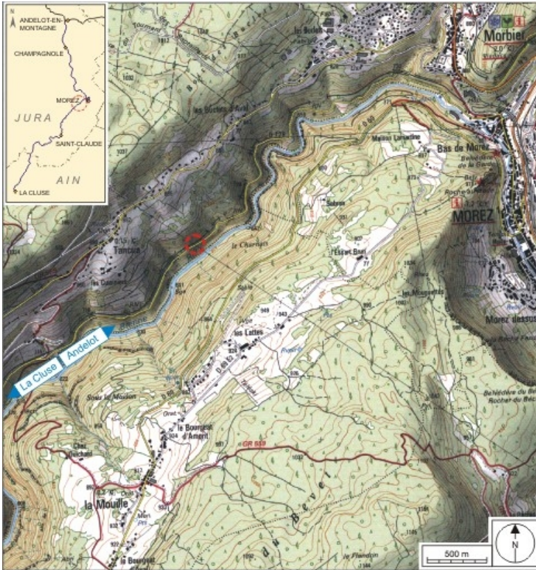
Carte et schéma de localisation. Carte topographique, IGN, 2000, dalles F087_050 et F088_050, échelle 1:25 000. Scan 25, licence n° 2008/CISE/2968.