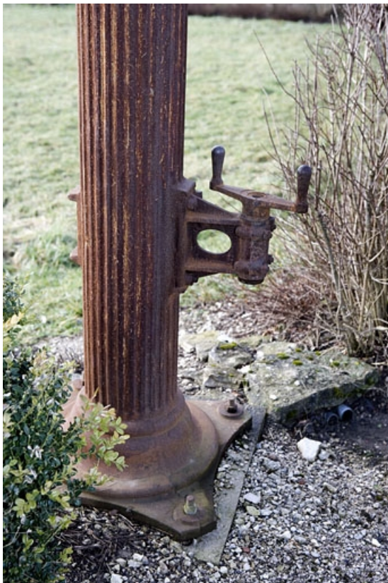
Manivelle à la base du fût.