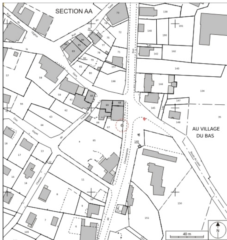
Plan de situation. Extrait du plan cadastral informatisé, 2007, section AA, échelle 1:1500. 39, Vers-en-Montagne, 44 route de Champagnole