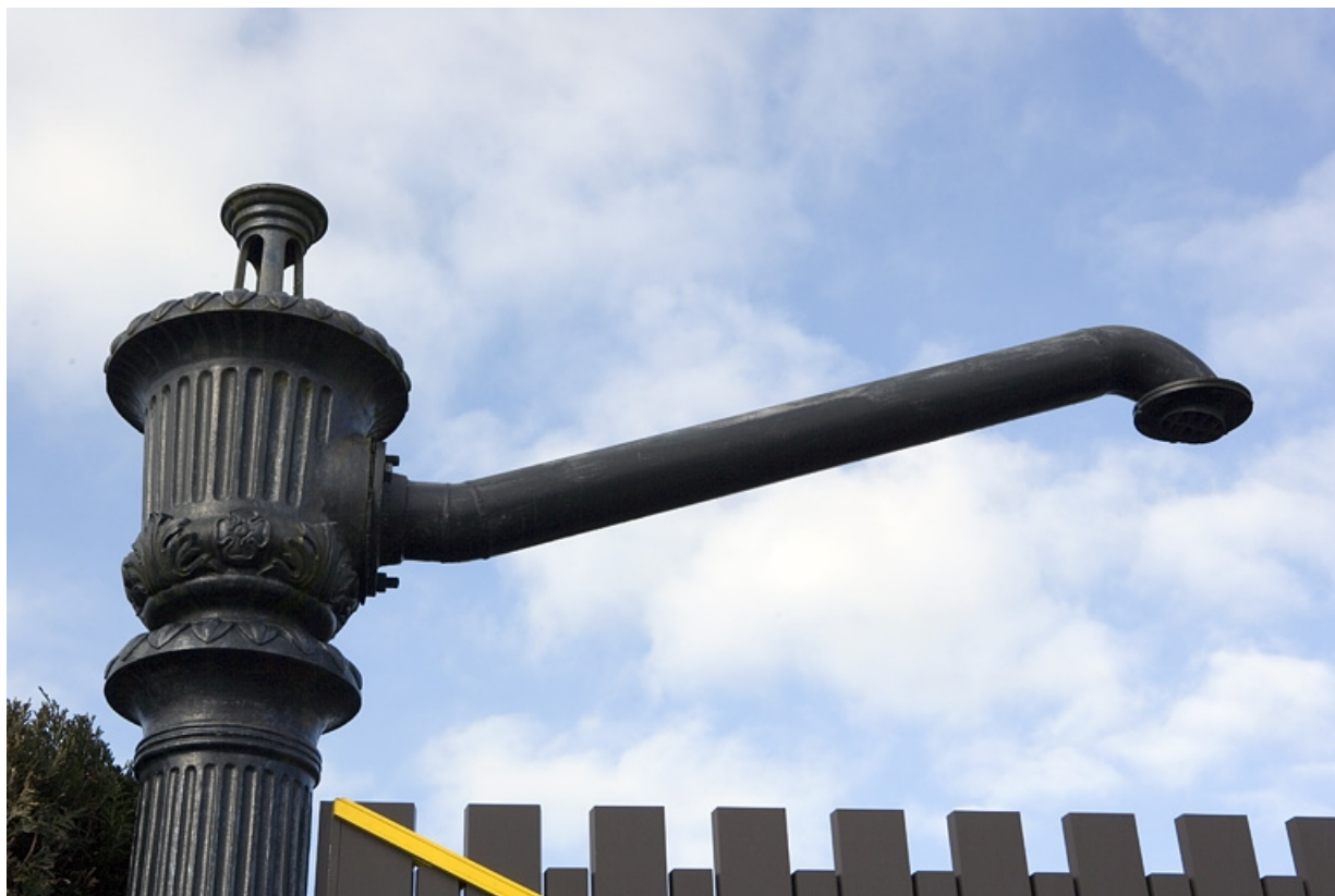
Partie supérieure de la pompe gauche : vase et bras.

39, Vers-en-Montagne, 44 route de Champagnole