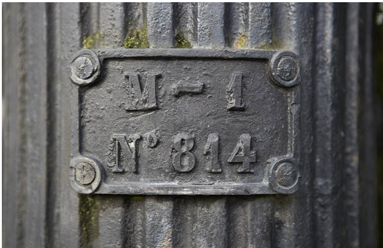
Plaque vissée sur le fût de la pompe droite.

39, Vers-en-Montagne, 44 route de Champagnole