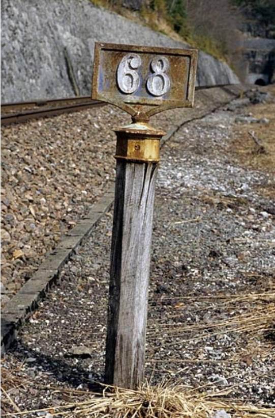
Vue d'ensemble, plaque ancienne type PLM apparente.

39, Saint-Claude, lieudit : sous les Lésines