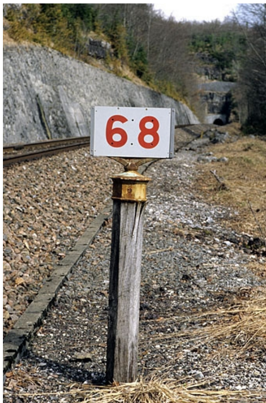
Vue d'ensemble, plaque récente type SNCF apparente.

39, Saint-Claude, lieudit : sous les Lésines