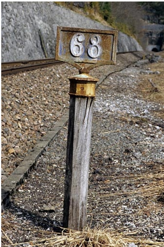
Vue d'ensemble, plaque ancienne type PLM apparente.

39, Saint-Claude, lieudit : sous les Lésines