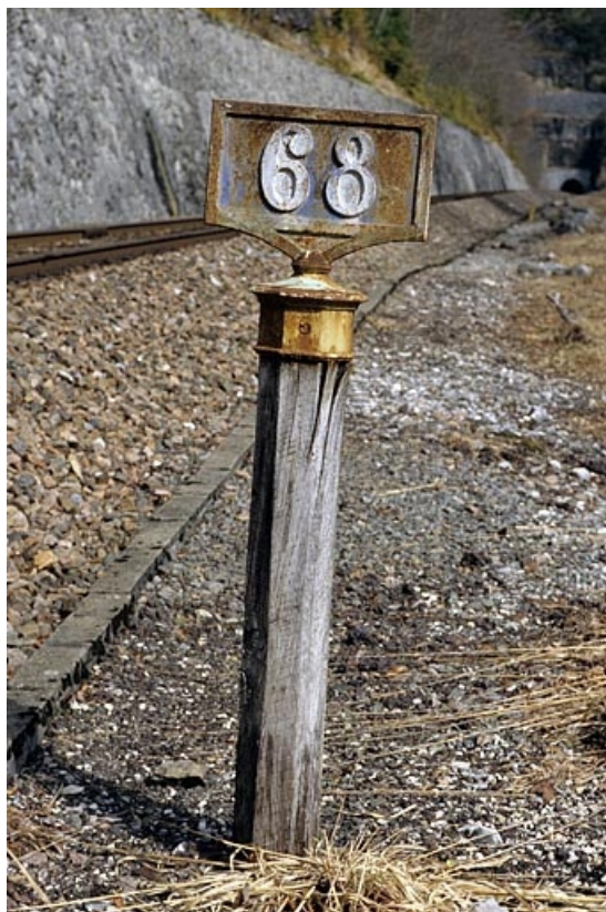
Vue d'ensemble, plaque ancienne type PLM apparente.

39, Saint-Claude, lieudit : sous les Lésines