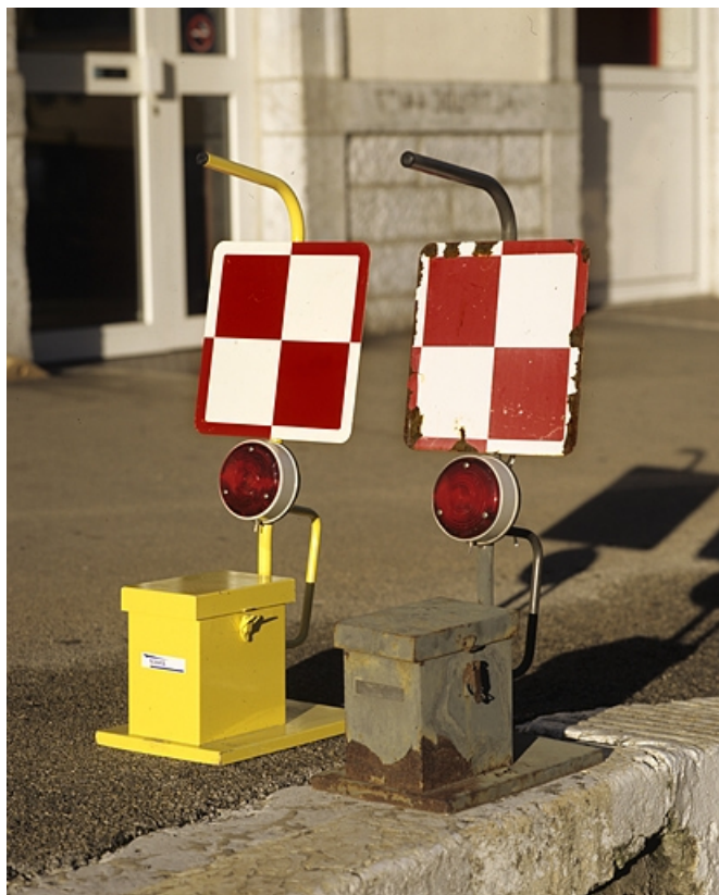
Vue d'ensemble des deux lampes.