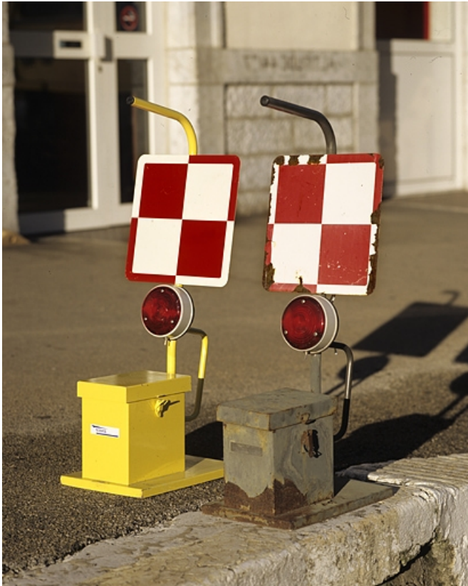
Vue d'ensemble des deux lampes.