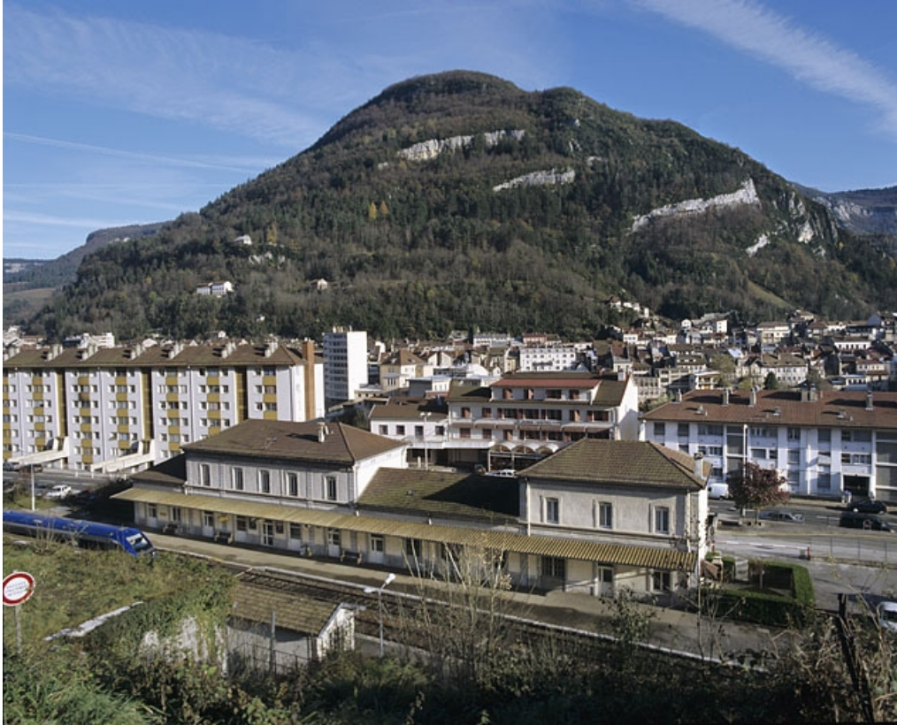
Vue plongeante sur la façade postérieure du bâtiment des voyageurs.