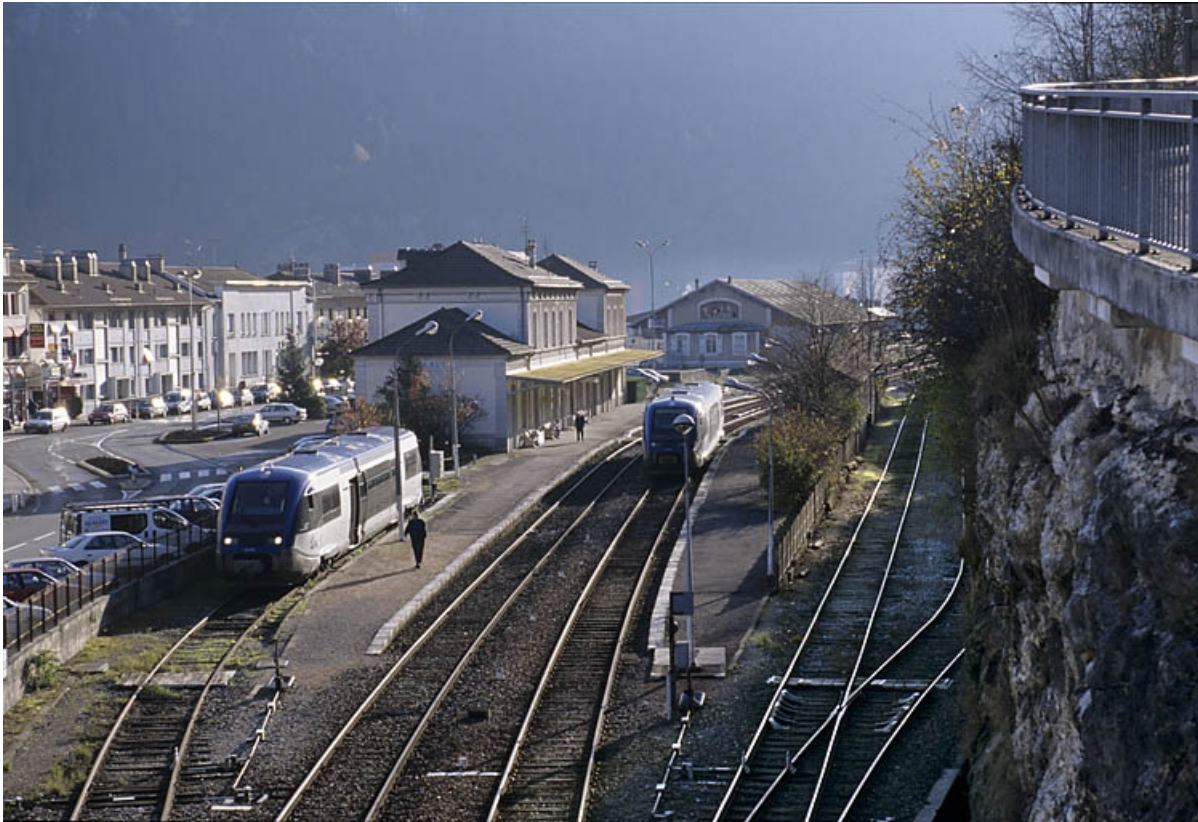
Vue d'ensemble du site depuis le pont routier, au nord.