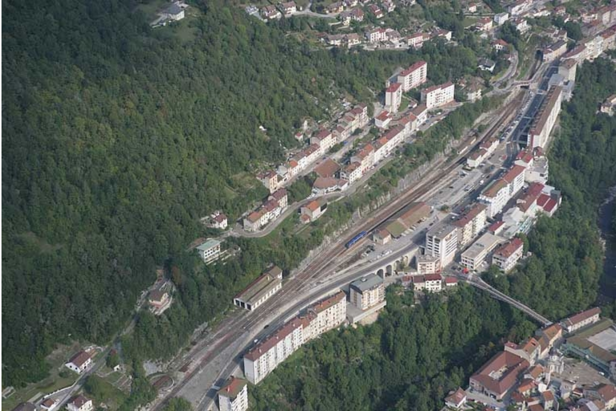
Vue aérienne de la gare, depuis le sud.