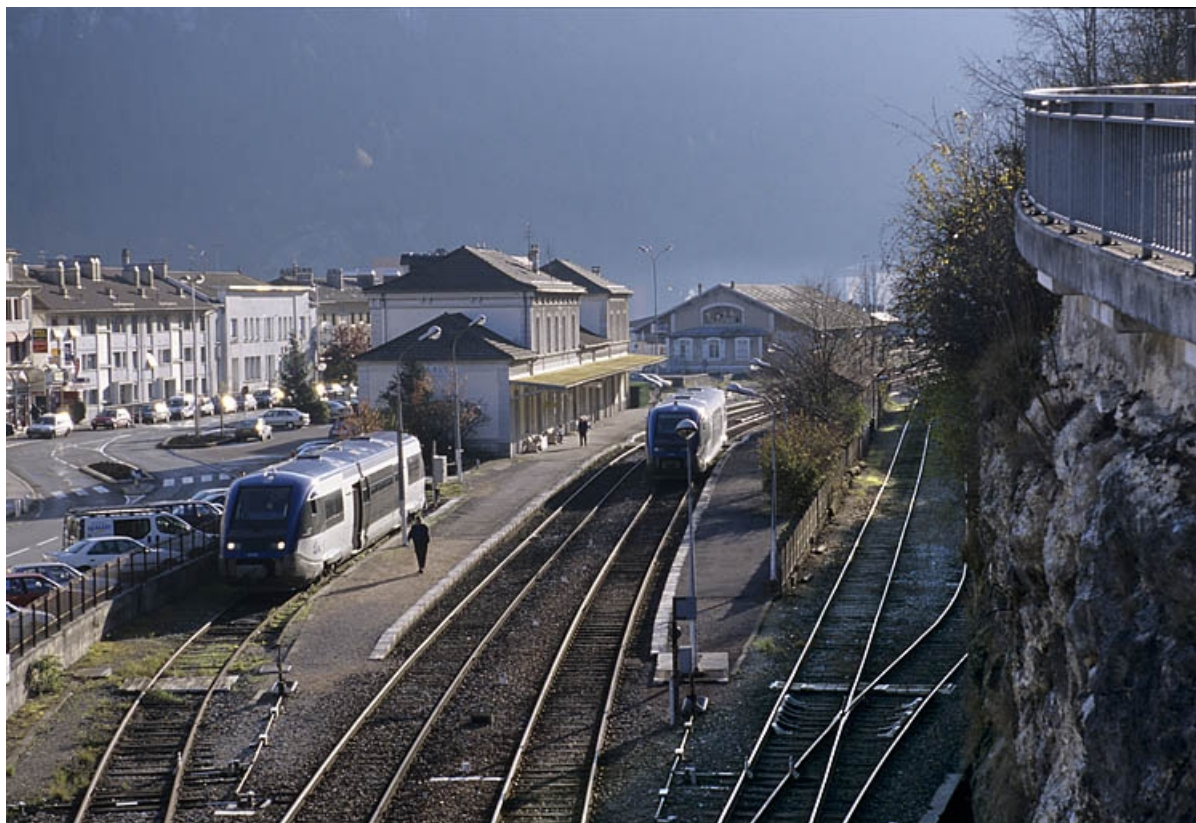
Vue d'ensemble du site depuis le pont routier, au nord.