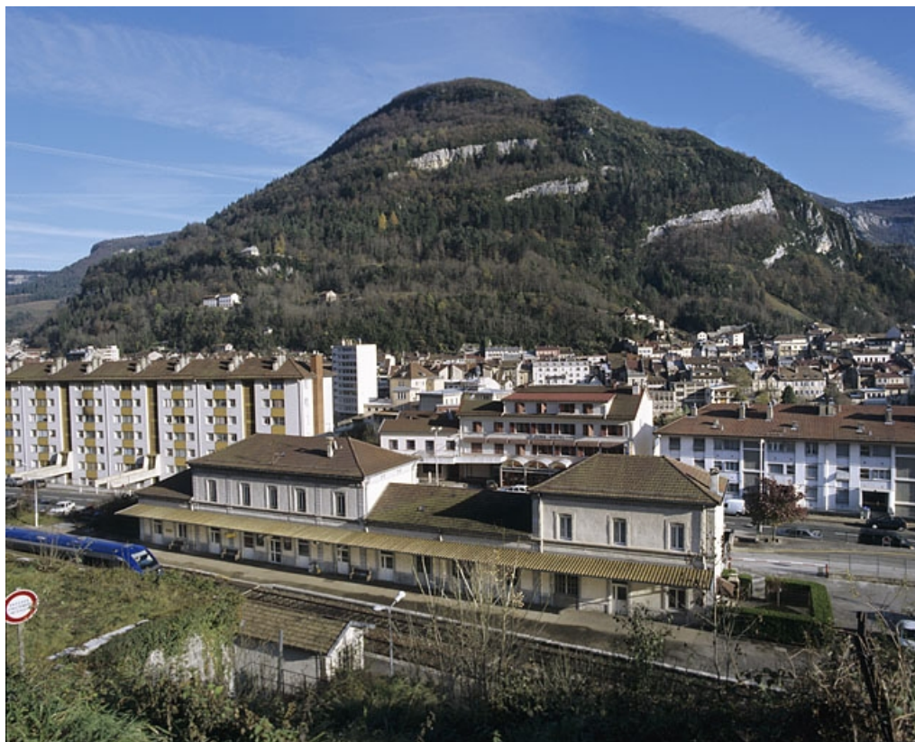
Vue plongeante sur la façade postérieure du bâtiment des voyageurs.