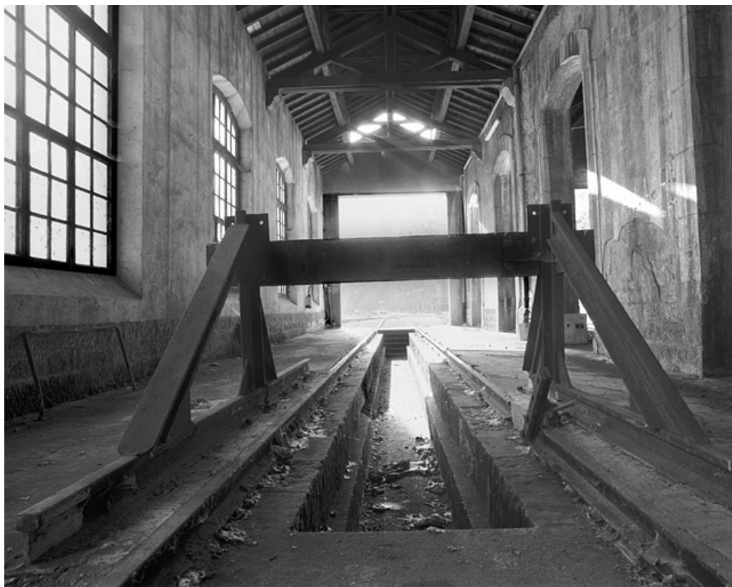
Remise ferroviaire : heurtoir et fosse à l'intérieur de la halle est.