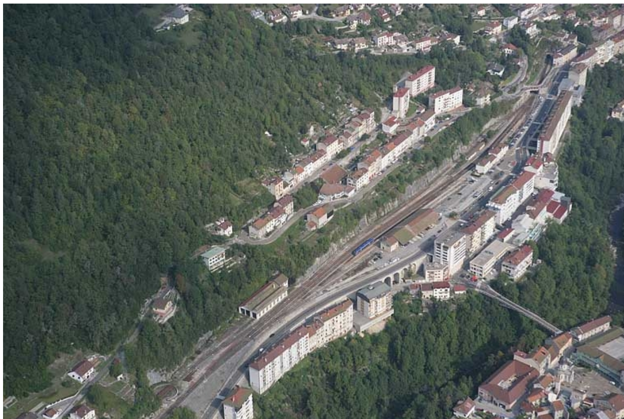
Vue aérienne de la gare, depuis le sud.