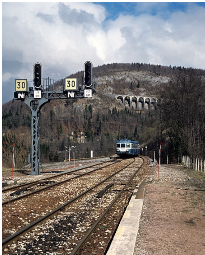
Entrée de la gare côté Andelot-en-Montagne, avec autorail X 2800.

39, Morez, 15, 17 avenue Charles de Gaulle