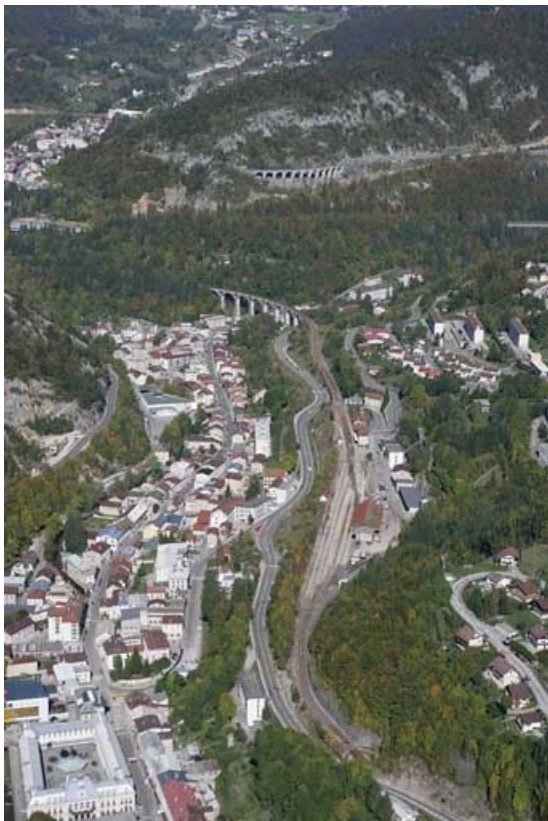
Vue aérienne de la gare, depuis le sud.

39, Morez, 15, 17 avenue Charles de Gaulle