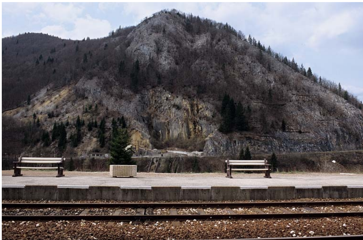
Quai et bancs face au bâtiment des voyageurs (direction La Cluse).

39, Morez, 15, 17 avenue Charles de Gaulle