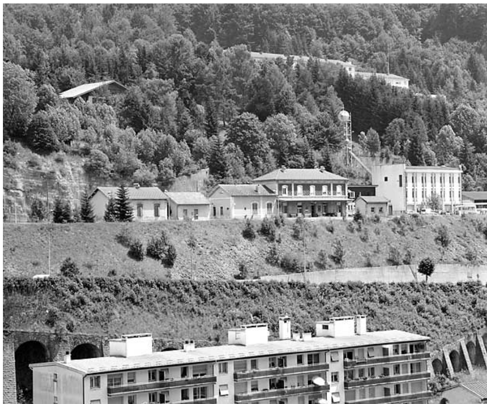
Vue d'ensemble de la gare, depuis le nord-ouest.

39, Morez, 15, 17 avenue Charles de Gaulle