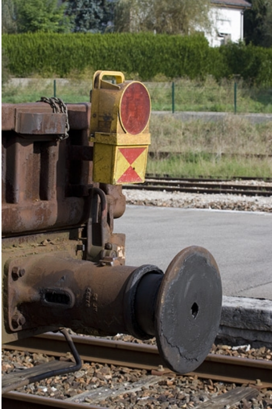
Vue d'ensemble sur son support.