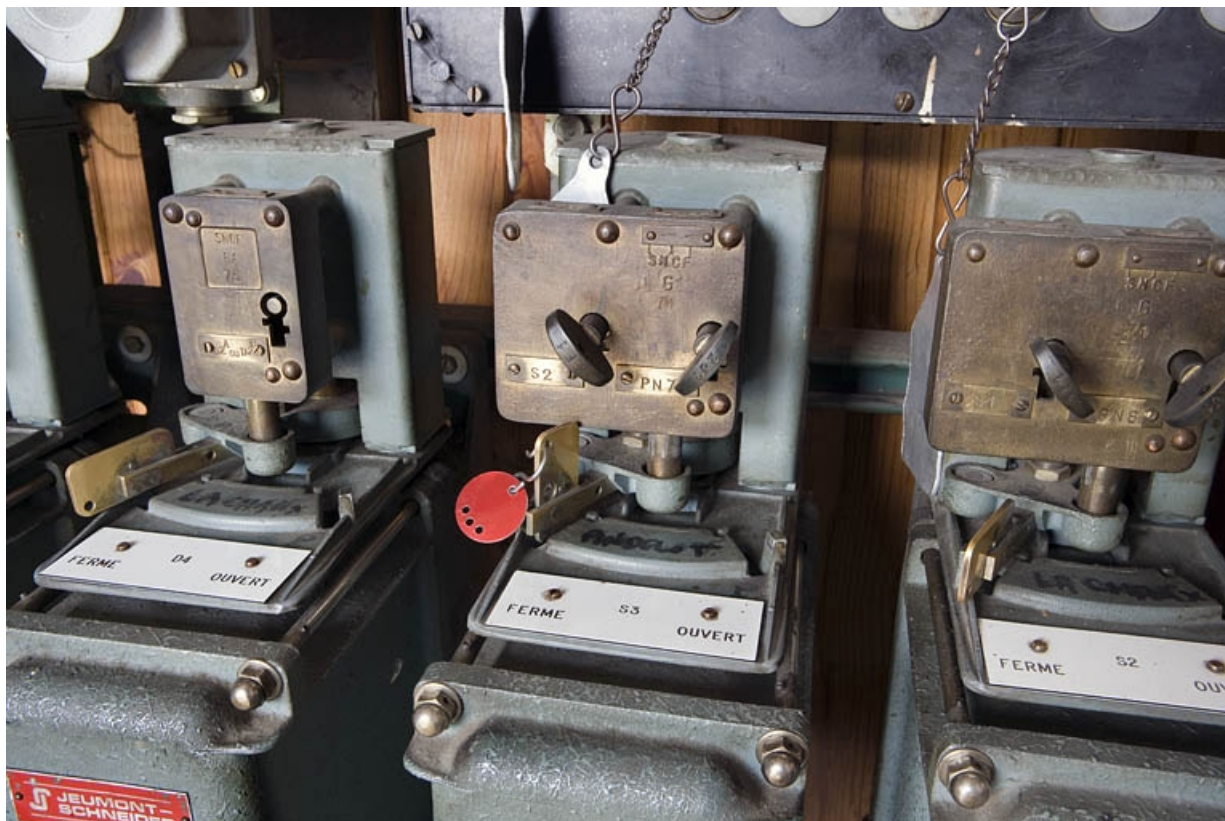
Petit dispositif en place sur la manette d'un commutateur.