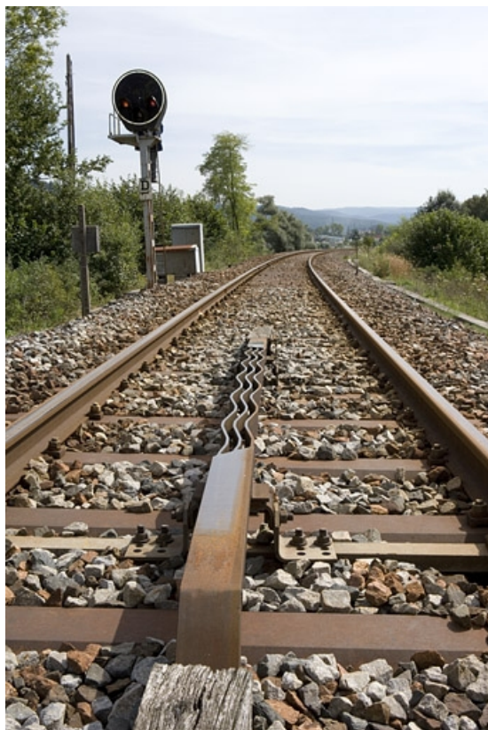
Vue d'ensemble, avec " crocodile ". Le crocodile, au premier plan, permet une répétition des signaux en cabine. 39, Champagnole, lieudit : aux Essards de Salins