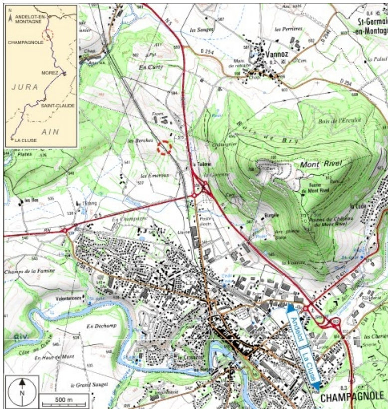
Carte et schéma de localisation. Carte topographique, IGN, 3326 Ouest Champagnole, 2001, échelle 1:25 000. Scan 25, licence n° 2008/CISE/2968.

39, Champagnole, lieudit : aux Essards de Salins