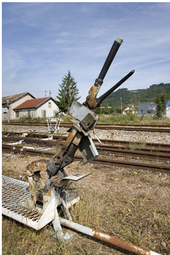
Levier de manoeuvre enclenché. Levier de taquets d'arrêt, pour certaines voies à l'ouest, à l'extrémité de la gare côté La Cluse. 39, Champagnole, 13 avenue de la Gare