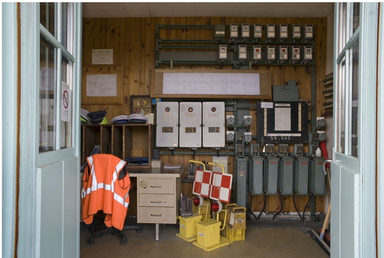
Vue d'ensemble du bureau de l'agent de circulation.