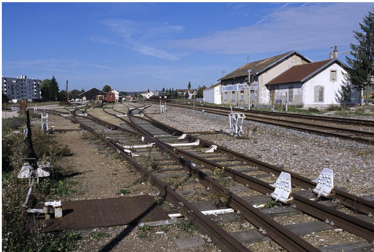
Aiguillages et faisceaux de voies côté La Cluse, depuis le sud-est.