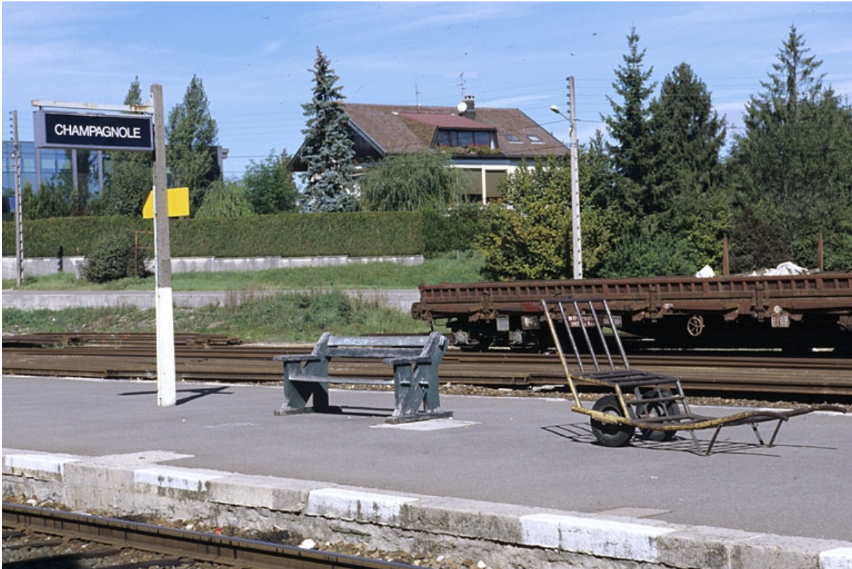
Quai des voyageurs, avec panneau, banc et brouette à bagages.