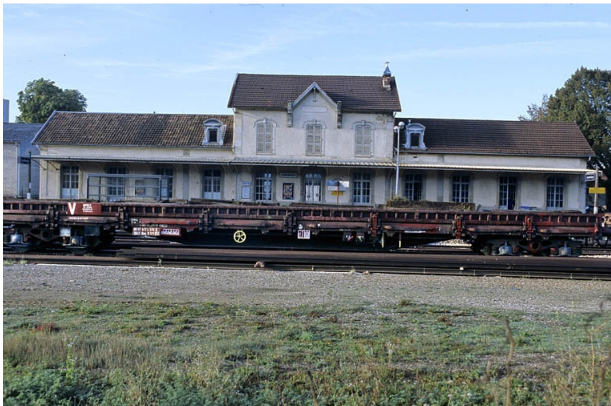
Bâtiment des voyageurs : façade postérieure.