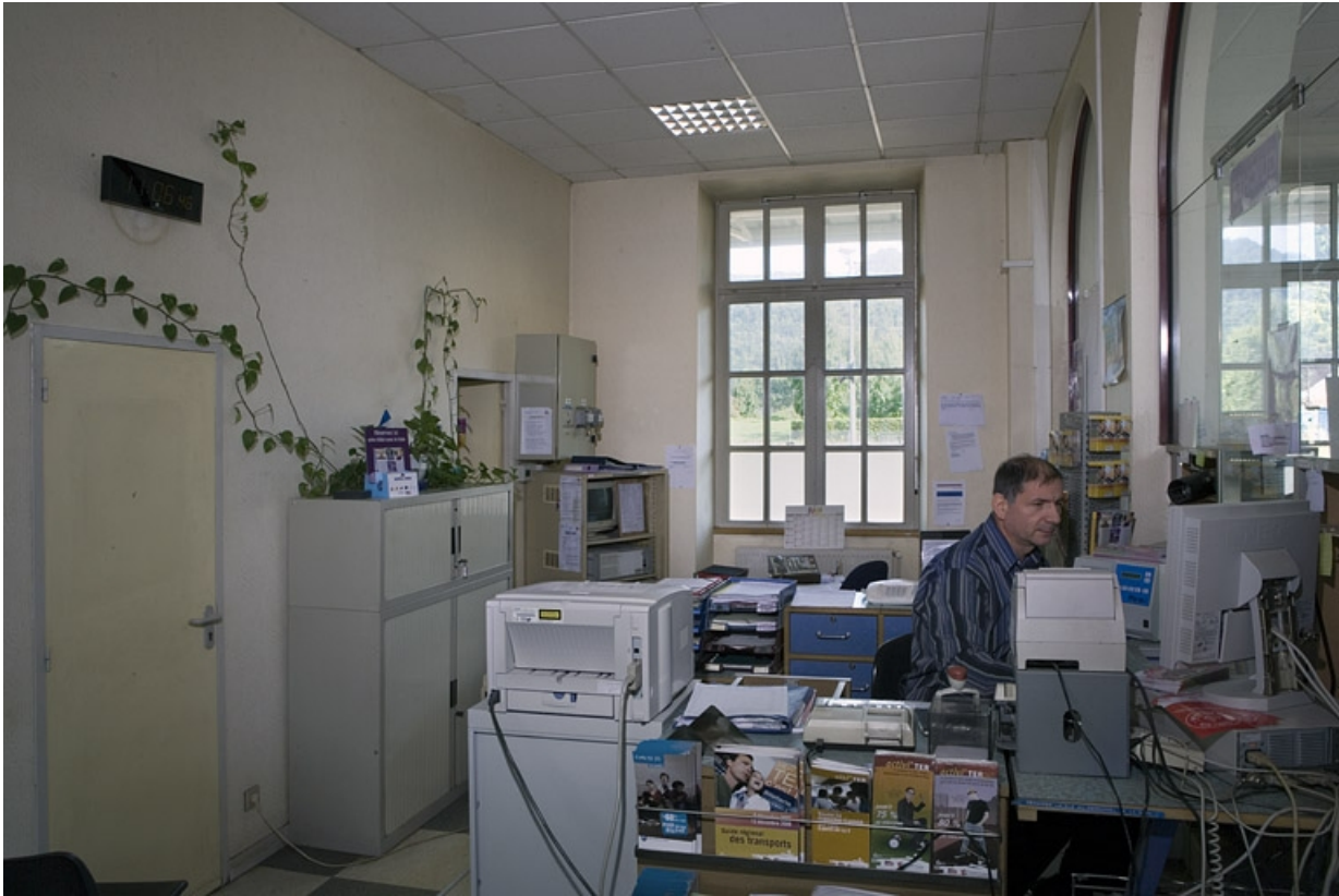
Au fond, l'ordinateur du système CAPI.