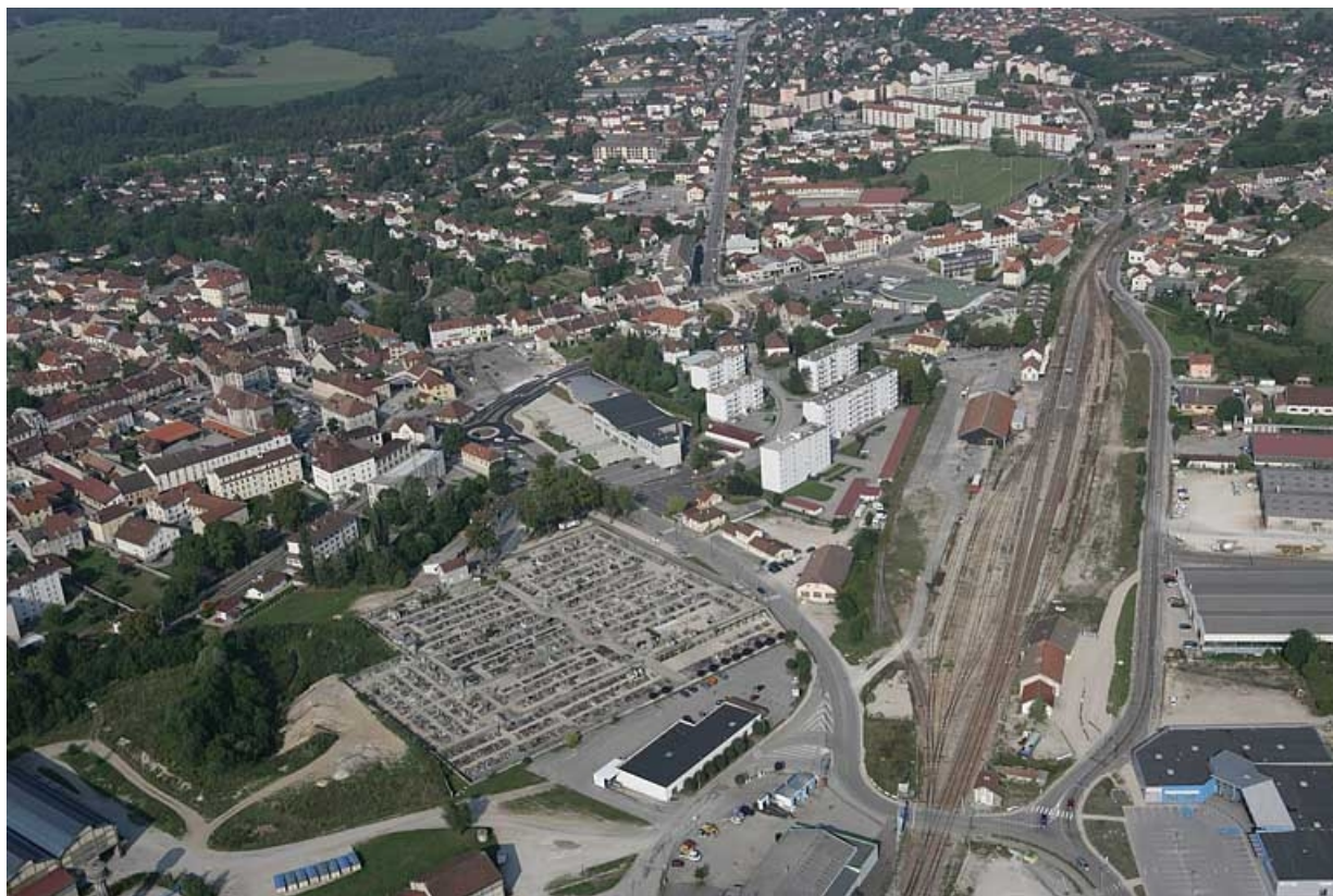
Vue aérienne de la gare, depuis le sud-est.