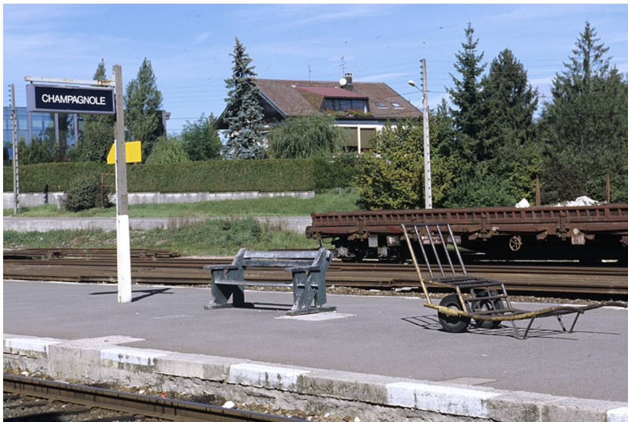
Quai des voyageurs, avec panneau, banc et brouette à bagages.