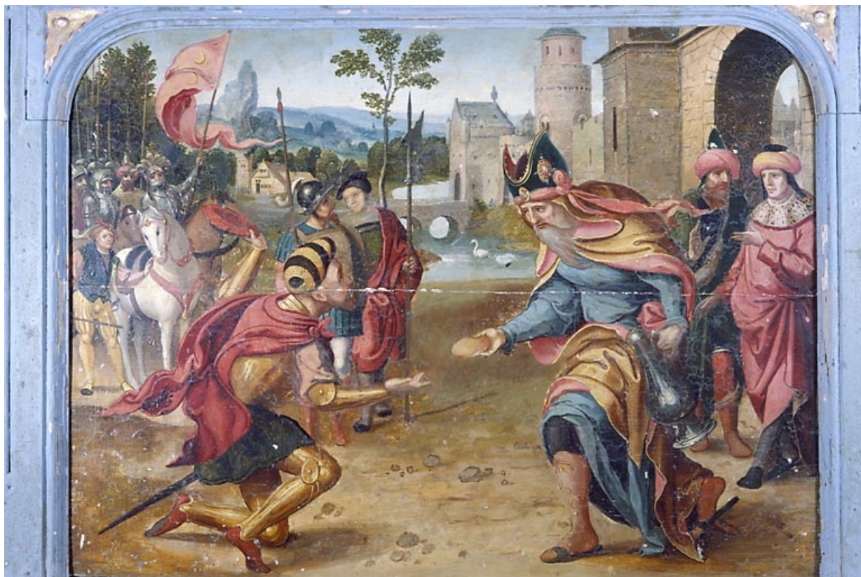
Le sacrifice de Melchisedech.