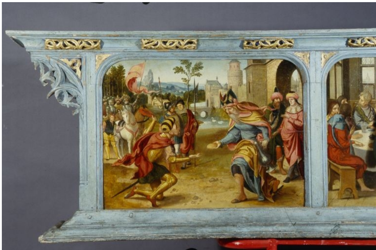
Panneau gauche de la prédelle : la rencontre d'Abraham et de Melchisedech (après restauration). 39, Baume-les-Messieurs