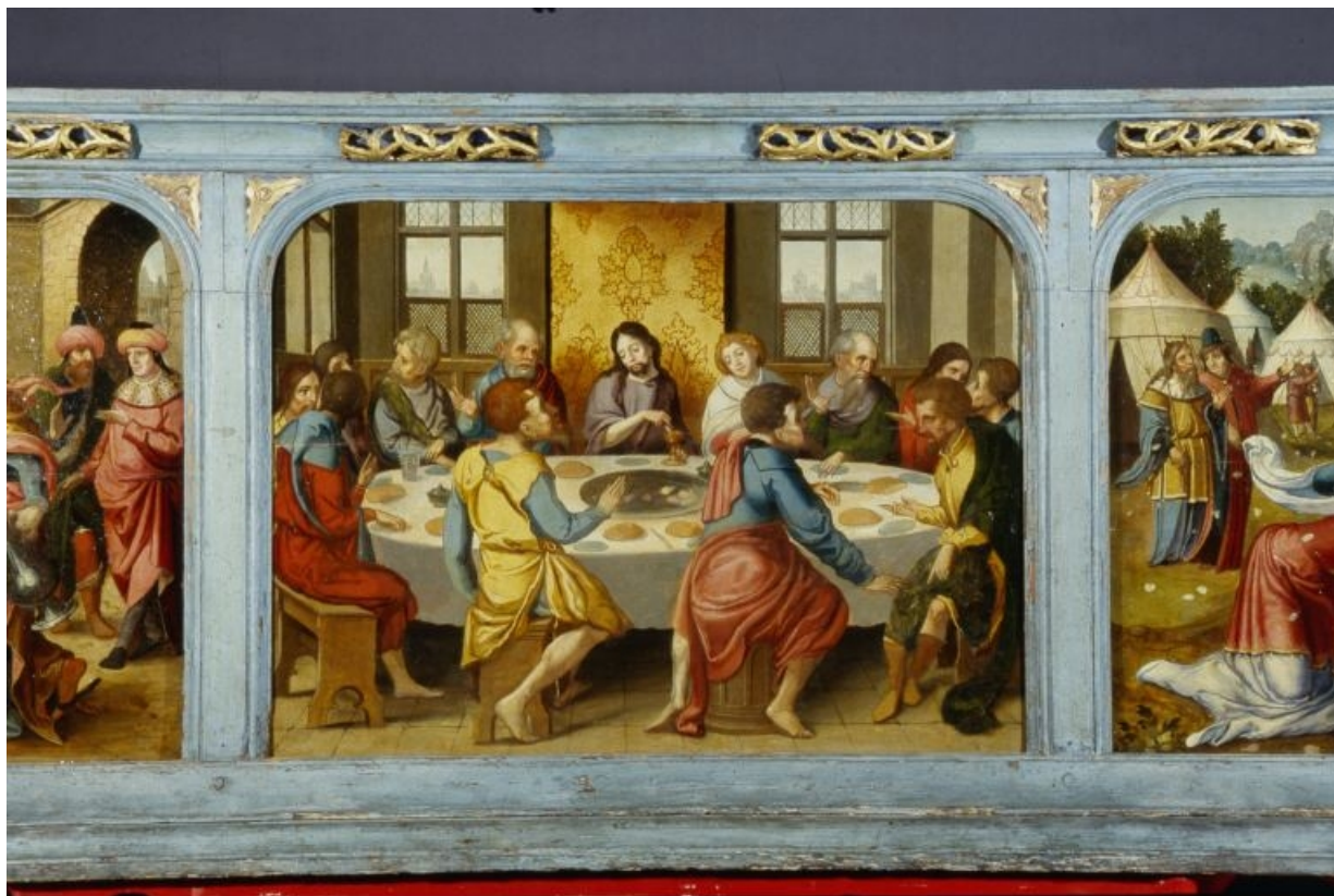
Panneau central de la prédelle : la Cène (après restauration).