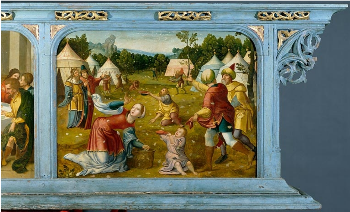
Panneau gauche de la prédelle : les Hébreux recueillant la manne dans le désert (après restauration). 39, Baume-les-Messieurs