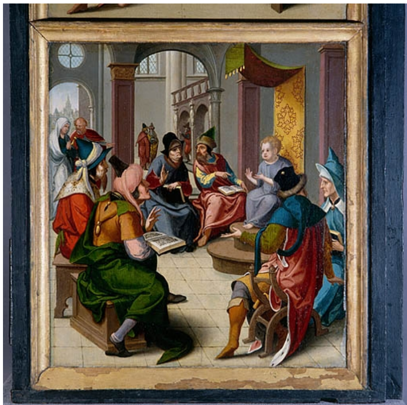
Face interne du volet droit : Jésus au milieu des docteurs (après restauration). 39, Baume-les-Messieurs