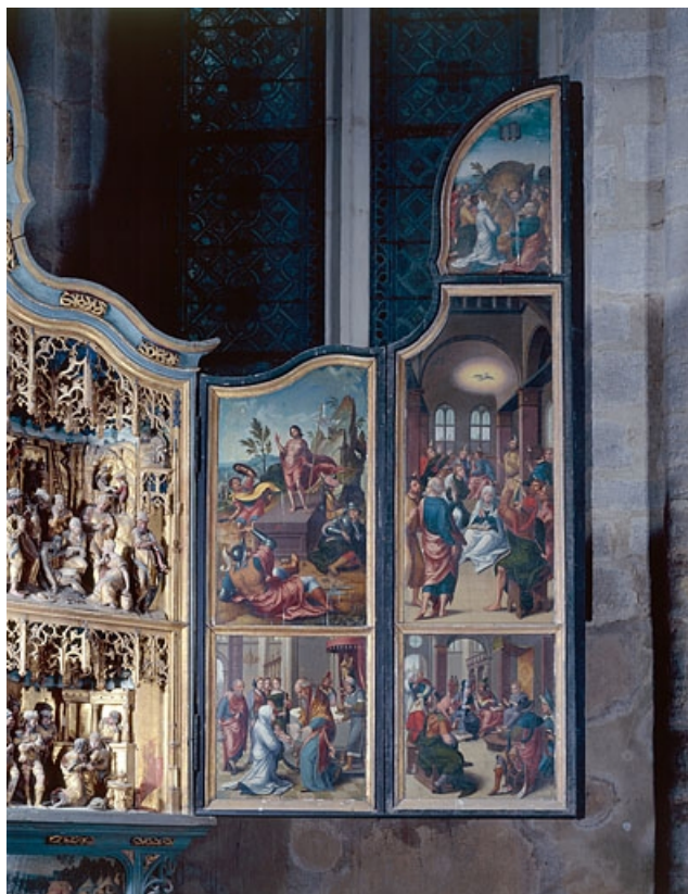
Face interne du volet droit.