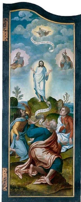
Face externe du volet droit : la Transfiguration (après restauration). 39, Baume-les-Messieurs