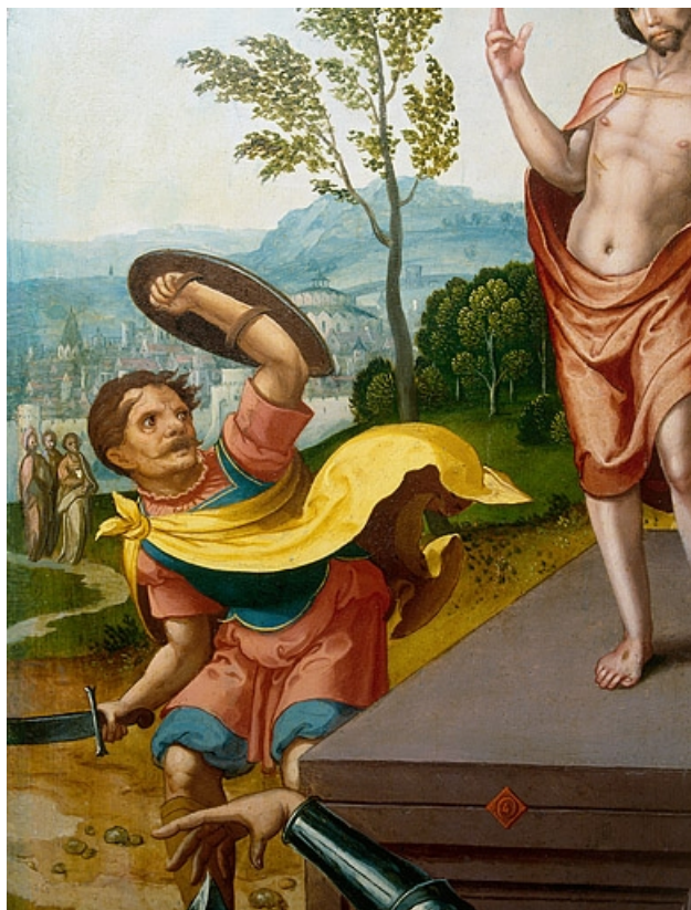
Face interne du volet droit : la Résurrection, détail : un soldat (après restauration). 39, Baume-les-Messieurs