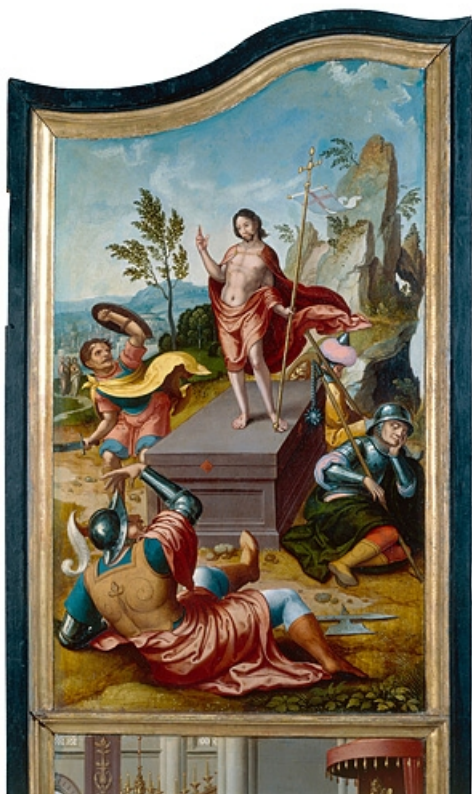
Face interne du volet droit : la Résurrection (après restauration). 39, Baume-les-Messieurs