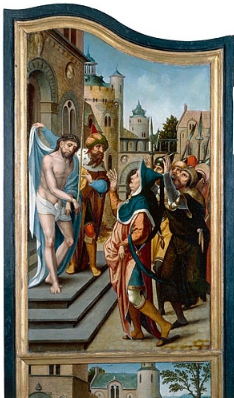
Face interne du volet gauche : l'Ecce homo (après restauration). 39, Baume-les-Messieurs