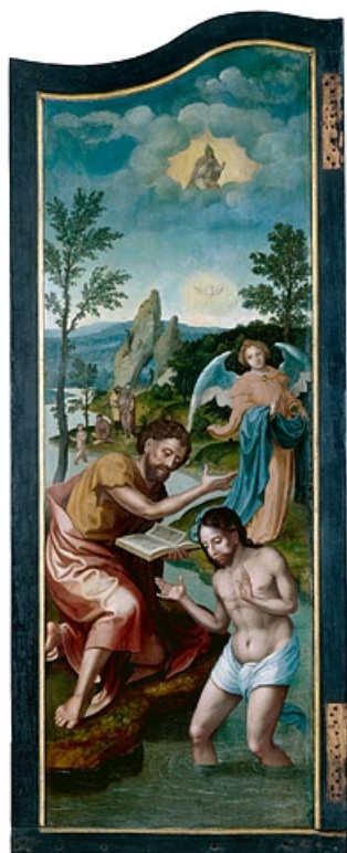
Face externe du volet gauche : le Baptême du christ (après restauration). 39, Baume-les-Messieurs