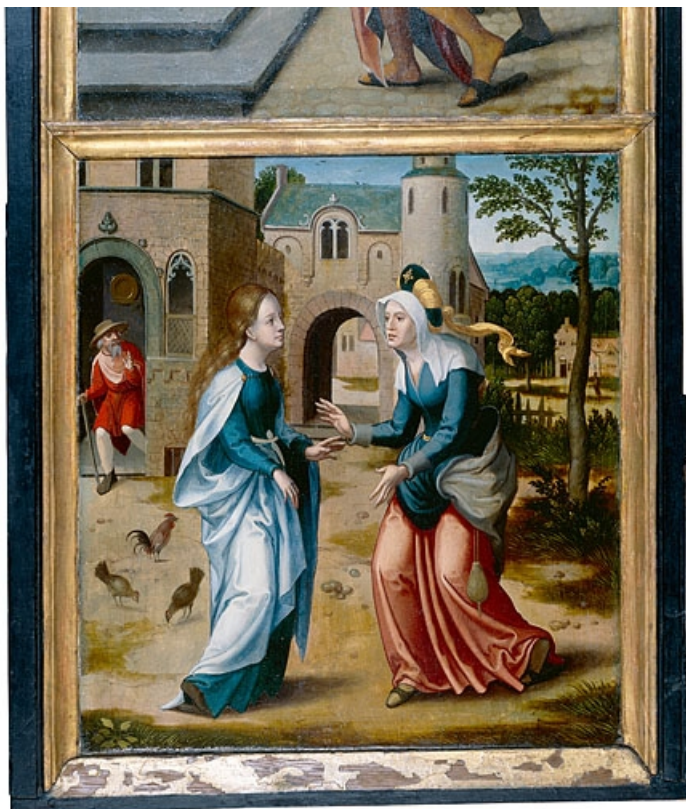
Face interne du volet gauche : la Visitation (après restauration). 39, Baume-les-Messieurs