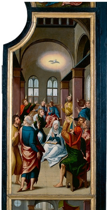
Face interne du volet droit : la Pentecôte (après restauration). 39, Baume-les-Messieurs