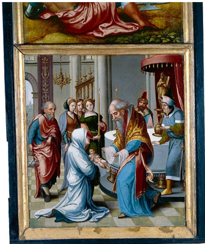
Face interne du volet droit : la Présentation au temple (après restauration). 39, Baume-les-Messieurs