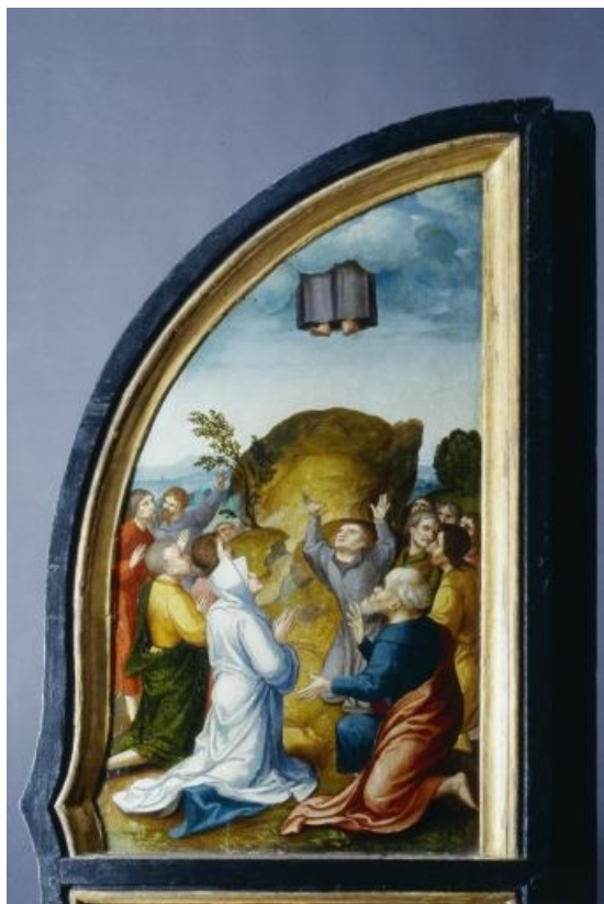
Face interne du volet droit : l'Ascension (après restauration). 39, Baume-les-Messieurs