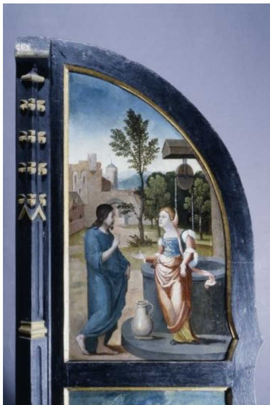
Face externe du volet droit : Jésus et la Samaritaine (après restauration). 39, Baume-les-Messieurs