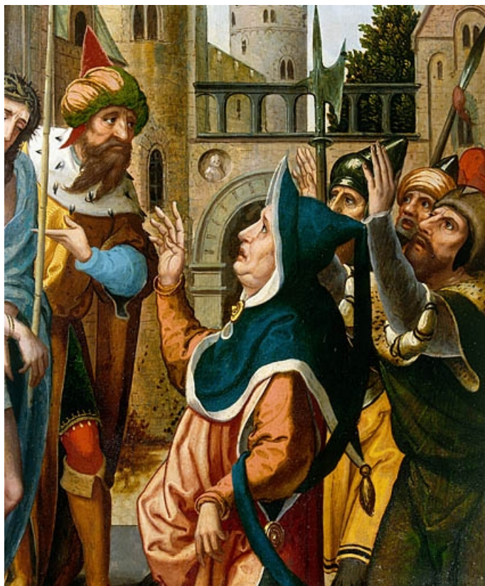
Face interne du volet gauche : Ecce Homo, détail : la femme de Pilate (après restauration). 39, Baume-les-Messieurs