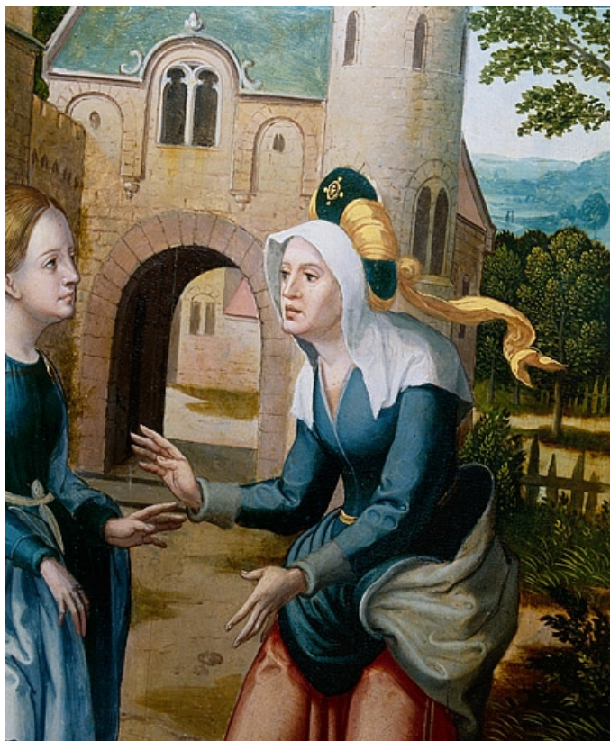
Face interne du volet gauche : la Visitation, détail : sainte Elisabeth (après restauration). 39, Baume-les-Messieurs