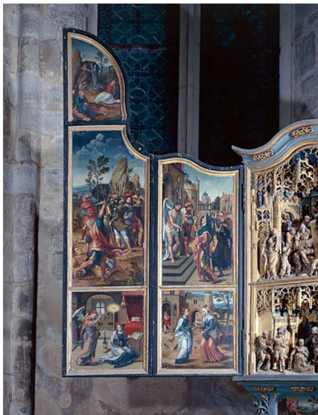
Face interne du volet gauche.