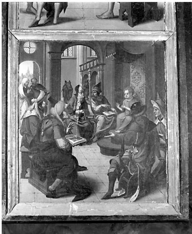
Jésus au milieu des docteurs.