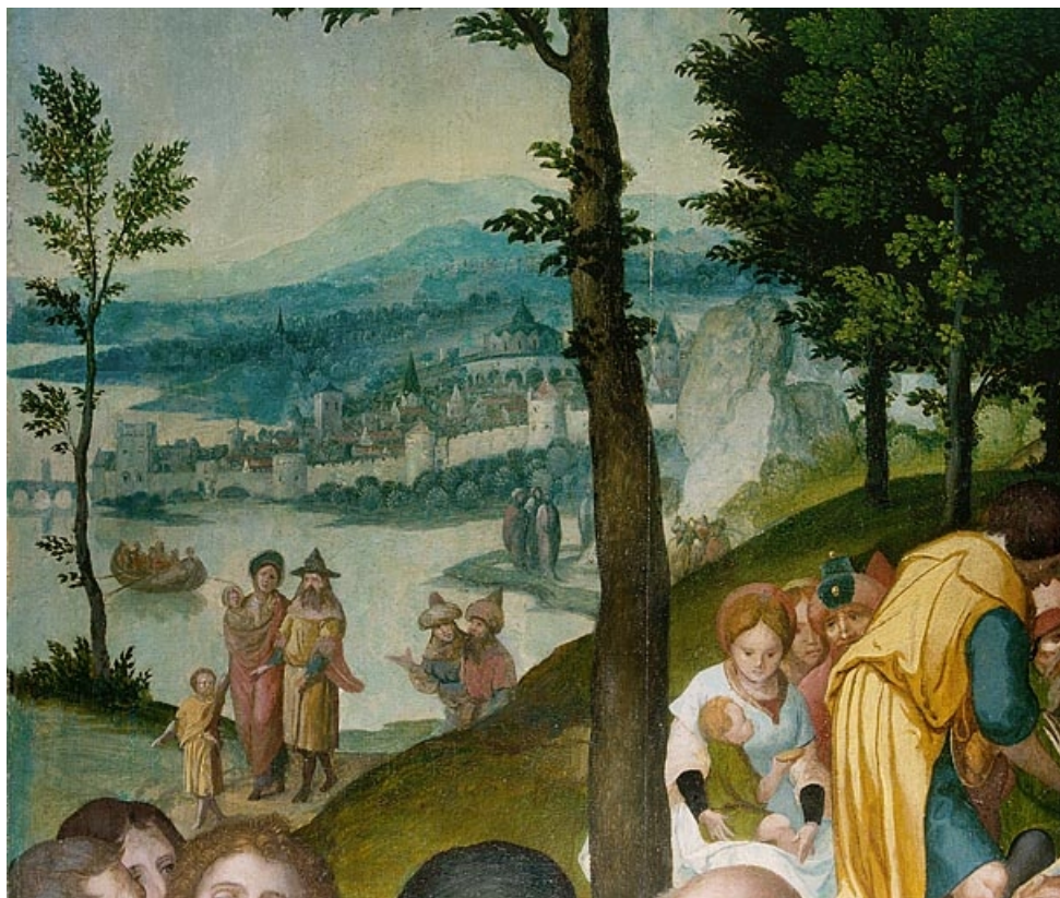
Face externe du volet gauche : la multiplication des poissons, détail : le paysage en arrière plan (après restauration). 39, Baume-les-Messieurs