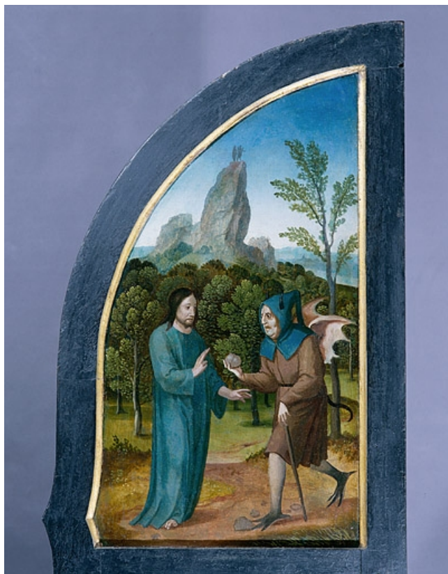
Face externe du volet gauche : la tentation du Christ dans le désert (après restauration). 39, Baume-les-Messieurs