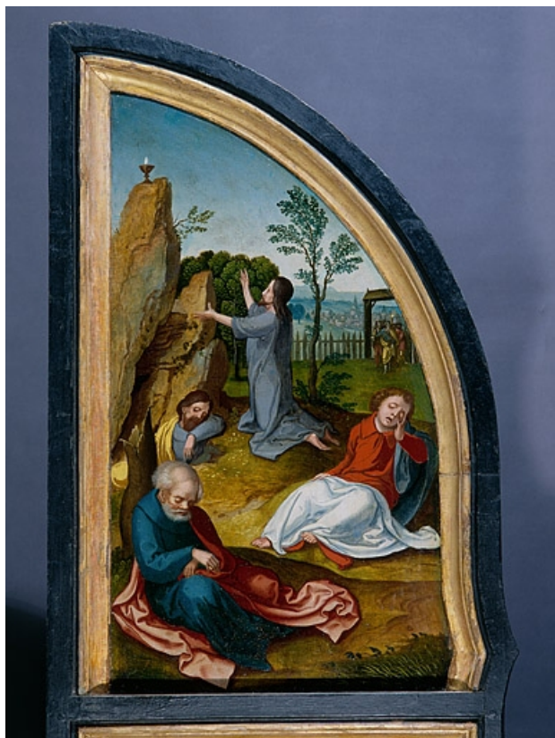
Face interne du volet gauche : l'agonie au jardin des oliviers (après restauration). 39, Baume-les-Messieurs