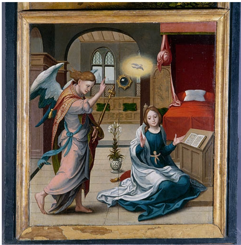
Face interne du volet gauche : l'Annonciation (après restauration). 39, Baume-les-Messieurs