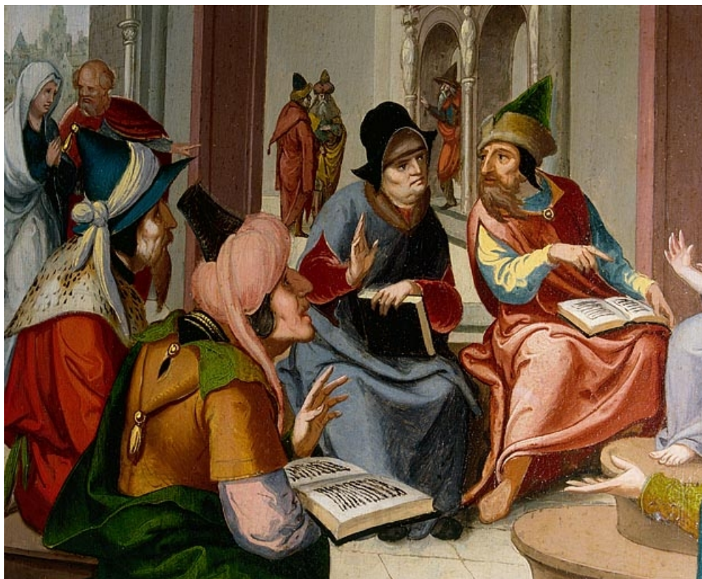
Face interne du volet droit : Jésus au milieu des docteurs, détail des personnages de l'arrière plan (après restauration). 39, Baume-les-Messieurs