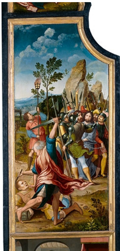
Face interne du volet gauche : l'Arrestation du Christ (après restauration). 39, Baume-les-Messieurs