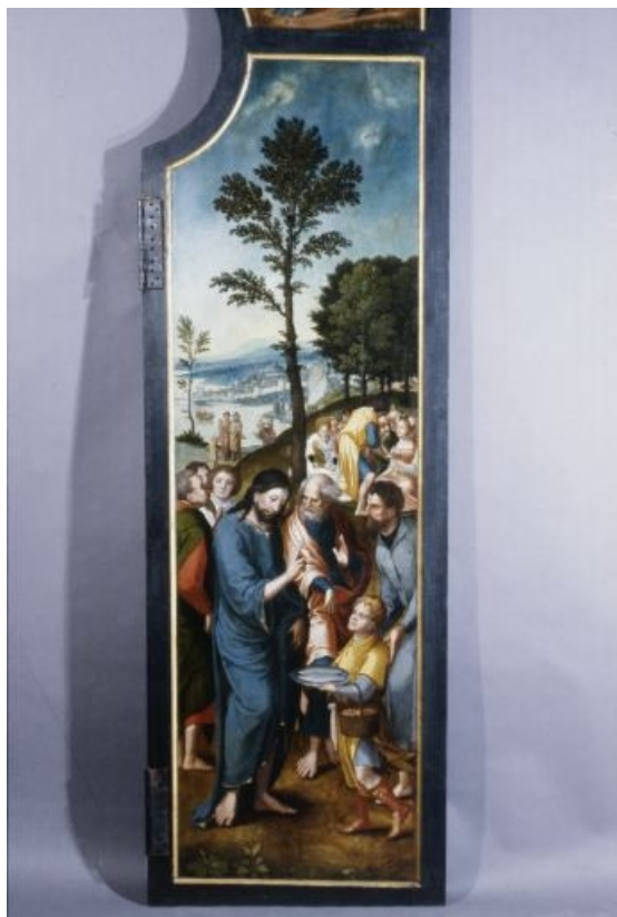
Face externe du volet gauche : la Multiplication des poissons (après restauration). 39, Baume-les-Messieurs