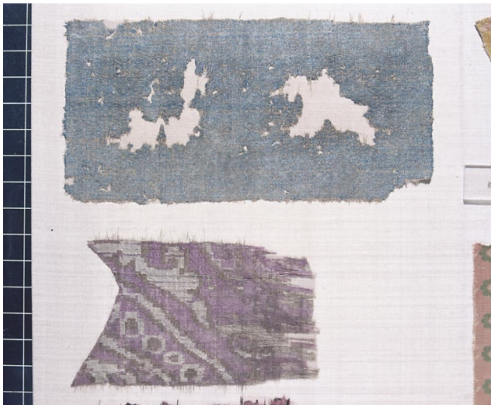
Morceau de samit façonné soie, Byzance ou Islam ? et morceau de samit façonné, Byzance. Inv. Vial 83.28, 83.20. 39, Baume-les-Messieurs