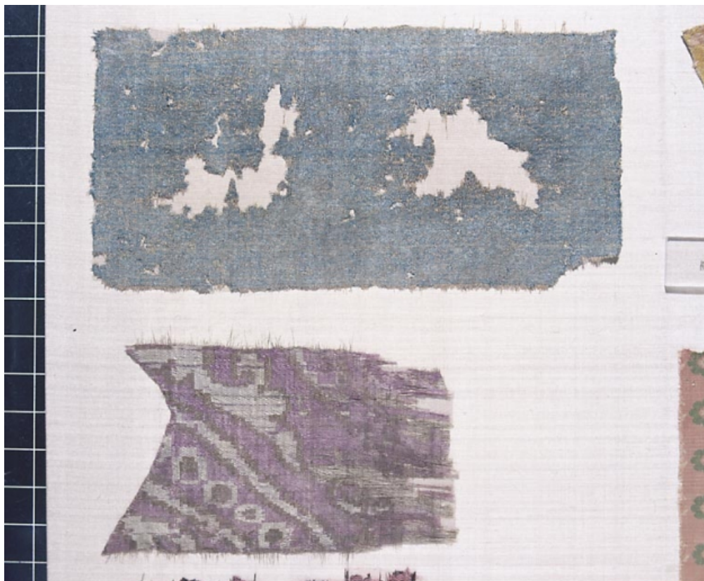
Morceau de samit façonné soie, Byzance ou Islam ? et morceau de samit façonné, Byzance. Inv. Vial 83.28, 83.20. 39, Baume-les-Messieurs