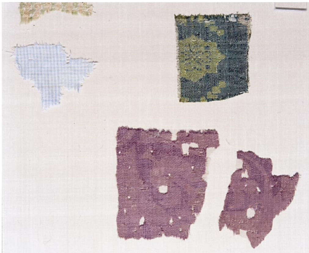
Fragments de lampas et de samit.