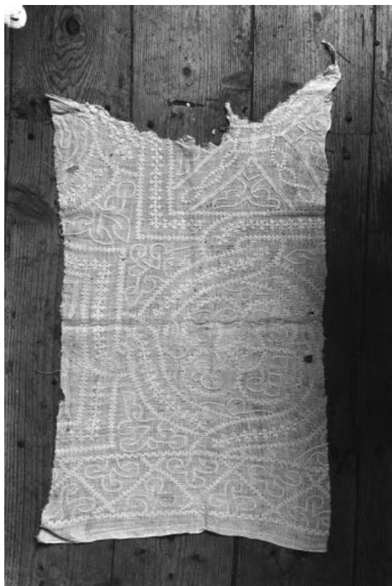
Vue d'un fragment blanc avec entrelacs.