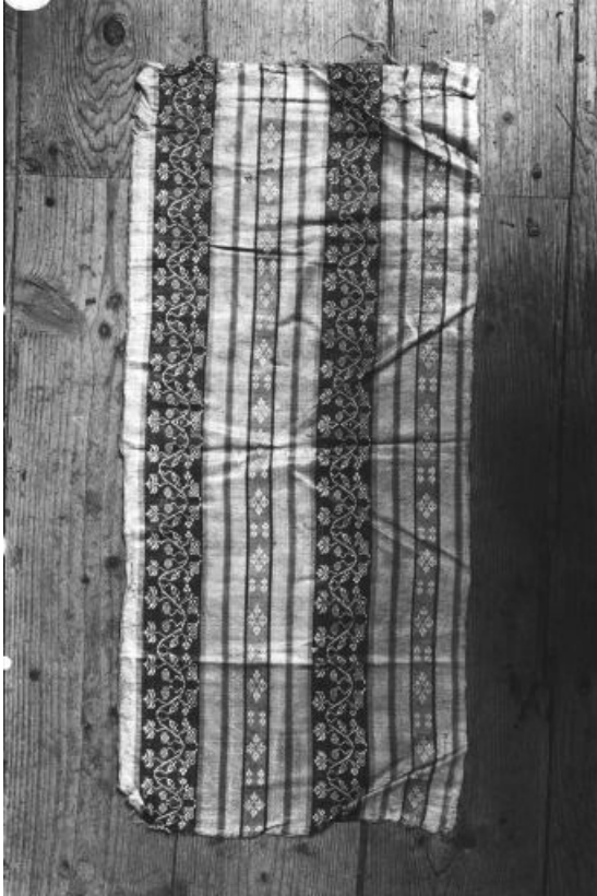
Vue d'un fragment avec feuilles de vigne et raisins.