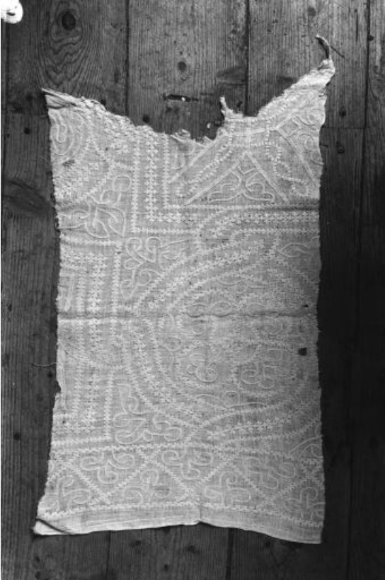
Vue d'un fragment blanc avec entrelacs.