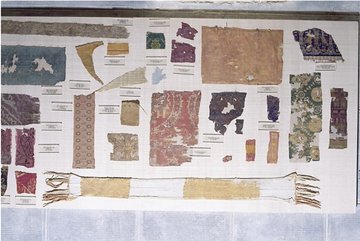
Ensemble des morceaux de tissu.