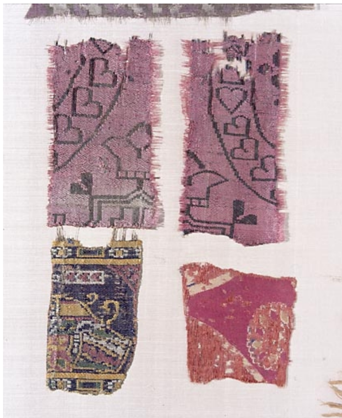
Quatre morceaux de samit façonné soie, Byzance ?Inv. Vial 83.4, 83.5, 83.23. 39, Baume-les-Messieurs