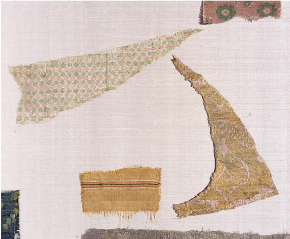
Morceaux de lampas soie, Italie ?, 14e siècle ?, de taffetas barré soie et de samit façonné soie, Byzance ? Inv. Vial 83.3, 83.17, 83.16. 39, Baume-les-Messieurs