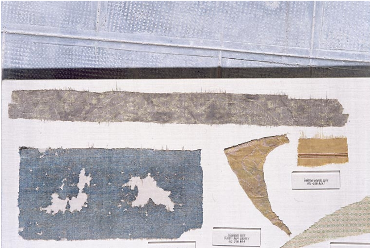
Morceaux de samit façonné soie, de samit façonné soie, Byzance ou Islam ?, de lampas soie, Italie?, 14e siècle ?, de taffetas barré soie et de samit façonné soie, Byzance ? Inv. Vial 83.1, 83.28, 83.3, 83.17, 83.17. 39, Baume-les-Messieurs