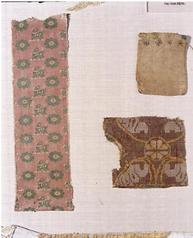
Morceau de samit façonné soie sicilien ?, bourse à relique, taffetas de soie, broderie de soie et d'or et morceau de samit façonné soie. Inv. Vial 83.22, 83.18.