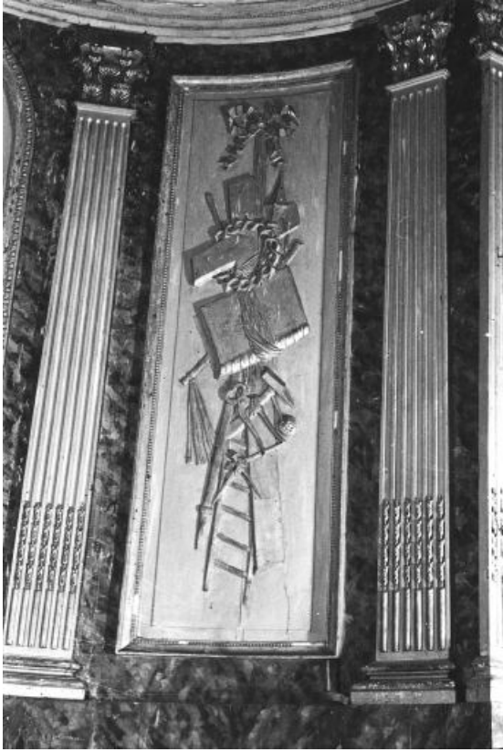
Vue du panneau droit du retable du Sacré-Coeur à décor en bas-relief représentant les symboles de l'Eucharistie. 39, Baume-les-Messieurs