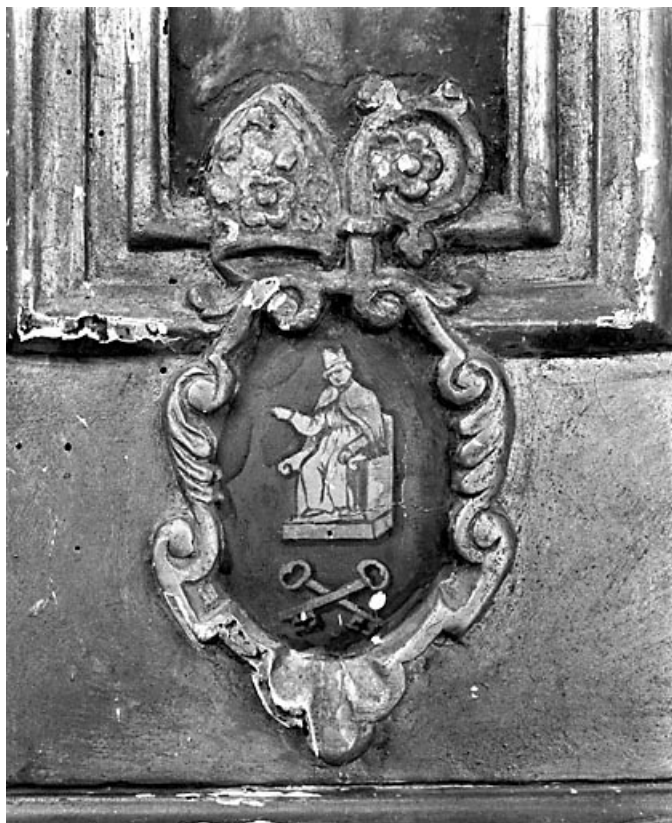
Détail : les armoiries de l'abbaye.