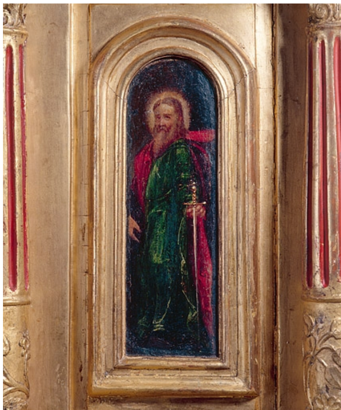
Détail : saint Paul.