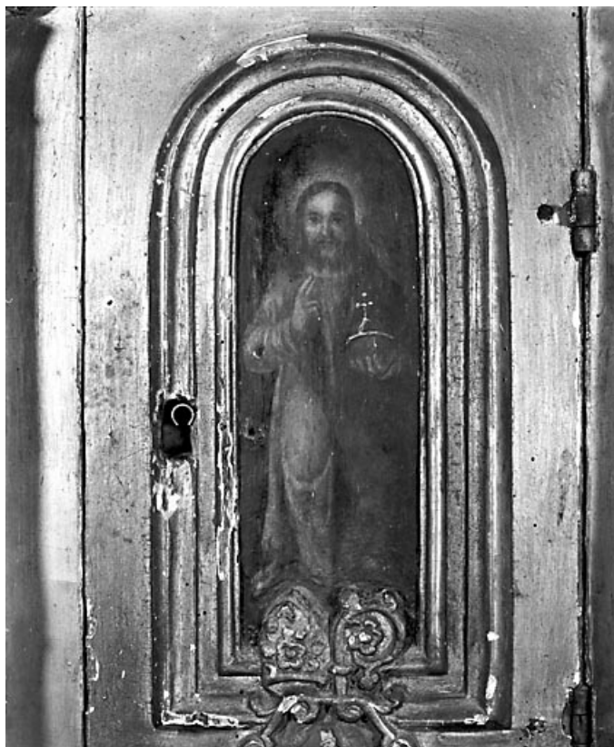
Détail : la porte avec le Christ peint. 39, Baume-les-Messieurs