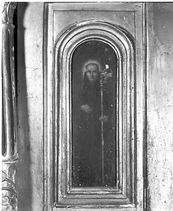
Détail : saint Benoît.