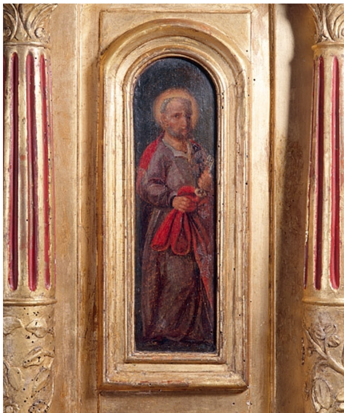
Détail : saint Pierre.