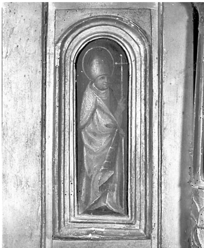
Détail : saint Guillaume. 39, Baume-les-Messieurs