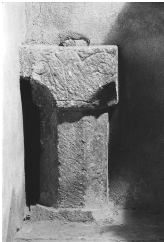
Vue d'une face.