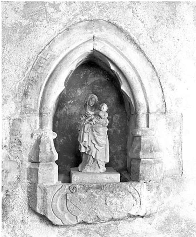
Eglise abbatiale : niche de la chapelle des tombeaux.