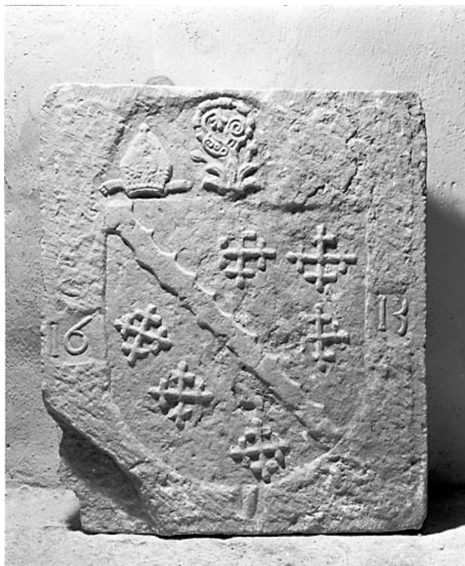
Armoiries de l'abbé Pierre de Binans. 39, Baume-les-Messieurs