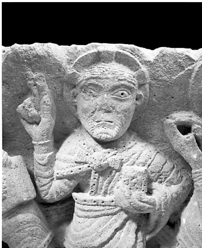
Détail : buste du Christ.