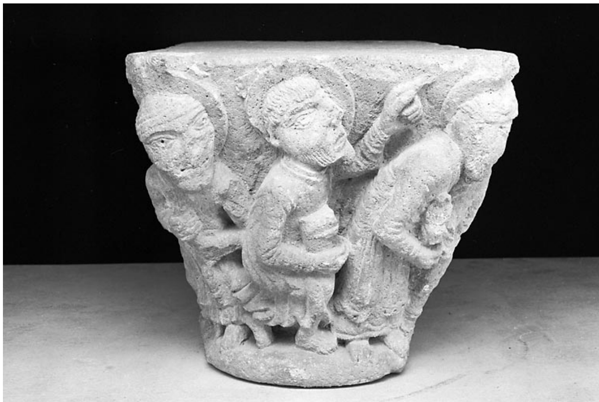
Premier petit côté : trois apôtres.