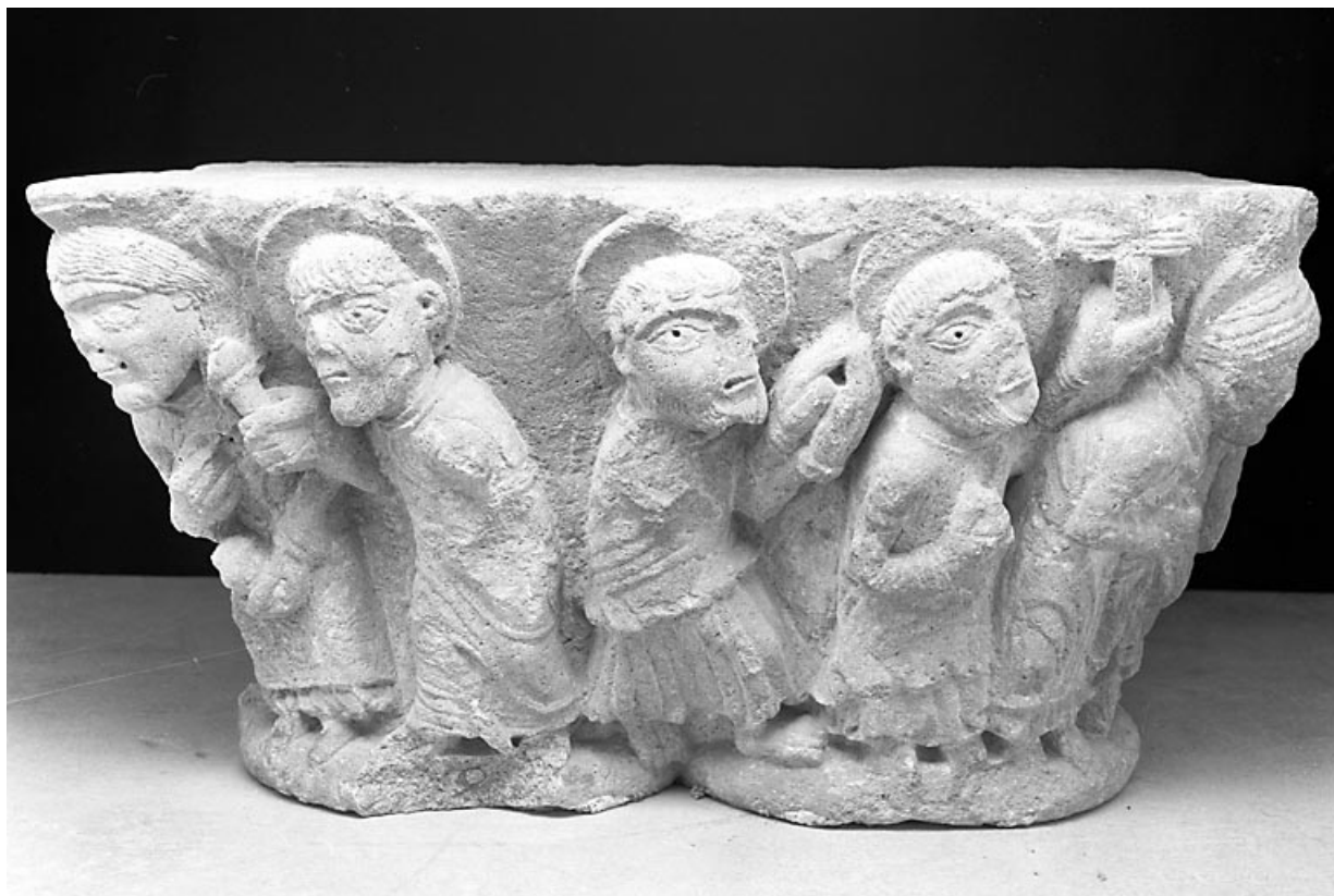
Deuxième grand côté : quatre apôtres et sainte Marie Madeleine.