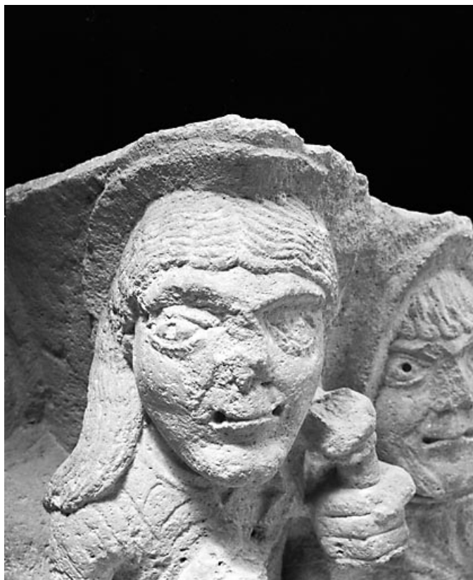
Détail : tête de sainte Marie Madeleine. 39, Baume-les-Messieurs