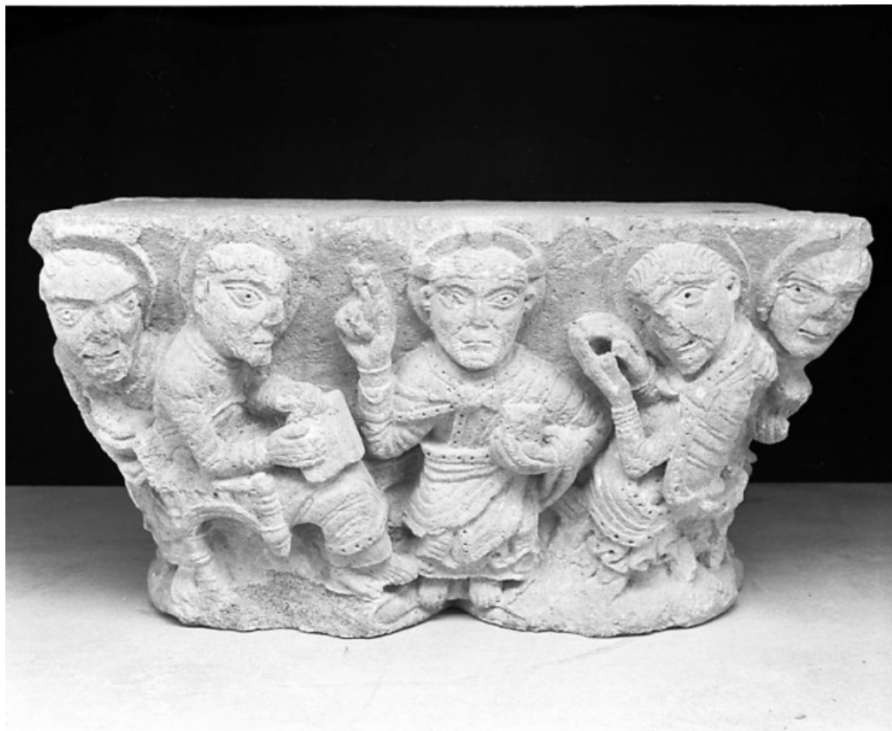
Premier grand côté : le Christ et quatre apôtres, vu de face.