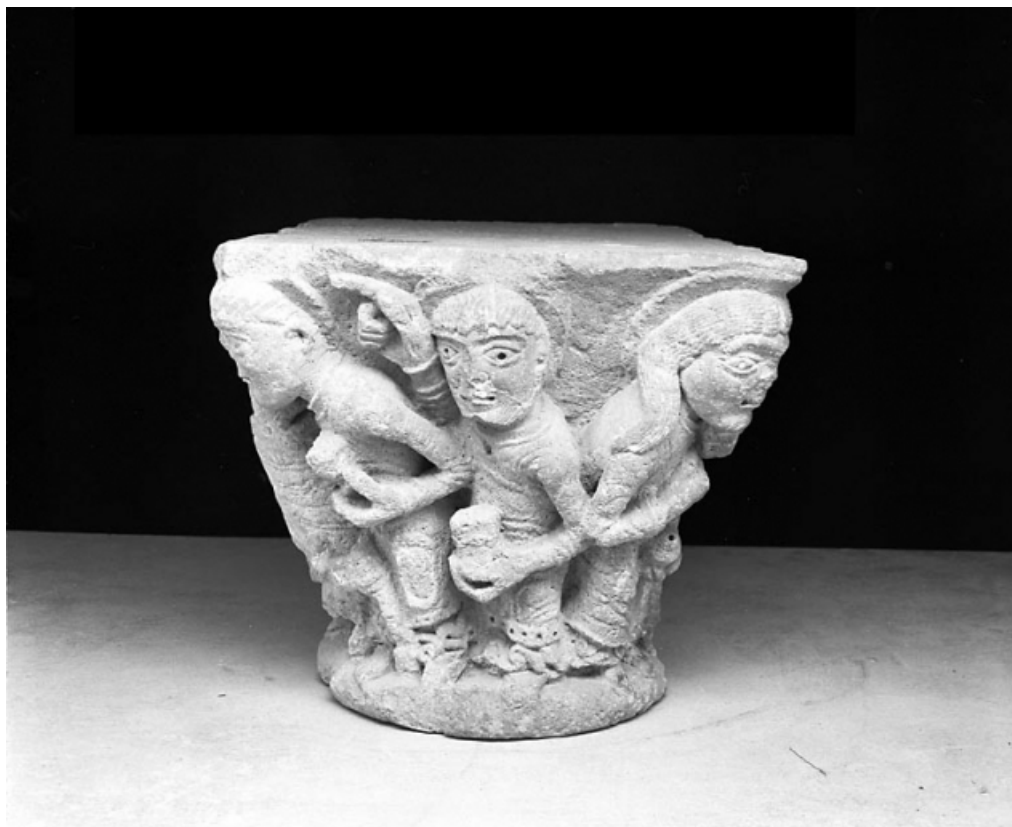
Deuxième petit côté : deux apôtres et sainte Marie Madeleine.