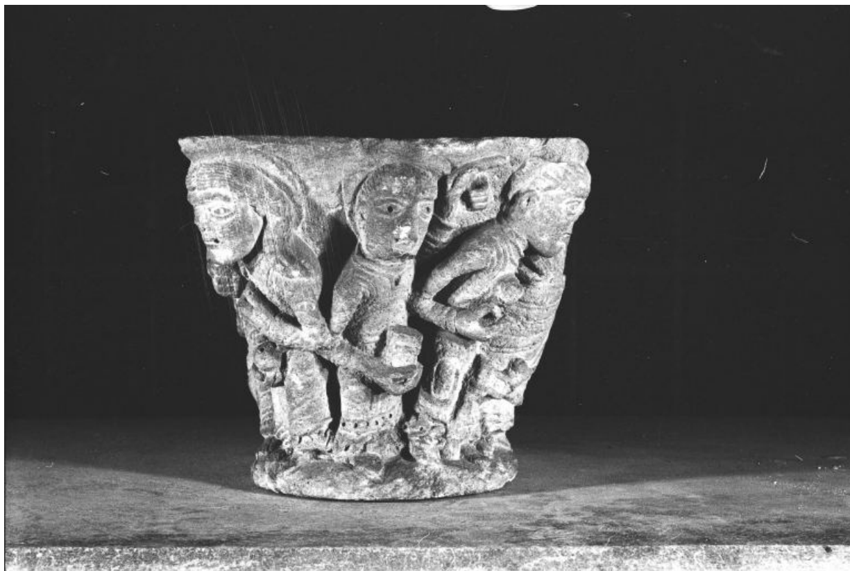
Vue d'une face : sainte Madeleine ?