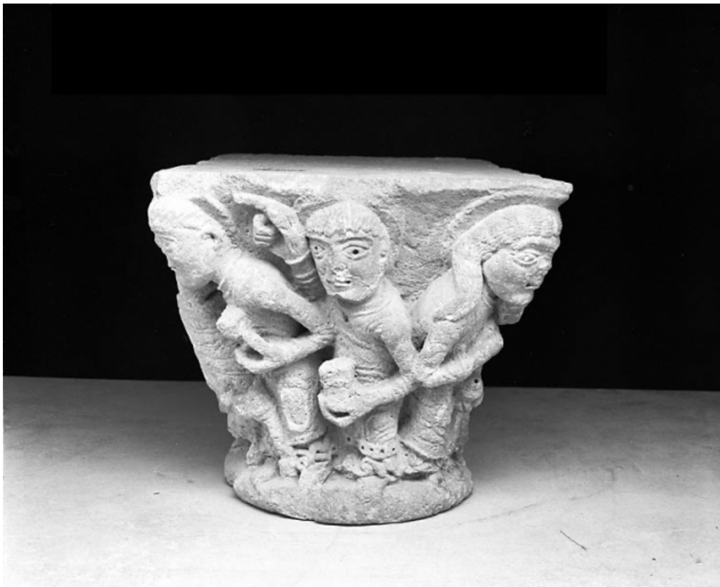
Deuxième petit côté : deux apôtres et sainte Marie Madeleine.