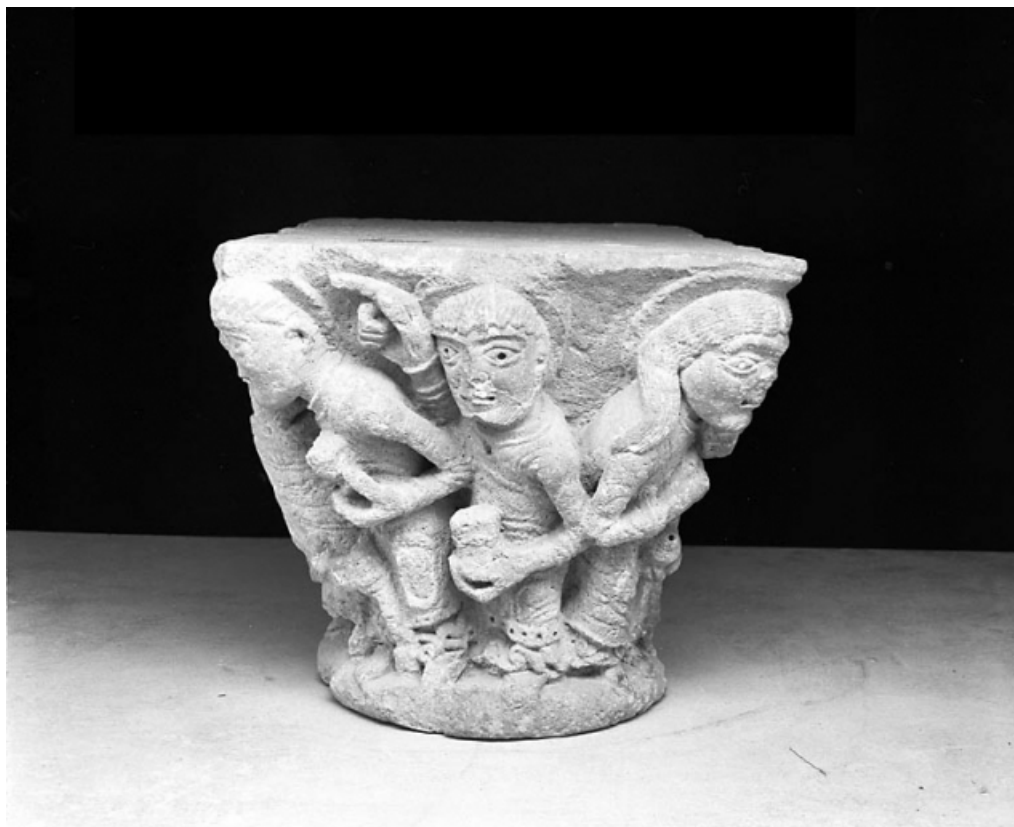
Deuxième petit côté : deux apôtres et sainte Marie Madeleine.