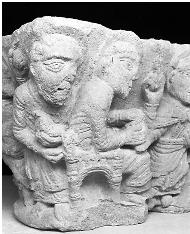
Premier grand côté : les deux apôtres de gauche.