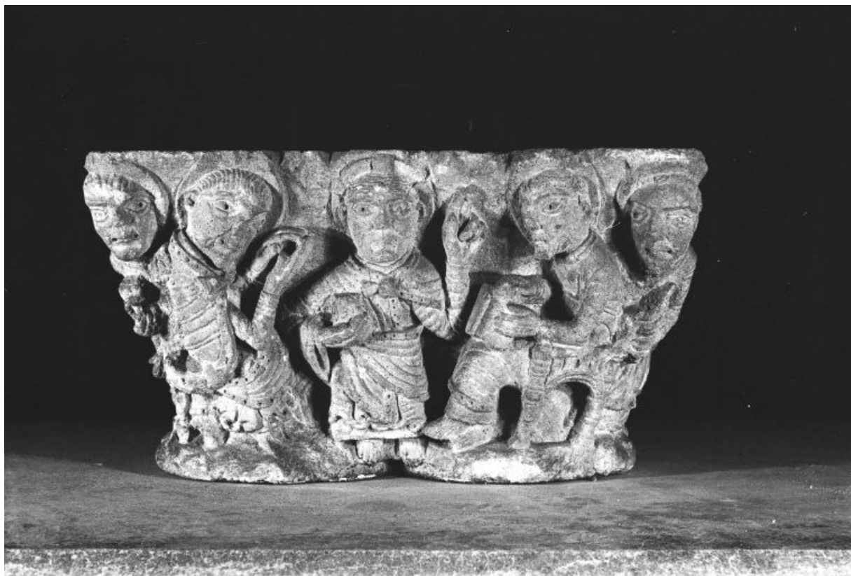
Vue d'une face, Christ bénissant.