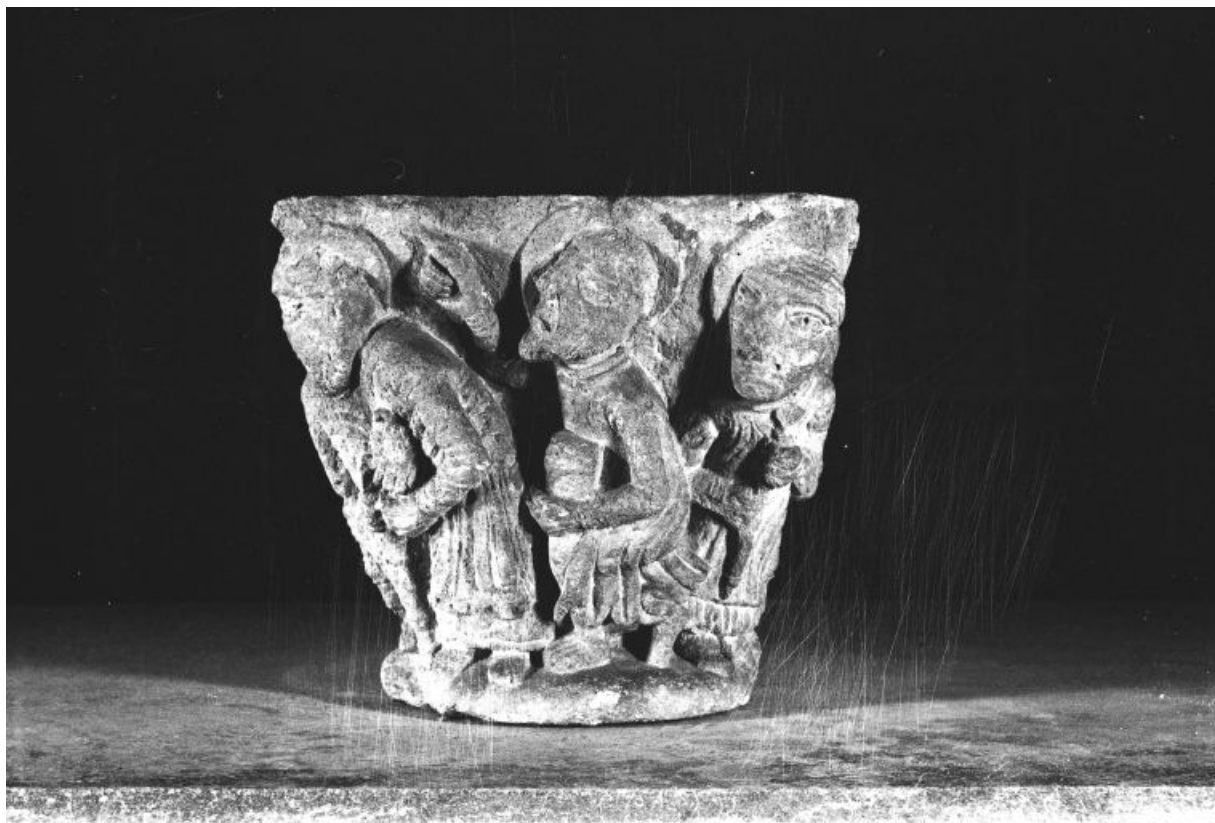
Vue d'une face, apôtre.