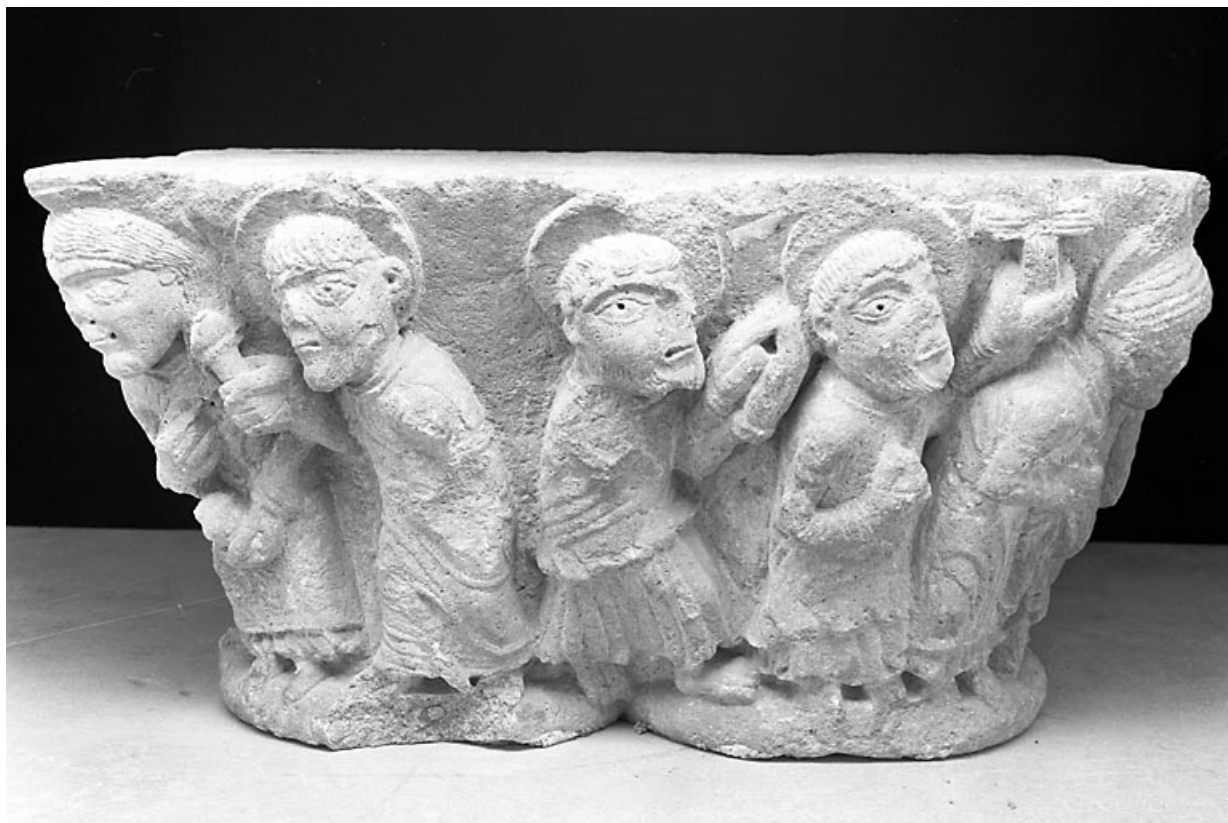
Deuxième grand côté : quatre apôtres et sainte Marie Madeleine.