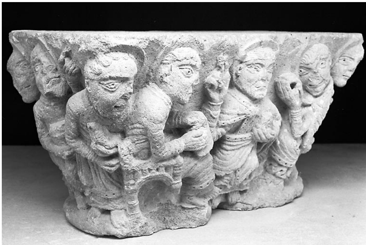
Premier grand côté : le Christ et quatre apôtres, vu de trois quarts. 39, Baume-les-Messieurs