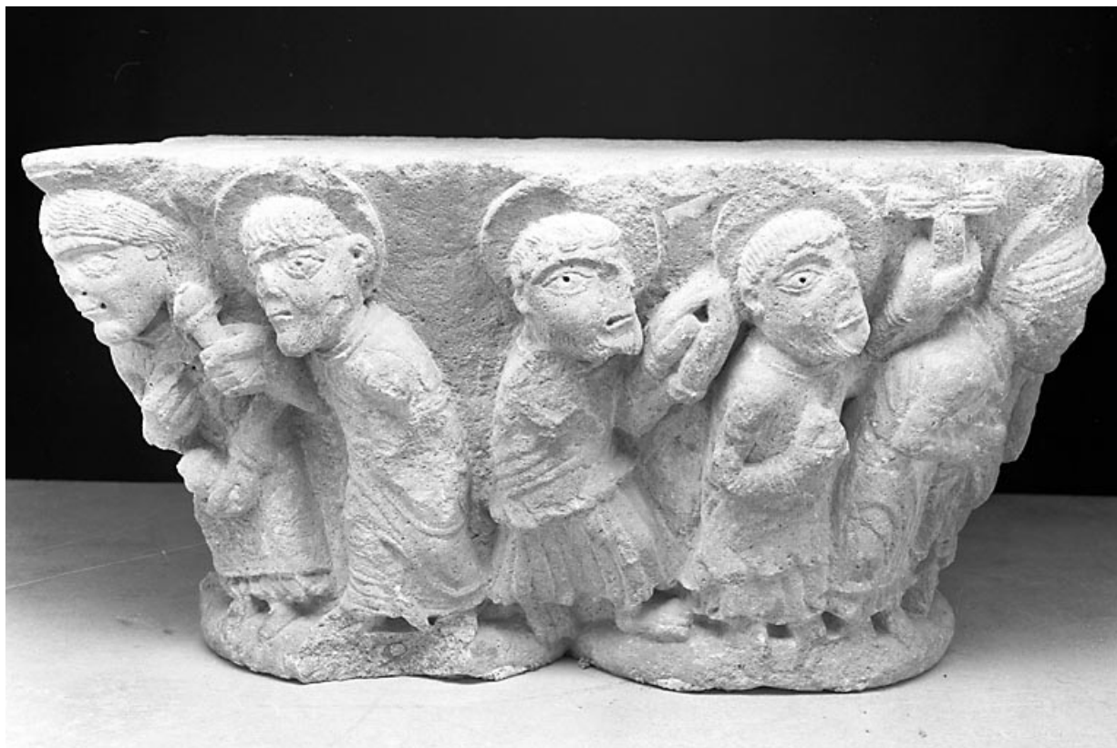
Deuxième grand côté : quatre apôtres et sainte Marie Madeleine.