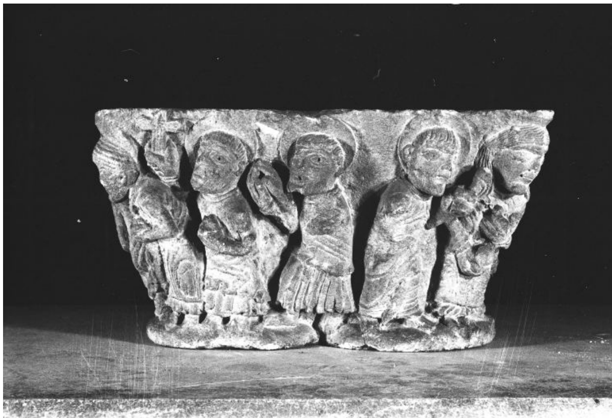
Vue d'un grand côté : sainte Madeleine ?