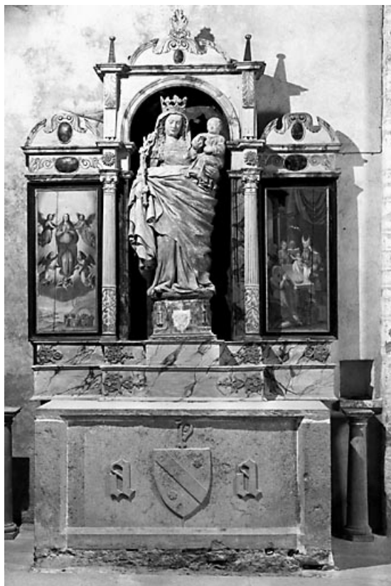
Autel latéral nord, dédié à la Vierge, vue d'ensemble. 39, Baume-les-Messieurs