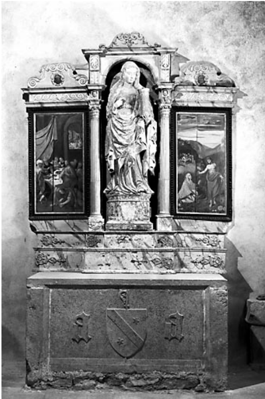
Autel latéral sud, dédié à sainte Marie Madeleine, vue d'ensemble. 39, Baume-les-Messieurs