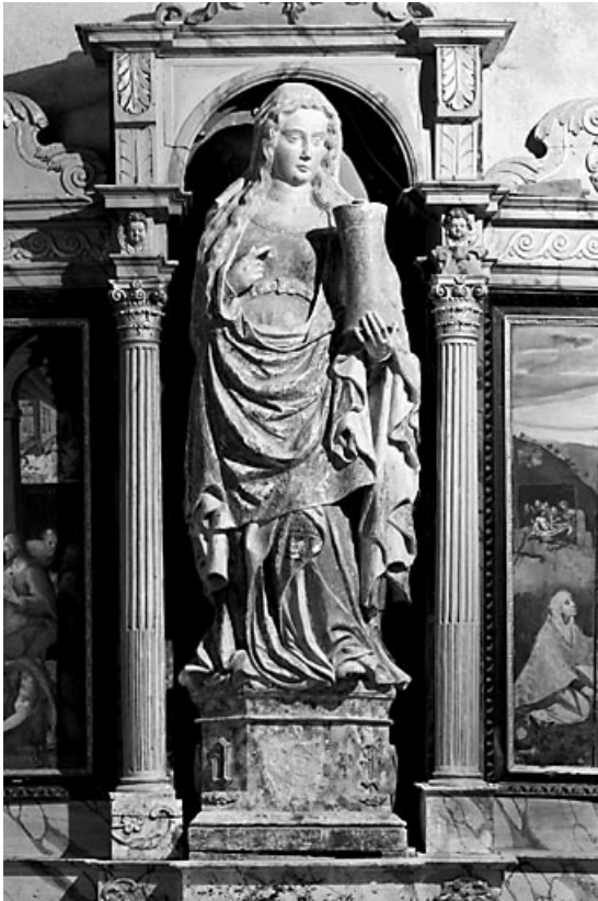
Sainte Marie Madeleine, vue de face.