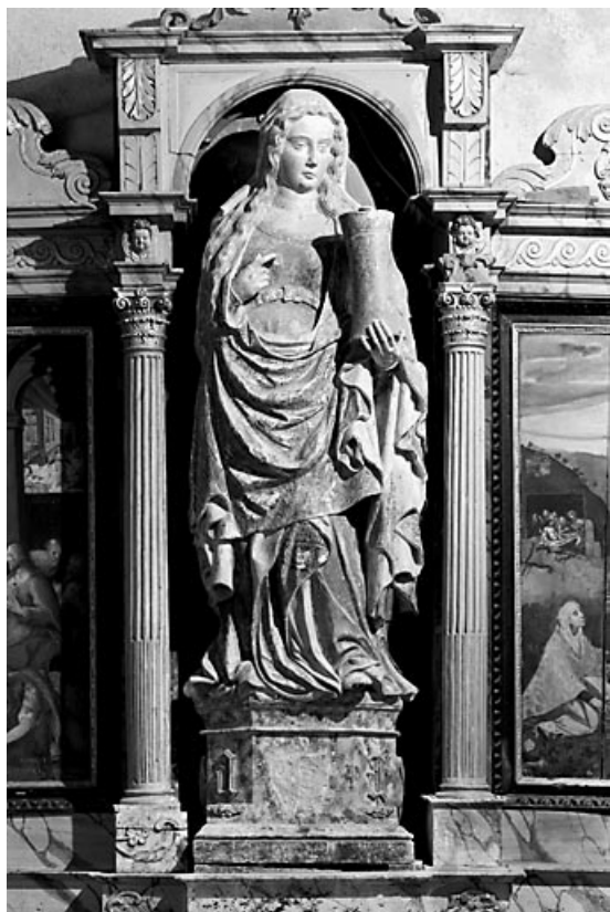
Sainte Marie Madeleine, vue de face.