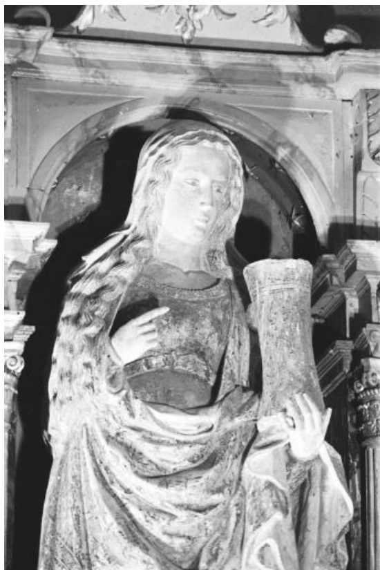
Vue de face, partie supérieure.