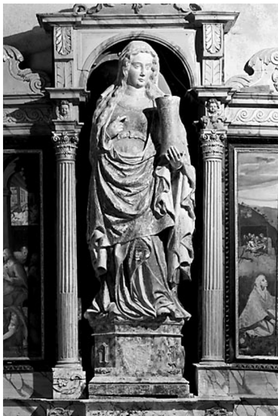
Sainte Marie Madeleine, vue de face.