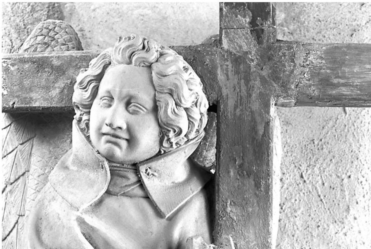
Détail : la tête de l'ange. 39, Baume-les-Messieurs