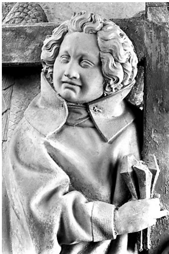
Détail : la tête de l'ange. 39, Baume-les-Messieurs