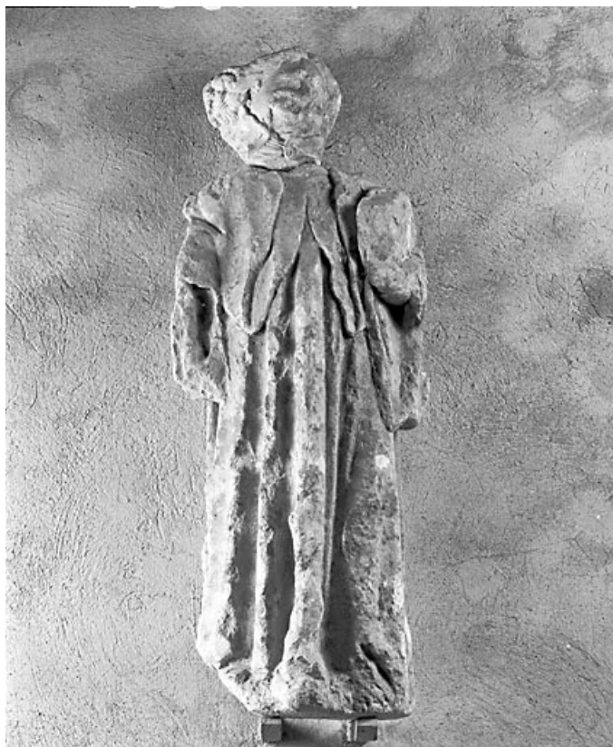
Deuxième statue : vue de trois quarts.