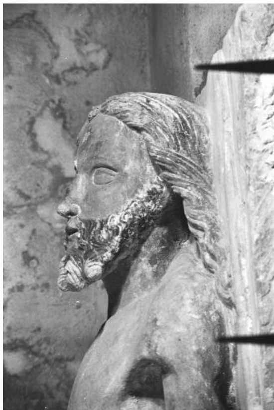
Détail : tête du Christ.