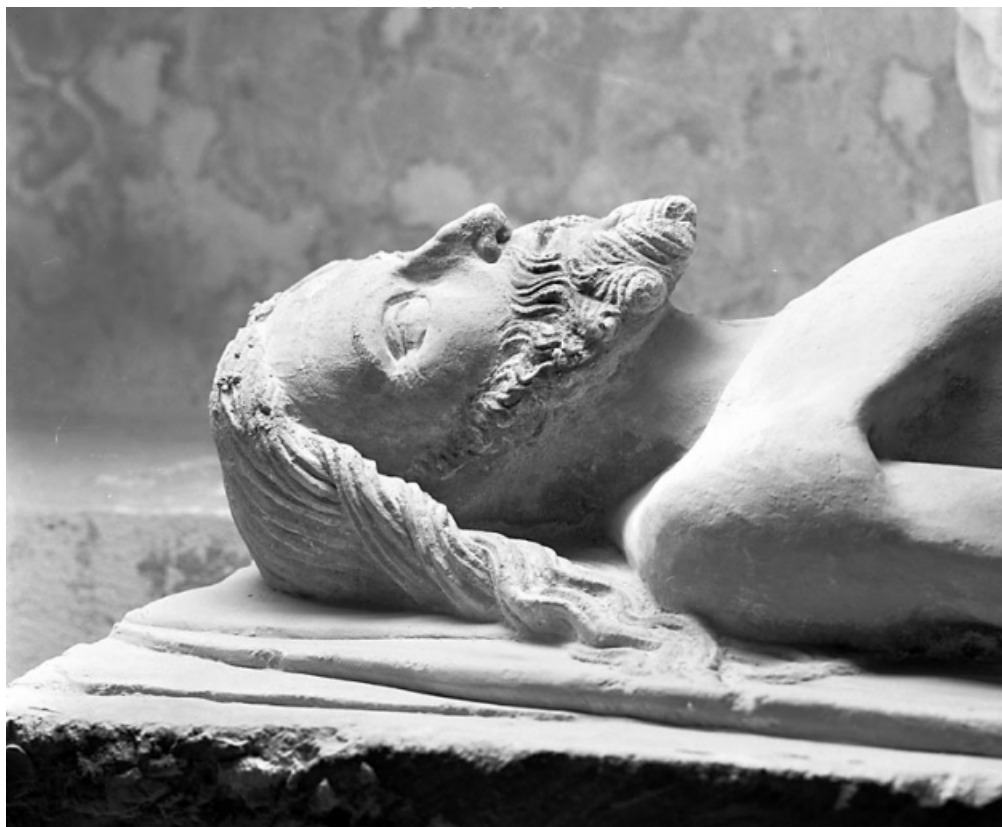
Buste du Christ de profil.