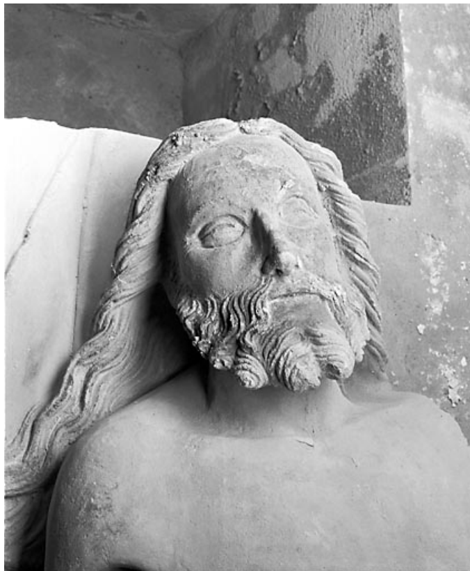
Buste du Christ, de face.