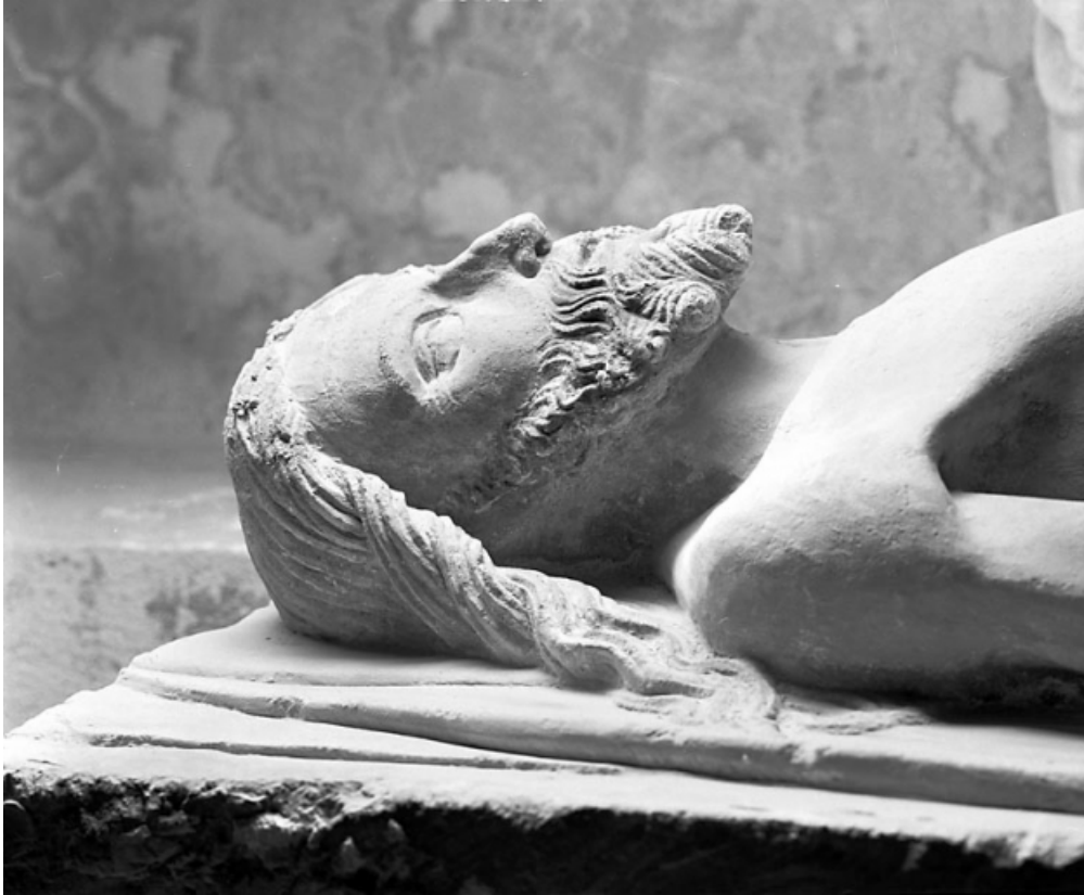
Buste du Christ de profil.