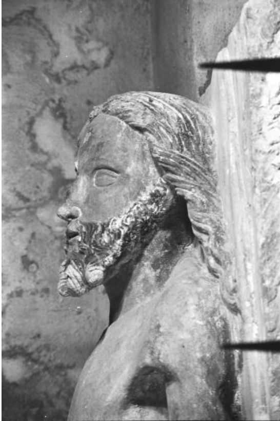
Détail : tête du Christ.