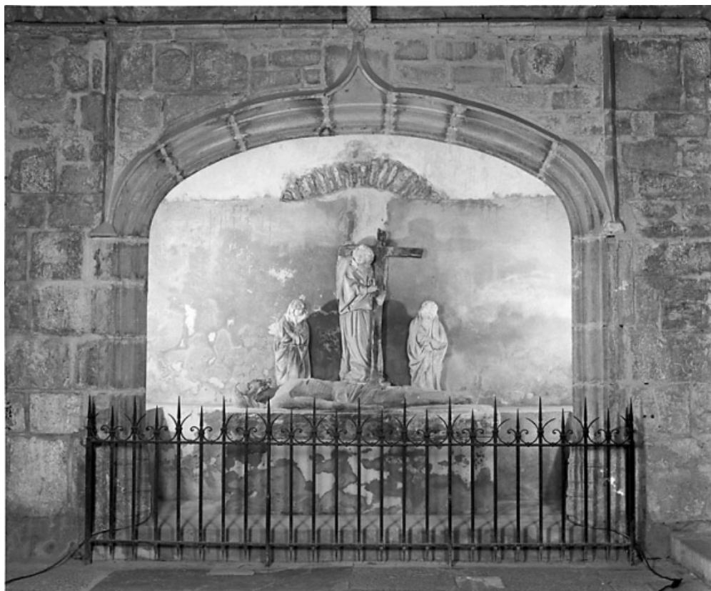
Groupe sculpté dans son enfeu.