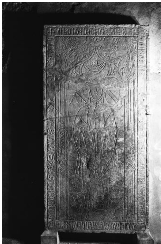
Vue de face de la dalle.