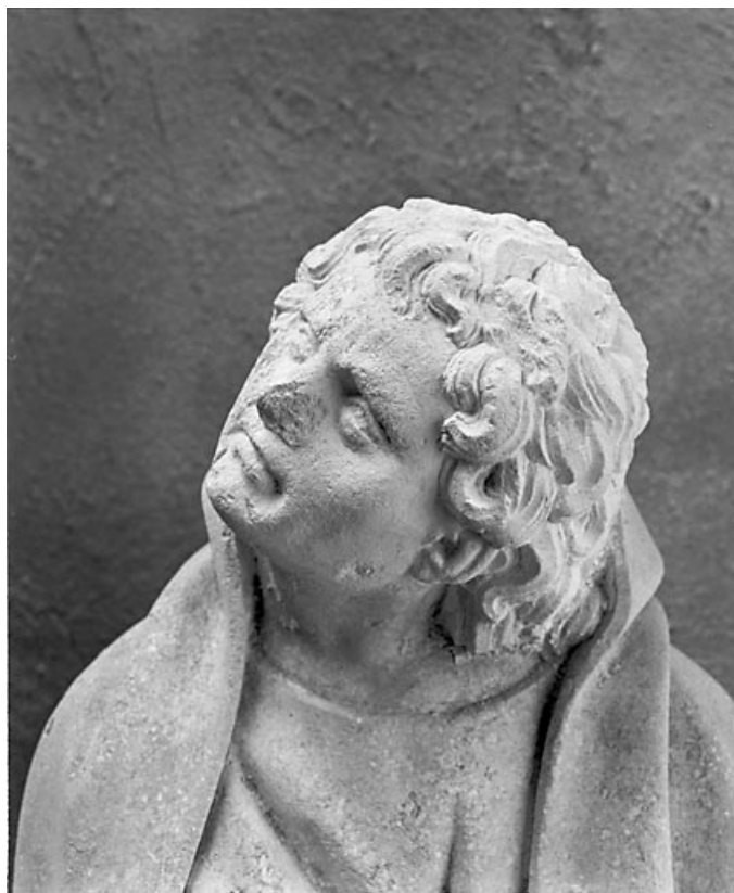
Détail : la tête de saint Jean.