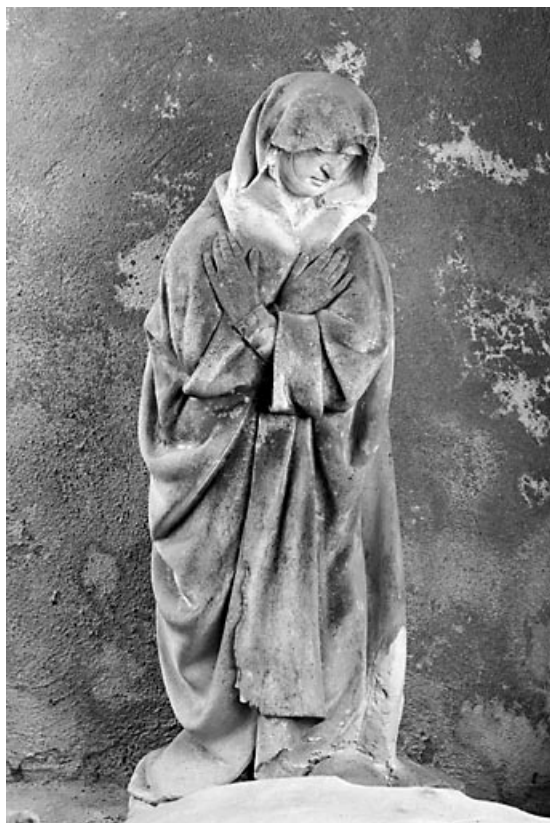
La Vierge, vue générale.