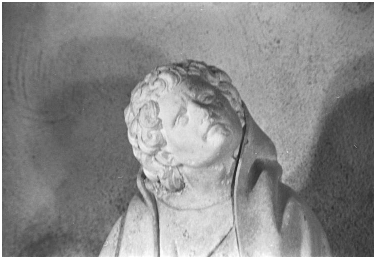
Saint Jean : détail.