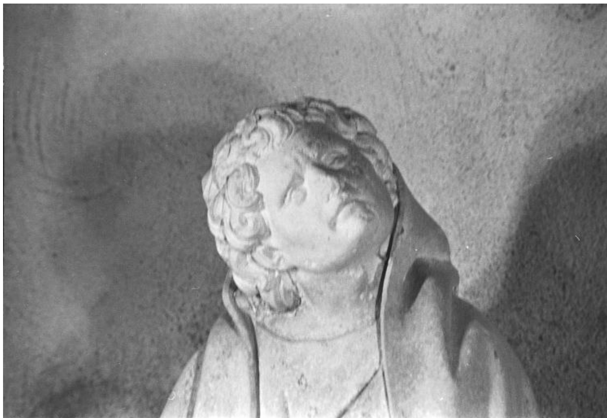
Saint Jean : détail.