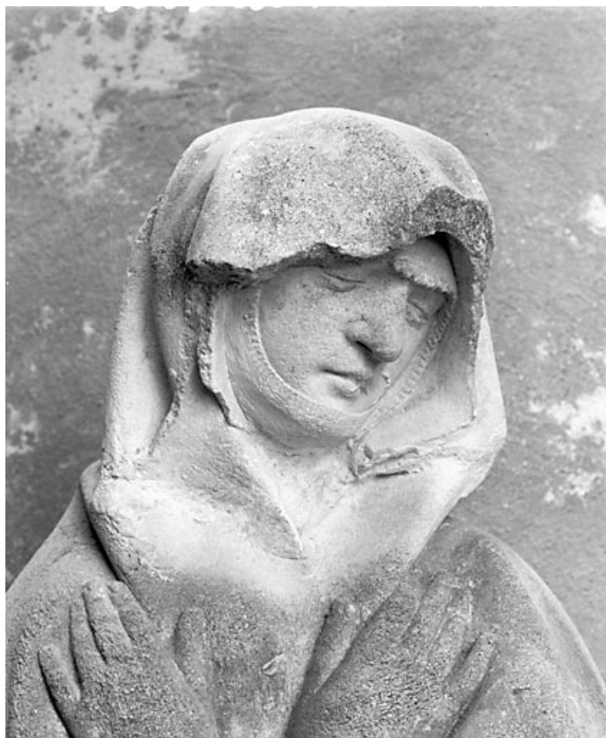
Détail : la tête de la vierge.