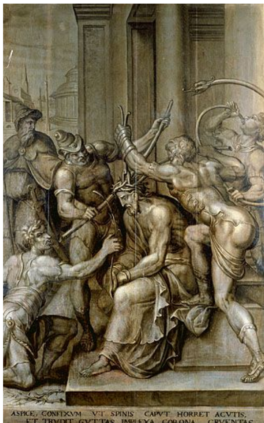
Panneau 3 verso : le Christ aux outrages.