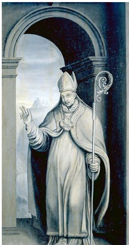
Panneau 4 verso : saint Augustin?