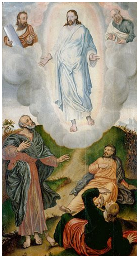
Panneau 4 recto : la Transfiguration.