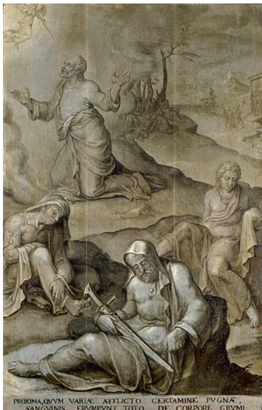
Panneau 2 verso : le Christ au Jardin des Oliviers.. 39, Nozeroy rue Saint-Antoine