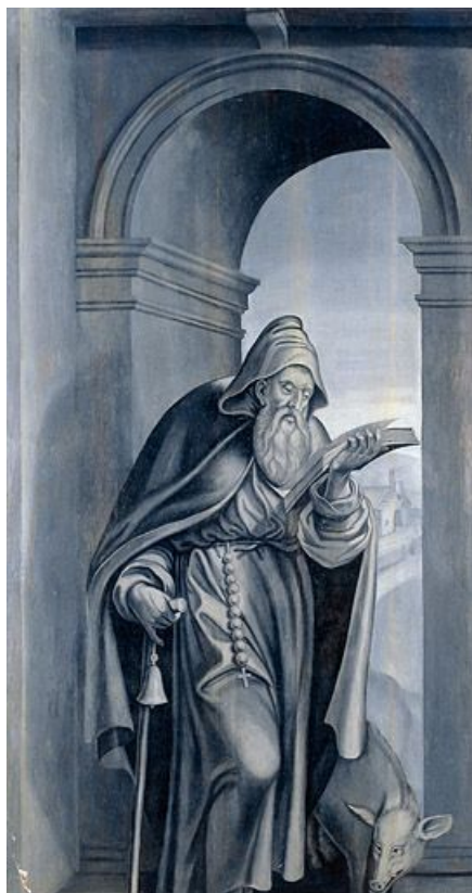
Panneau 1 verso : saint Antoine.