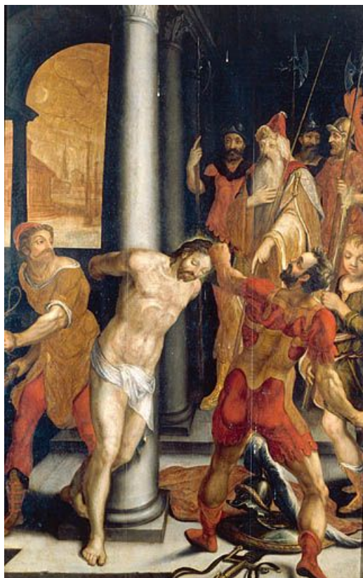
Panneau 2 recto : la Flagellation.