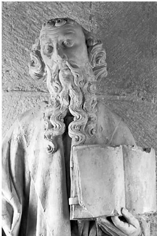
Détail : le buste du saint. 39, Baume-les-Messieurs