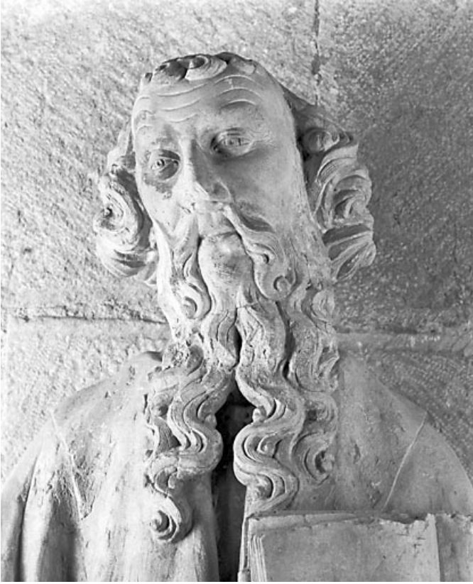
Détail : la tête du saint.