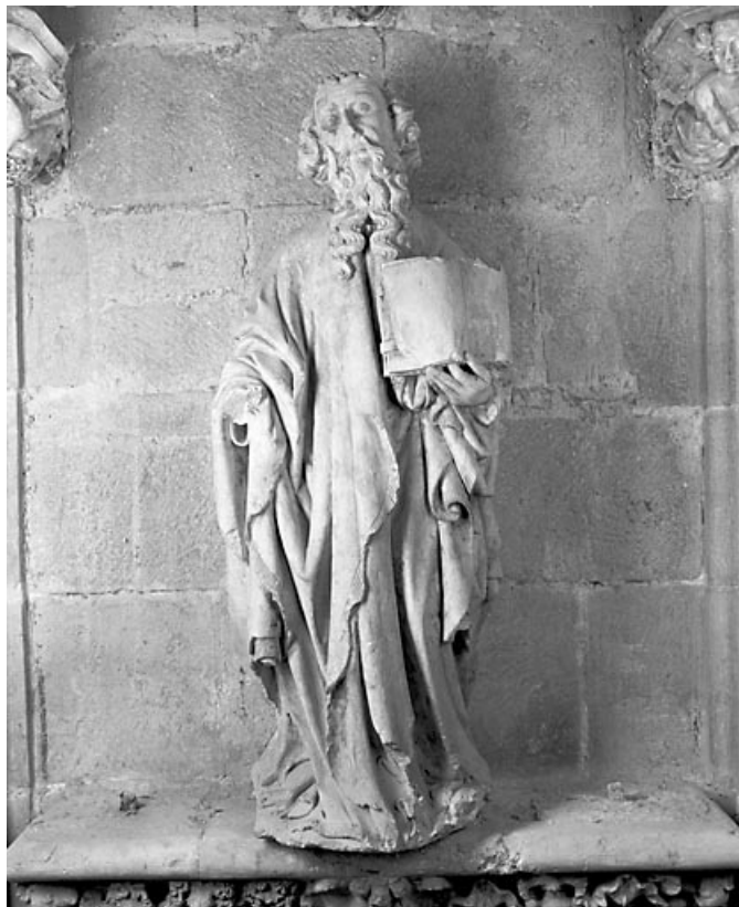
Vue générale, de face.